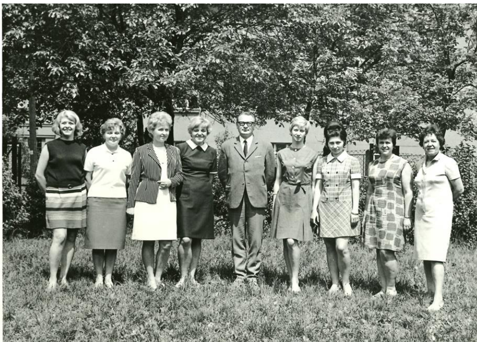
Obrázek 4, Zvláštní škola v Košířích, 1971