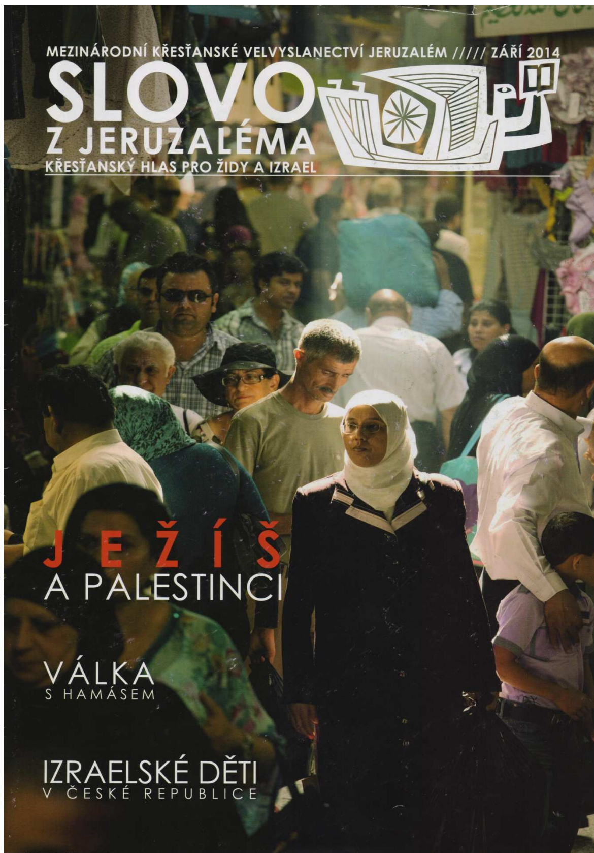
Příloha č. 4: Časopis české pobočky ICEJ Slovo z Jeruzaléma.