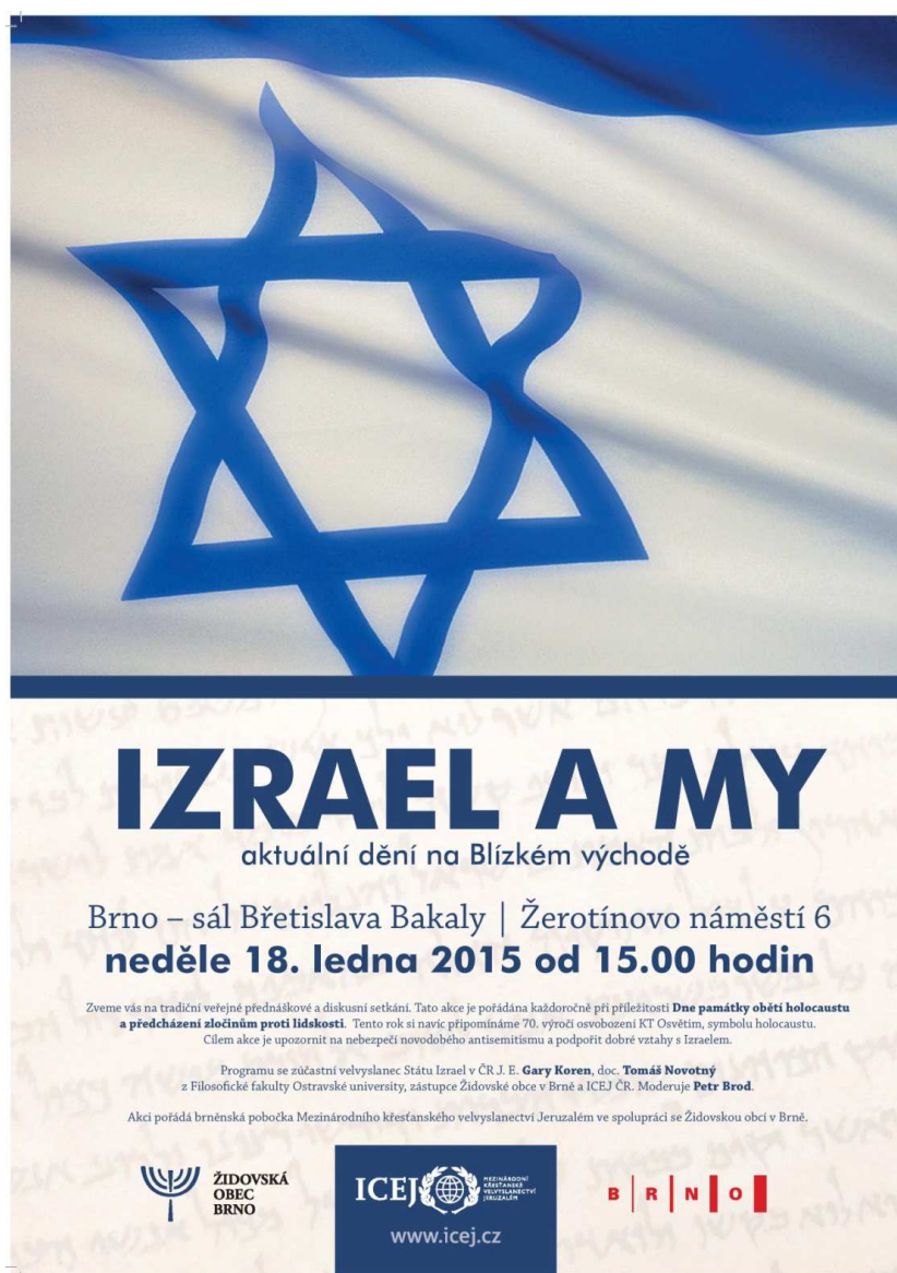
Příloha č. 2: Propagační materiál brněnské akce „Izrael a my“