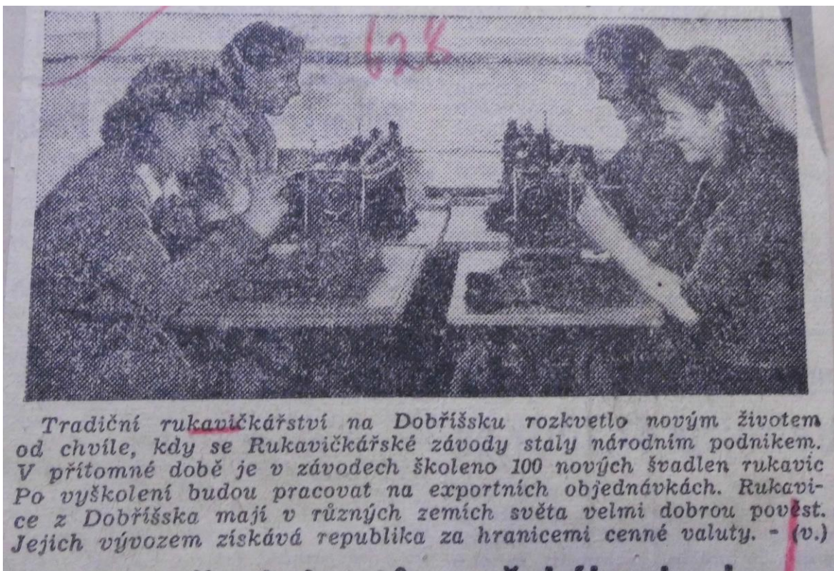
Příloha č. 5: Školení nových švadlen.