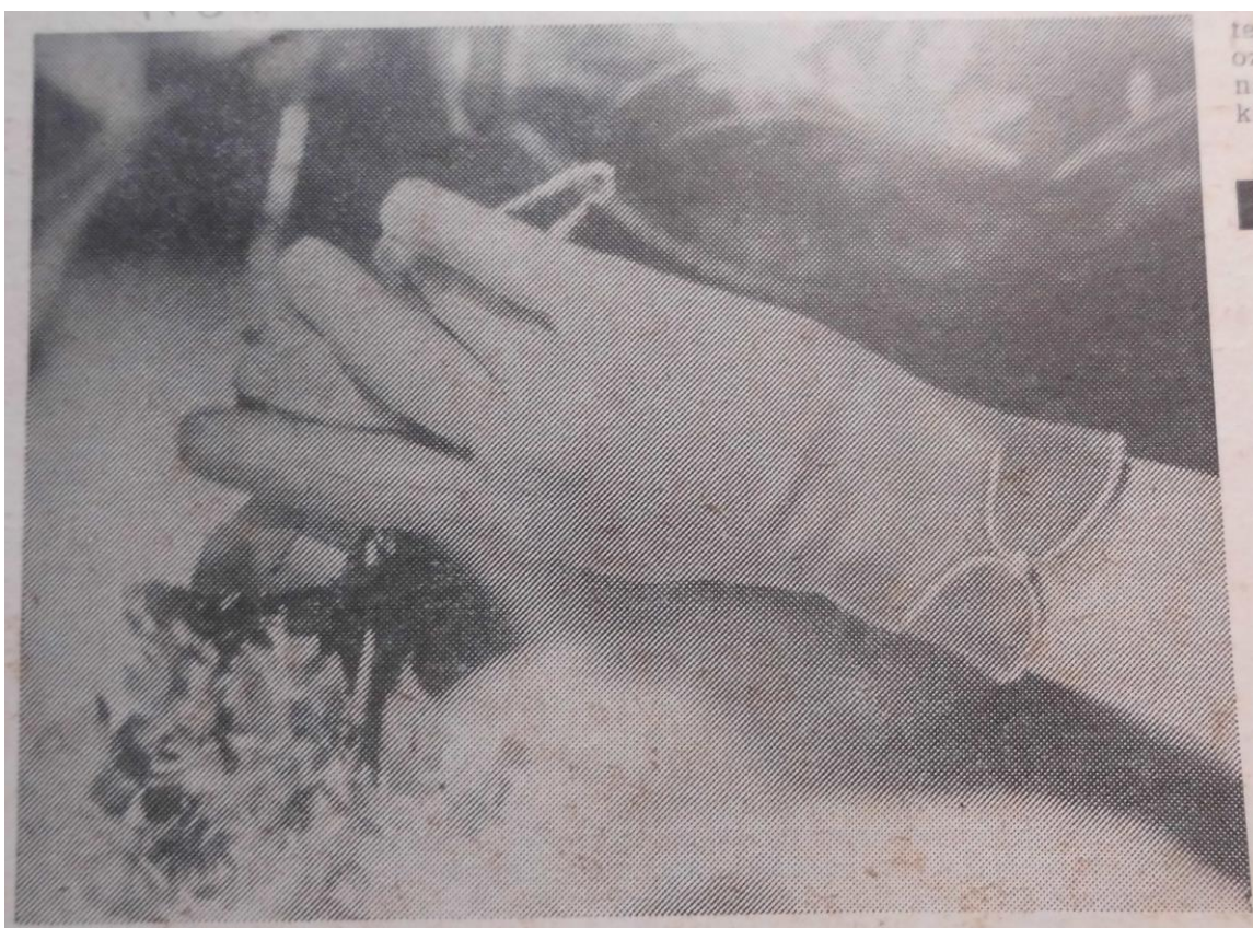
Příloha č. 6: Mocheto rukavice.