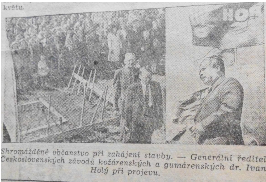
Příloha č. 3: Stavba největší továrny na rukavice.