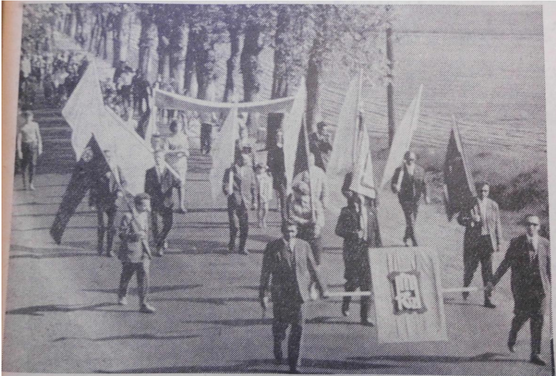
Na snímcích Jana Brskovského záběry z průvodu RZ