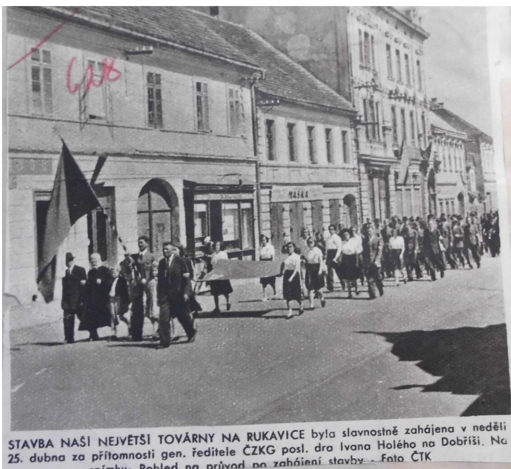
Příloha č. 4: Slavnostní zahájení stavby dobříšské továrny – průvod.