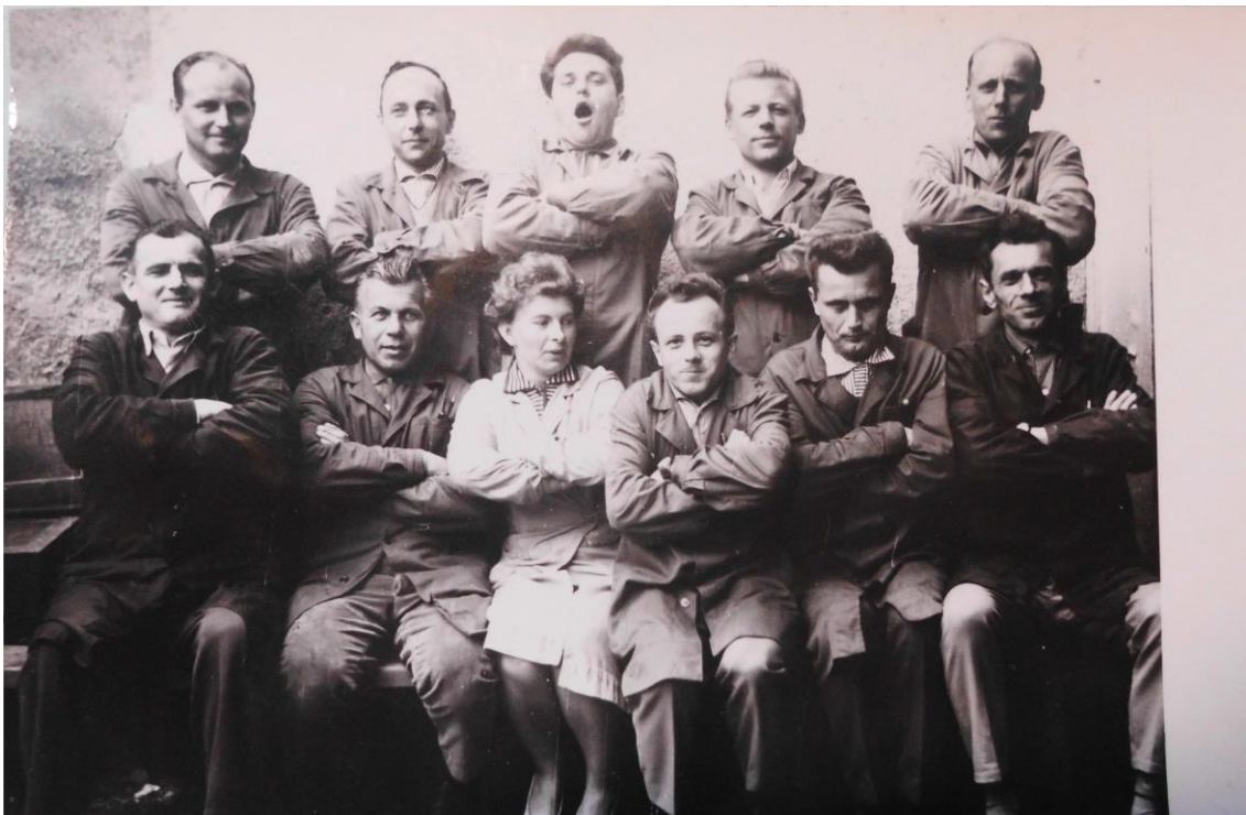
Příloha č. 12: Mistři odborného učiliště 1963.