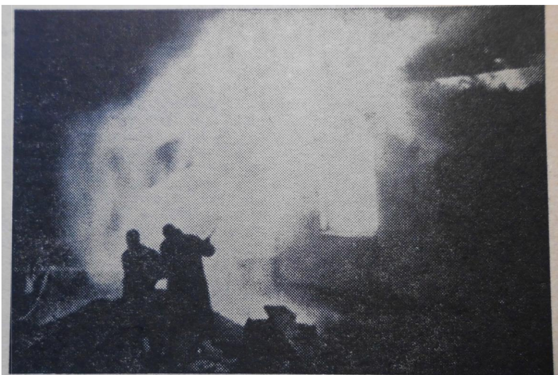
Truhlárna -- místo vzniku požáru — jeden z prvních snímků J. Brzkovského.