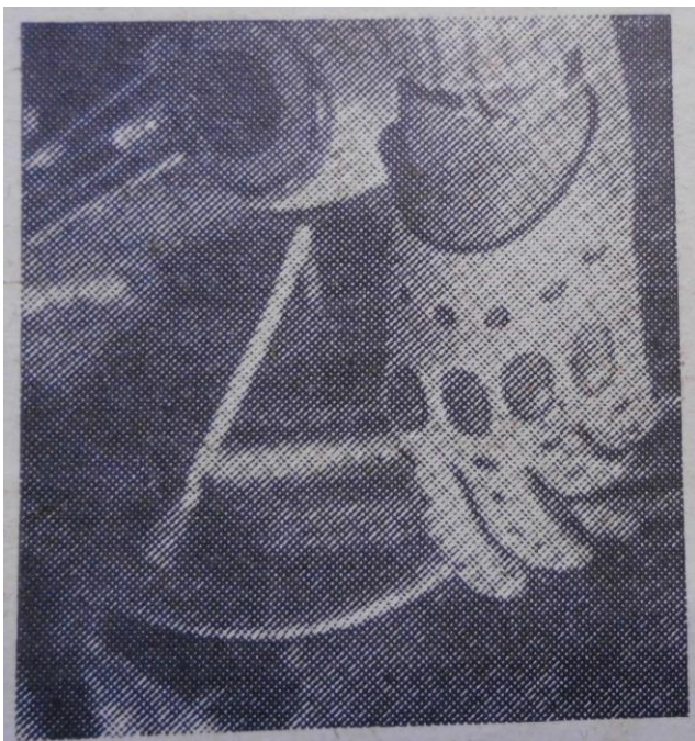
Příloha č. 7: Rukavice pro řidiče.