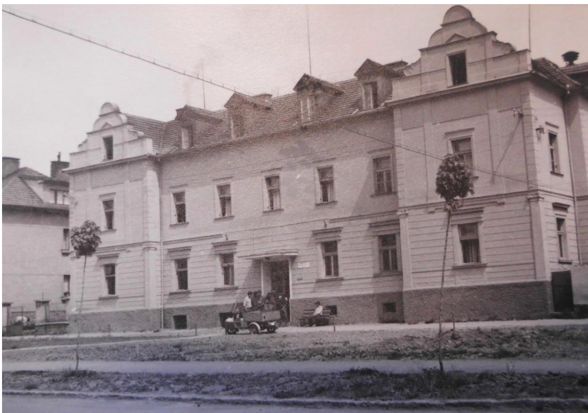
Příloha č. 14: Budova internátu odborného učiliště na Dobříši 1961-1997.