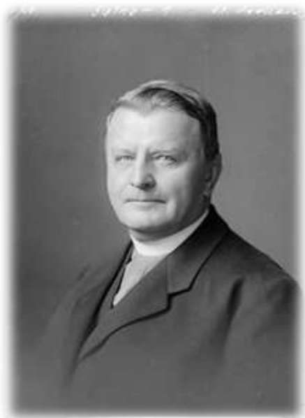
č. 7 - oficiální biskupská fotografie, 1926