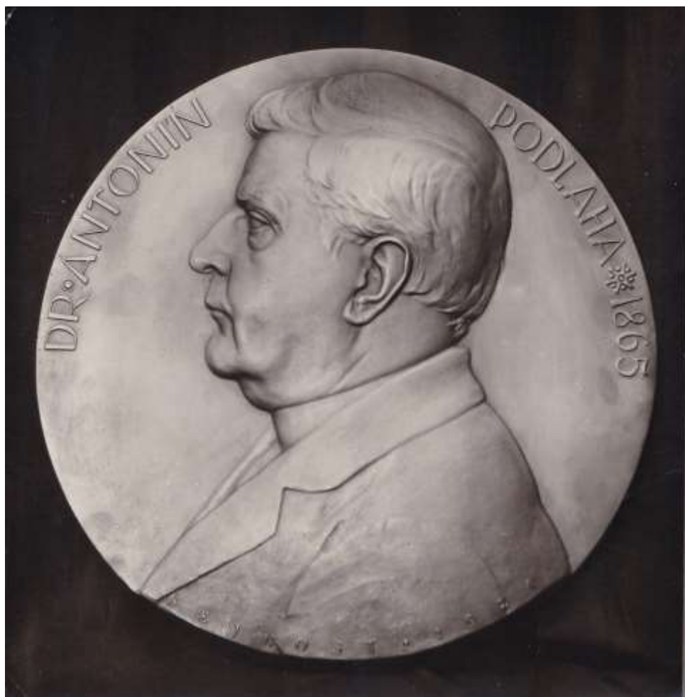
č. 22 – pamětní medaile s vyobrazení Antonína Podlahy, 1924