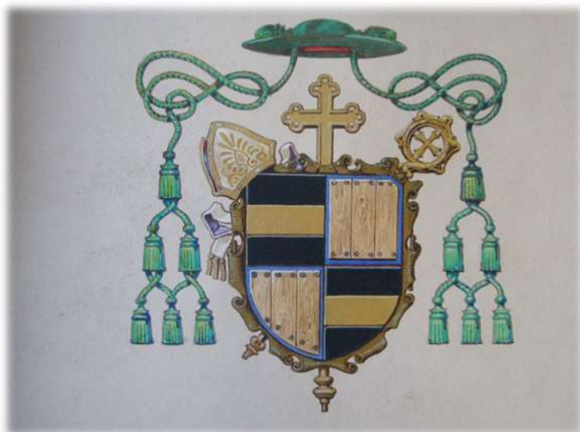
č. 1 – biskupský znak ThDr. Antonína Podlahy, pomocného biskupa pražského