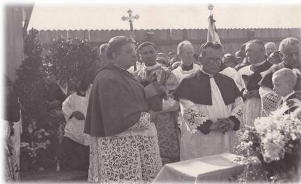
č. 20 – položení základního kamene kostele ve Strašnicích, srpen 1930