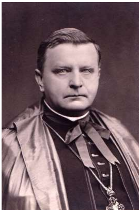
č. 6 – biskup Antonín Podlaha, asi 1926