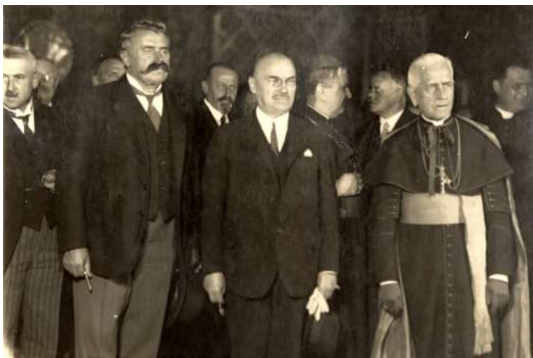
č. 11 – zleva František Udržal, Karel Baxa, František Kordač. Antonín Podlaha stojí bokem za primátorem Baxou, 1929