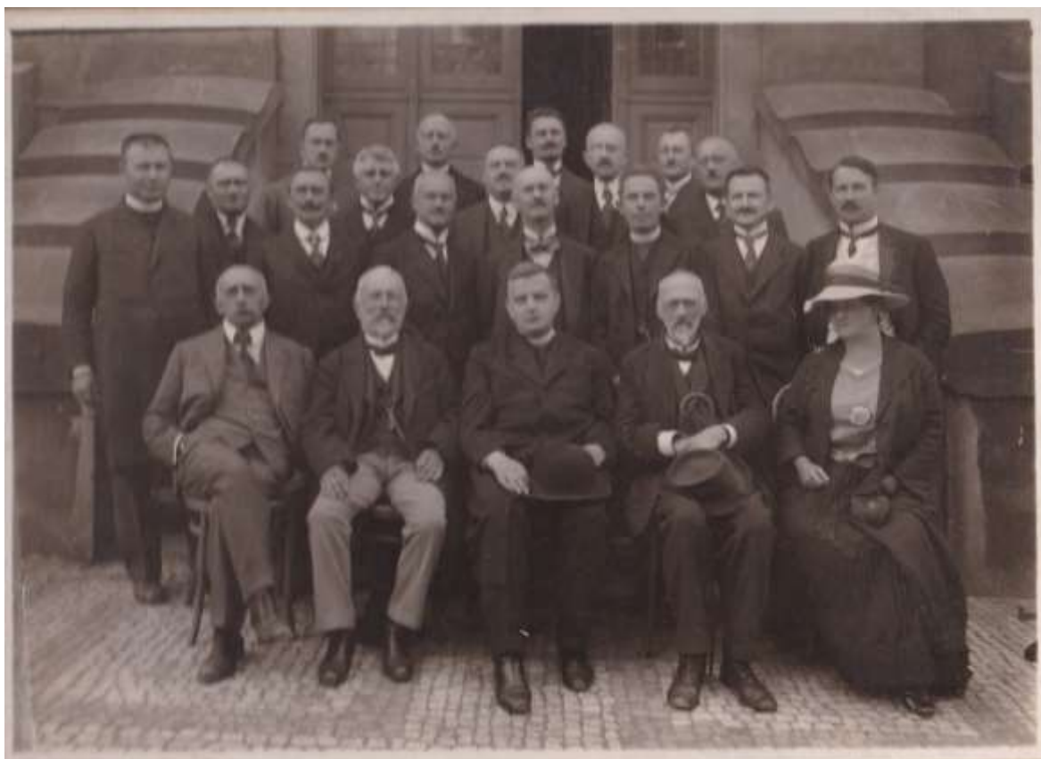
č. 21 – sjezd maturantů v roce 1921