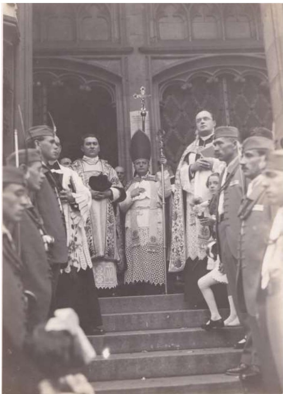
č. 19 – svěcení zvonů kostela sv. Antonína Paduánského, Holešovice, 1926