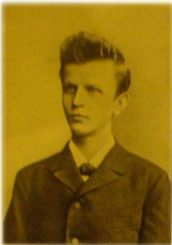
č. 2 – Antonín Podlaha, 1883