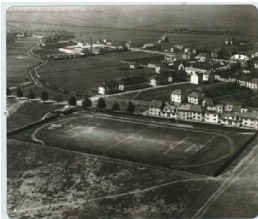
Obrázek 8 Letecký snímek hřiště AC Slovácká Slavia v polovině 20. století

Druhá světová válka na čas přerušila fotbalové dění. Další významný mezník v historii klubu byl rok 1948, kdy se Slovácká Slavia přejmenovala na „Spartak Let Uherské Hradiště“. V následujících letech bojovalo mužstvo v nižších soutěžích. Polovina padesátých let znamenala další reorganizaci klubu, a to spojení dvou týmů Spartaku Let Uherské Hradiště s TJ Mařatice do Spartaku Hradišťan. Ten v roce 1961 postupuje do druhé ligy, kde se dokáže udržet další 4 sezóny. Opět dochází ke změně názvu na „TJ Slovácká Slavia Uherské Hradiště“. Klub se během sedmdesátých let 20. stol. střídavě pohybuje v oblastních soutěžích. Počátkem osmdesátých let se mužstvo dokázalo probjovat až do 8. kola Českého poháru. 13