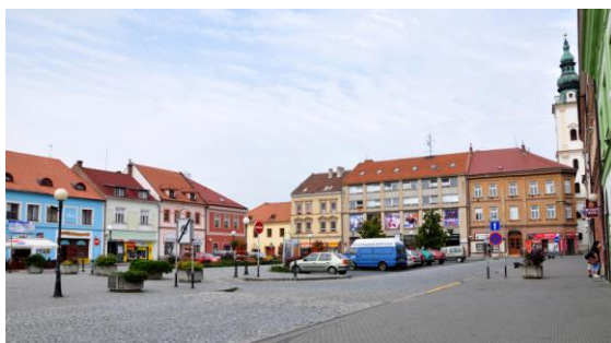
Obrázek 3 Mariánské náměstí Uherské Hradiště

Dnes je to prosperující nejen kulturně, ale také sportovně založené město, které se právem pyšní titulem královského města a v roce 2011 dostalo ocenění Historické město roku. Současný počet obyvatel k 1. 1. 2014 je 25 266. 2