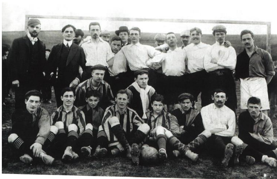
Obrázek 6 Vienna Cricket and Football Club Uherské Hradiště rok 1904