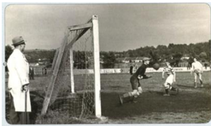
Obrázek 7 Uherskohradišťští fotbalisté z roku 1941 při zápase s Holešovem

V roce 1926, což bylo 4 roky po zařazení Slovácké Slavie do „Hanácké župy“, se jí podařilo tuto soutěž vyhrát a postoupit do 1. třídy. Z tohoto roku se též dochovaly první zmínky o fotbalovém stadionu, které jsou spojeny s postavením klubovny fotbalového týmu. Při příležitosti 40. výročí oslavy fotbalu byl pozván tehdejší mistr první ligy klub Slavia Praha. Pražský tým zvítězil vysokým rozdílem skóre 0:8. Nutno však podotknout, že za výběr hostů nastoupilo sedm reprezentantů v čele s legendárním brankářem Pláničkou, kteří obsadili druhé místo na mistrovství světa v Itálii. Toto utkání se těšilo velkému počtu diváků, jejichž počet se vyšplhal nad 7000.