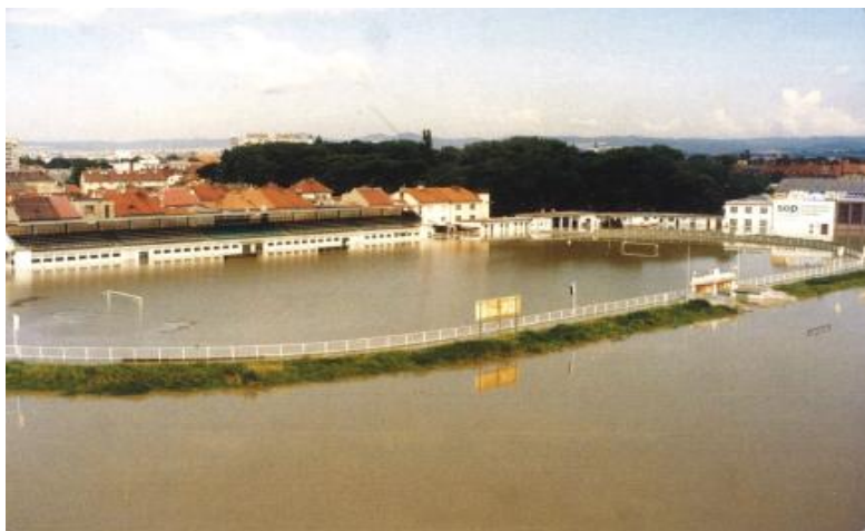
Obrázek 9 Fotbalový stadion Uherské Hradiště povodně v roce 1997

akciové společnosti „FC T. I. C. Slovácká Slavia Uherské Hradiště“. V roce 1995 dochází opět ke změně názvu na „FC JOKO Slovácká Slavia Uherské Hradiště“. Ani tato společnost však nedokázala zabránit sestupu Uherského Hradiště z první ligy do divize. Dochází k další změně názvu klubu. Rok 1997 se zapsal do historie velkou povodní, která zdevastovala celé město Uherské Hradiště včetně fotbalového hřiště. 14