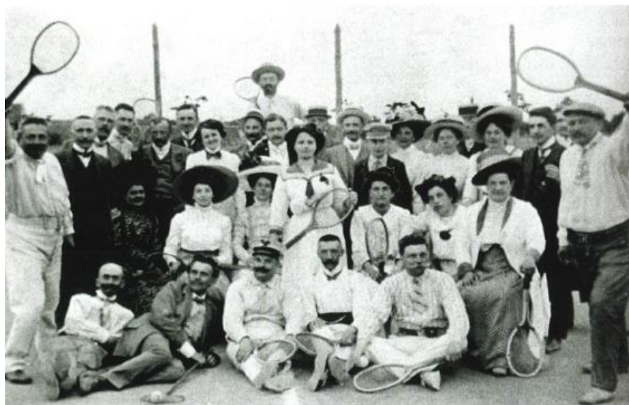
Vyznavači bílého sportu při meziměstském trojutkání Veselí nad Moravou–Uh. Hradiště–Uh. Ostroh v r. 1910.