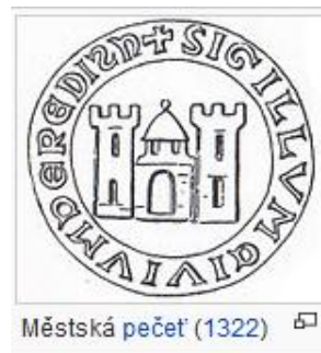
Obrázek 2 Pečeť města Uherské Hradiště

V roce 1842 byla vybudována tzv. Severní dráha císaře Ferdinanda z Vídně do Přerova a Olomouce, jejíž trasa vedla přes Staré Město. V roce 1848 bylo ve městě zřízeno okresní hejtmánství, k němuž náležely nové soudní okresy. V roce 1886 se do Uherského Hradiště z města Zlín přistěhoval švec Antonín Baťa starší a založil si v místní části Rybárny obuvnickou živnost. V sousedství Rybáren dnes začíná třetí úsek Baťova kanálu, vodní cesty vybudované v letech 1935–1938.