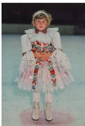
Obrázek 20 Slavnostní zahájení krasobruslařské soutěže O slovácký džbánek