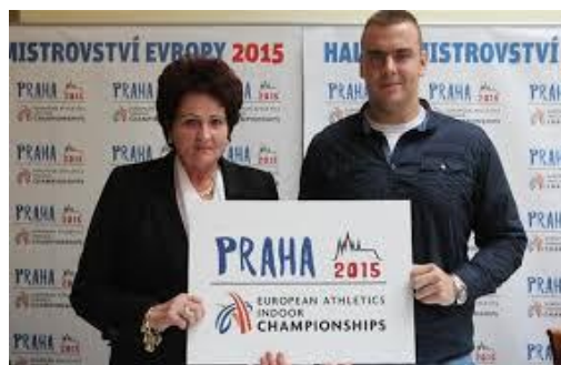
Obrázek 22 H. Fibingerová podpora halového mistrovství Evropy v atletice