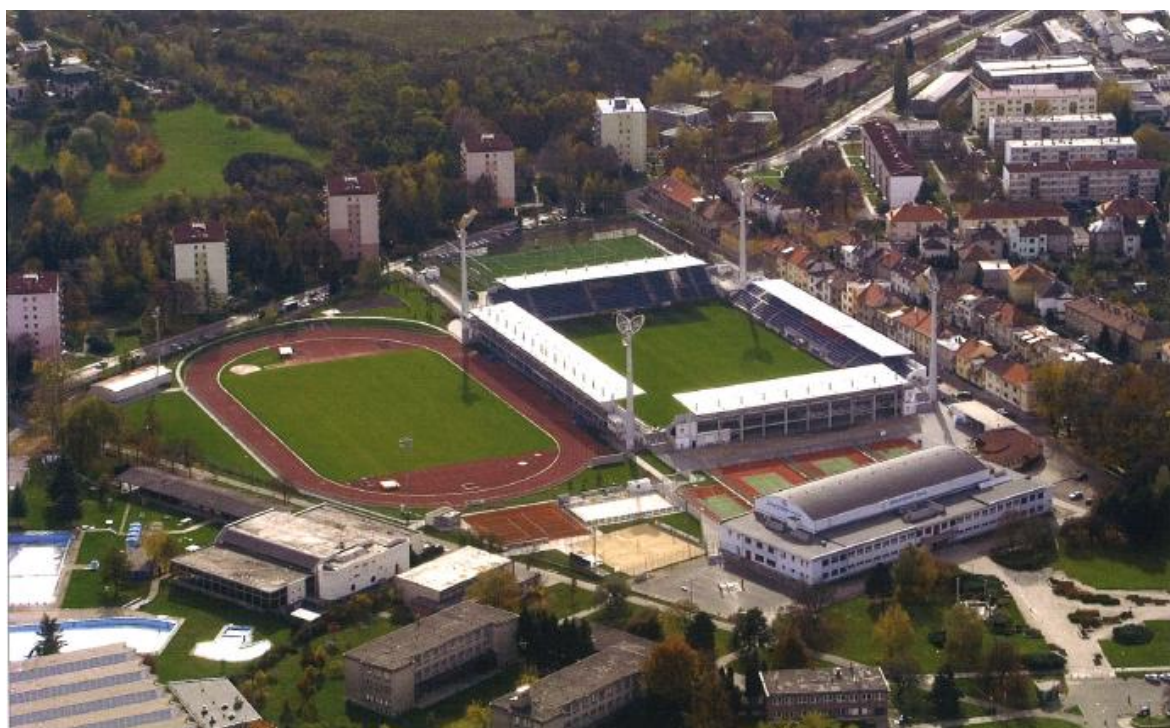
Obrázek 31 Městský sportovní areál v Uherském Hradišti 2006

Stadion v Uherském Hradišti byl též vybrán jako jeden z pořadatelských stadionů pro Mistrovství Evropy v kategorii hráčů do 21 let, který se bude konat v roce 2015.