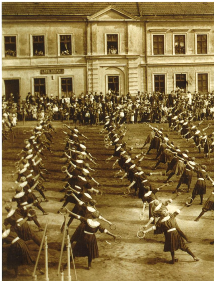
Ženy cvičící s kruhy na hřišti u sokolovny, kolem r. 1918.