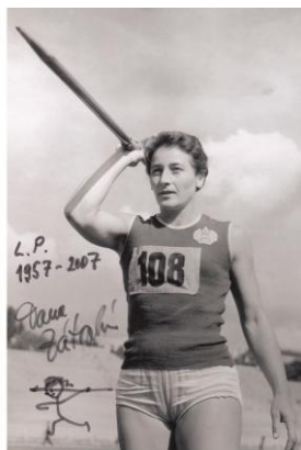
Obrázek 28 oštěpačka D. Zátopková