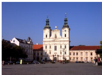
Obrázek 4 Masarykovo náměstí Uherské Hradiště