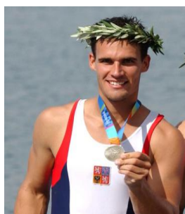
Obrázek 23 J. Hanák olympionik z Athén 2004