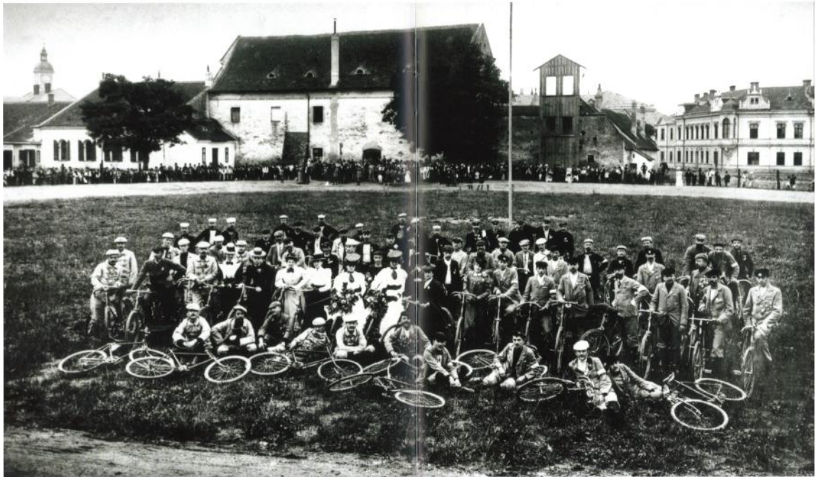
Obrázek 18 Účastníci cyklistické slavnosti 1897 v Uherském Hradišti

Největším počtem členů se mohl oddíl pyšnit v 1972, kdy měl 23 členů. O tři roky později to bylo už o čtyři členy méně. V roce 1975 se počet členů opět zmenšil, a to na číslo 15. Roku 1982 se oddíl skládá ze 14 členů, 5 z nich byly děti. Na základě iniciativy Městského informačního centra se od roku 2006 pravidelně pořádá cyklistická aktivita zvaná „Na kole vinohrady Uherskohradištska“, která propojuje sport s regionálním vinařstvím. Tato stezka se každoročně těší velké oblibě nejen místních cyklistů, ale také cyklistů z nedalekého Slovenska. 70