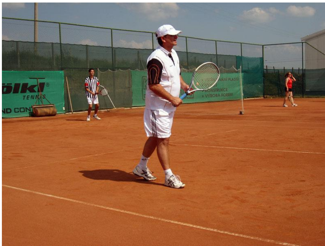
Obrázek 11 Hradištské tenisové kurty 2010