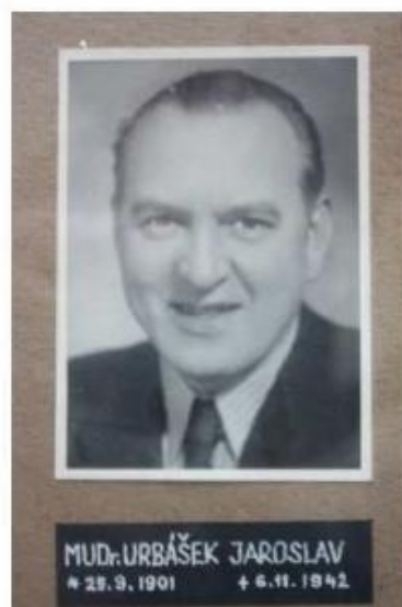
Obrázek 15 Memoriál MUDr. Urbáška rok 2008