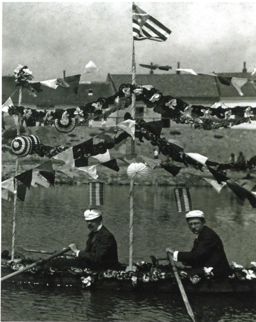
Rozjíždka členů Českého veslařského klubu, 1908.