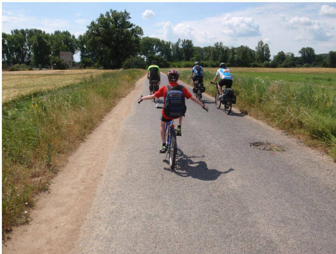
Obrázek 19 Cyklostezka z Uherského Hradiště do Ostrožské Nové Vsi 2013

cyklotras a každoročně je pořádáno slavnostní zahájení sezóny včetně jízdy po cyklostezkách. Dále pak je pravidelnou akcí zamykání cyklostezek a akce „Evropského týdne mobility“. Město se věnuje také podporování cyklistiky u dětí, a to pořádáním akce „Den bez úrazu“, která se každoročně koná na konci školního roku. 71