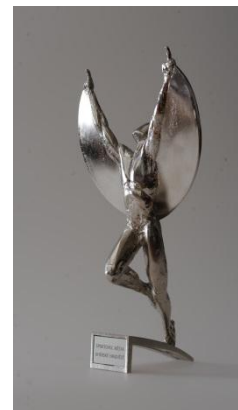
Obrázek 30 cena pro D. Zátopkovou za celoživotní přínos sportu od města Uherské Hradiště 2014

Dana Zátopková se narodila na severní Moravě a poté se přestěhovala s rodiči na jižní Moravu. Poprvé se seznámila s atletikou jako studentka gymnázia v Uherském Hradišti. Nejdříve se tato sportovkyně věnovala házené, a to v období během druhé světové války a po ní. Roku „1949“ jako členka Slovácké Slavie dosáhla titulu mistryně republiky v házené. Od roku „1946“ se souběžně s házenou věnovala také atletice a náhodou se dostala i k hodu oštěpem. O dva roky později se stala reprezentantkou na olympiádě v Anglii, kde získala krásné sedmé místo.