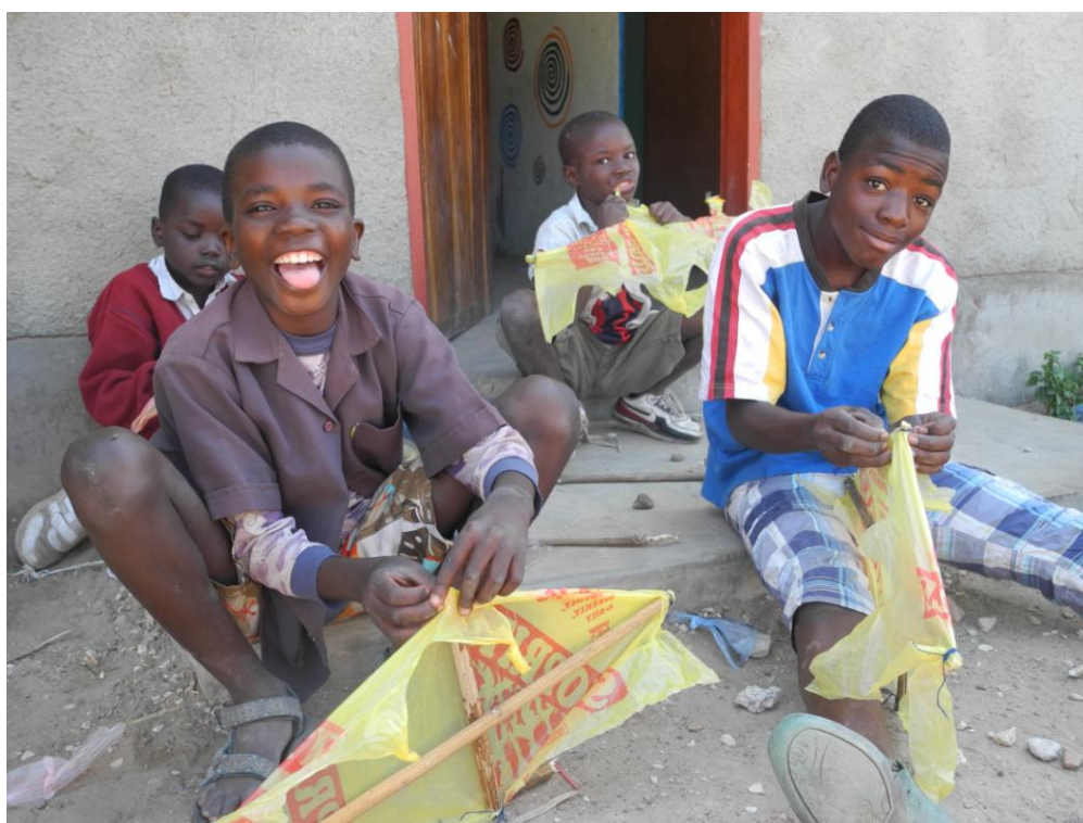
Obrázek 14 Výroba draků na drakiádu