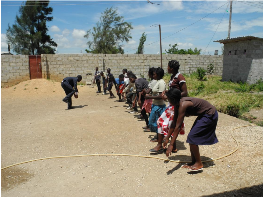
Obrázek 7 Hodina tělesné výchovy