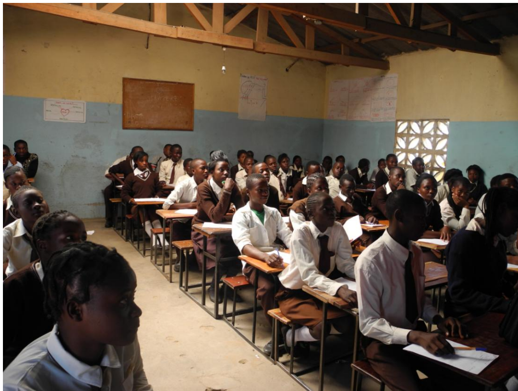
Obrázek 1 Výuka ve státní škole

fotografie k ilustraci