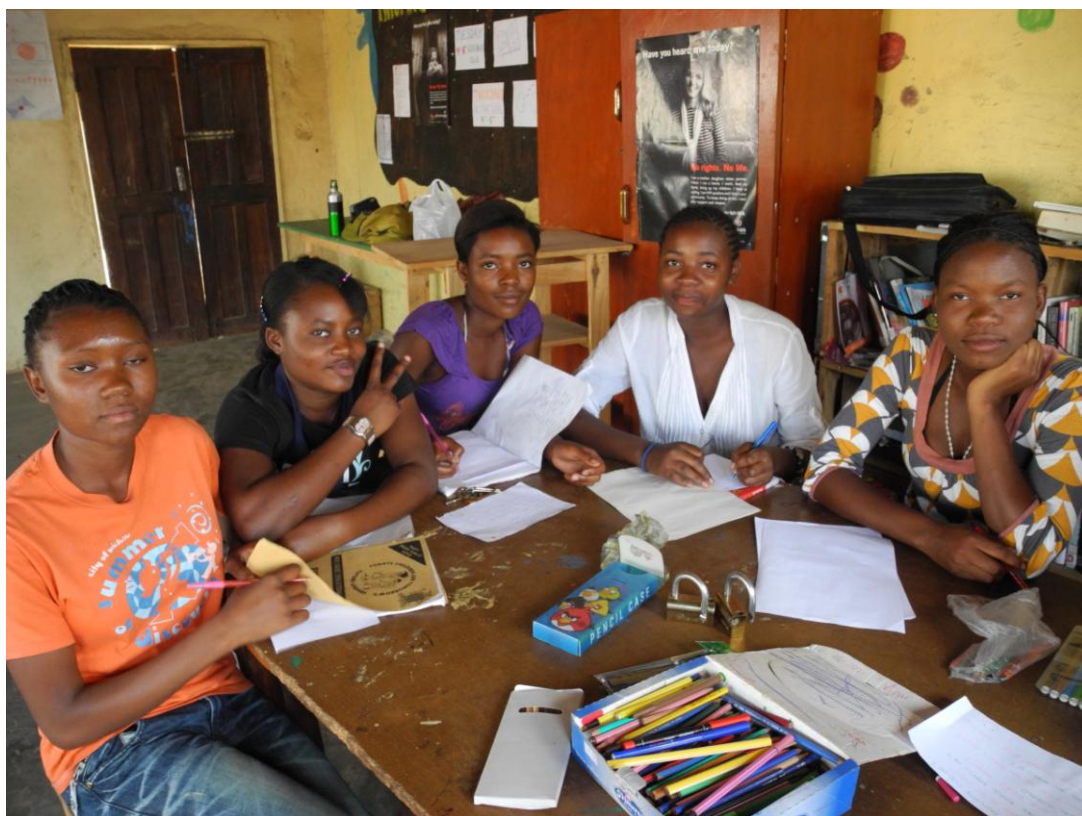
Obrázek 10 Dívčí klub Be a girl! ve N'gombe