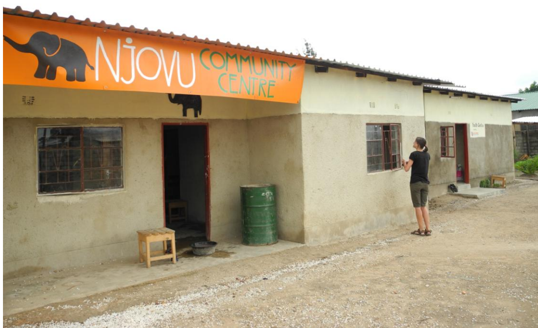
Obrázek 4 Centrum Njovu v Chibolyi