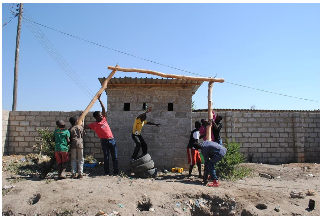
Obrázek 6 Stavba hřiště v Chibolyi z peněz sponzorů