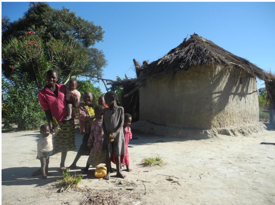
Obrázek 2 Život na vesnici