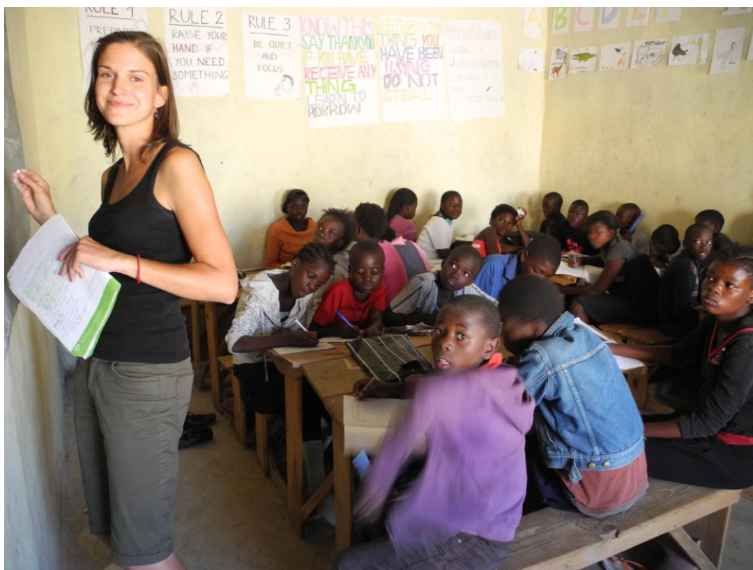
Obrázek 11 Výuka anglického jazyka