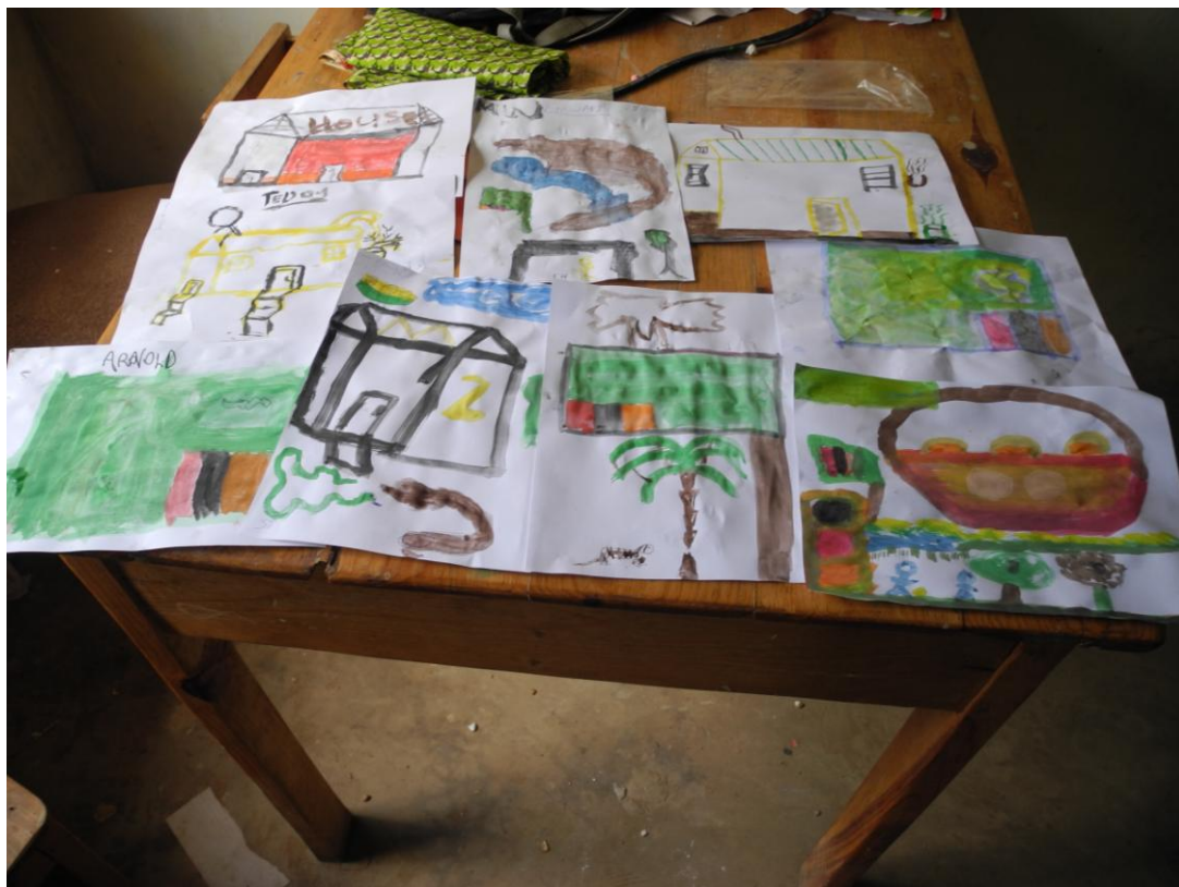
Obrázek 15 Hodina výtvarné výchovy