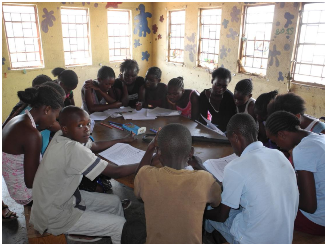
Obrázek 9 Klub čtení ve N'gombe