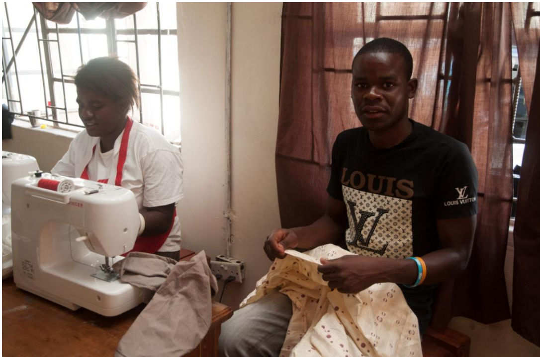
Obrázek 8 Výuka odborných oborů v Mongu – krejčovství