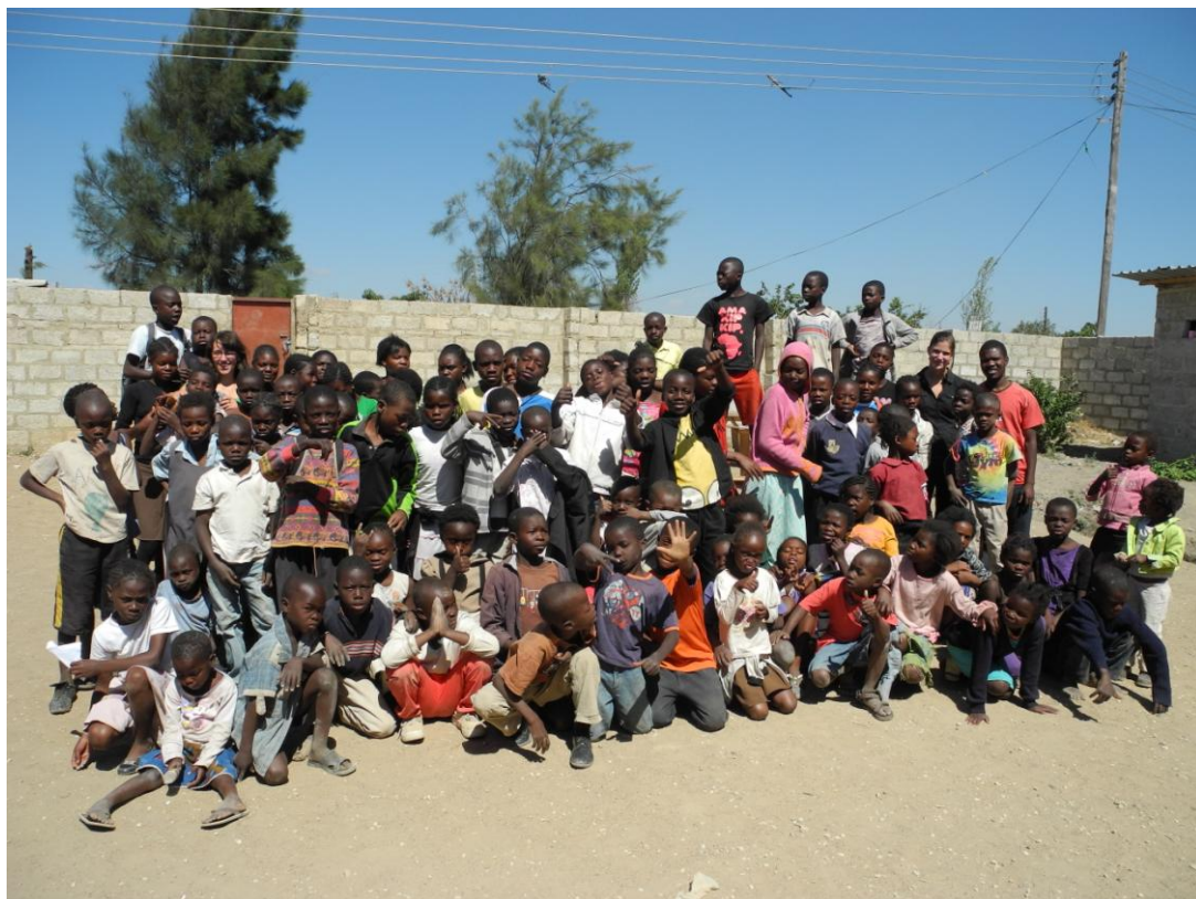
Obrázek 5 Všechny děti navštěvující centrum v Chibolyi