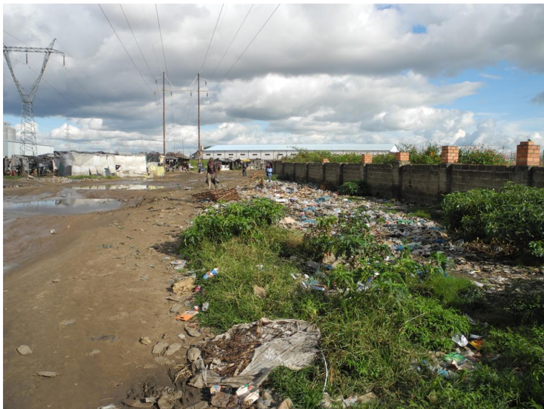
Obrázek 3 Čtvrť Chibolya