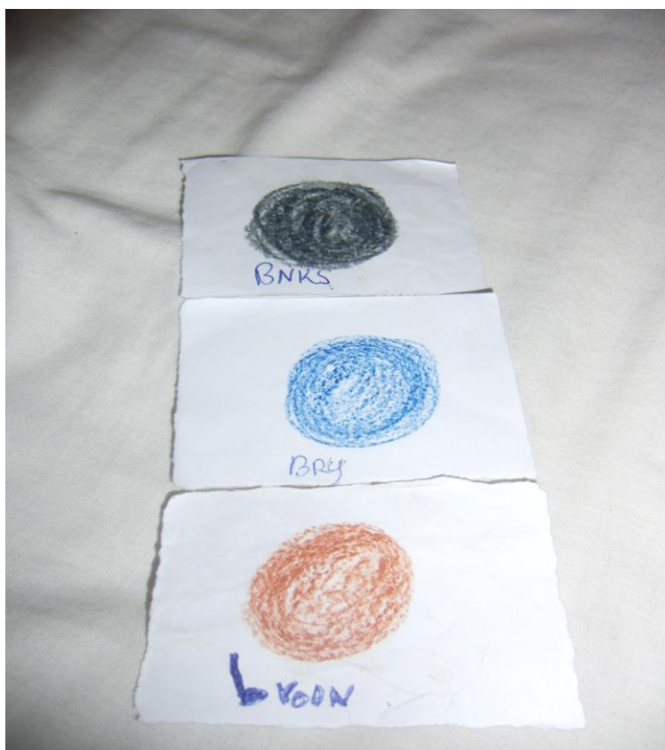
Obrázek 12 Psaní barev