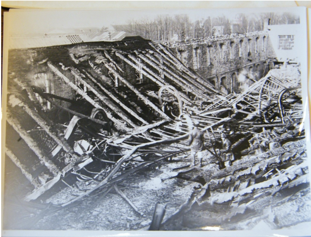
Příloha č. 1) Jeden z objektů továrny Melichar-Umrath po požáru z 31. dubna 1939. Brandýs nad Labem. 375