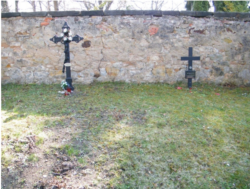
Příloha č. 11) Pamětní kříže na šachtovém hrobě určeném pro zemřelé Němce. Hřbitov Brandýs nad Labem. 385