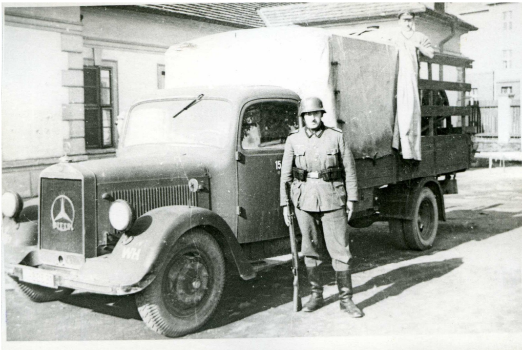
Příloha č. 2) Němečtí vojáci na dvoře kasáren naproti budově okresního soudu v Brandýse nad Labem. Nedatováno. 376