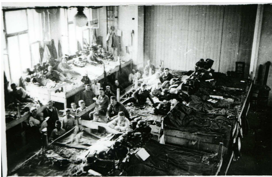
Příloha č. 5) Němečtí vojáci přechodně ubytovaní v prostorách brandýské sokolovny. Nedatováno. 379