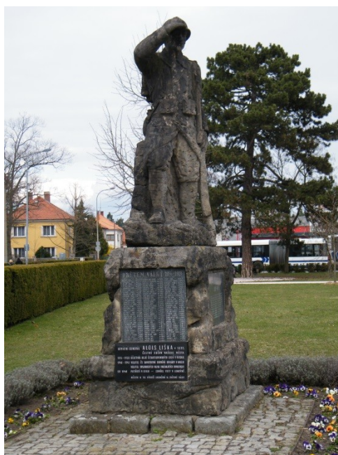
Příloha č. 10) Socha francouzského legionáře od sochaře Emanuela Zentnera z roku 1923. Na podstavci jsou umístěny desky se jmény obětí 1. a 2. světové války. 384