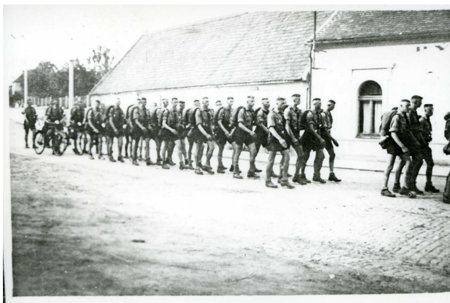
Příloha č. 4) Oddíl Hitlerjugend v Brandýse nad Labem. Nedatováno. 378