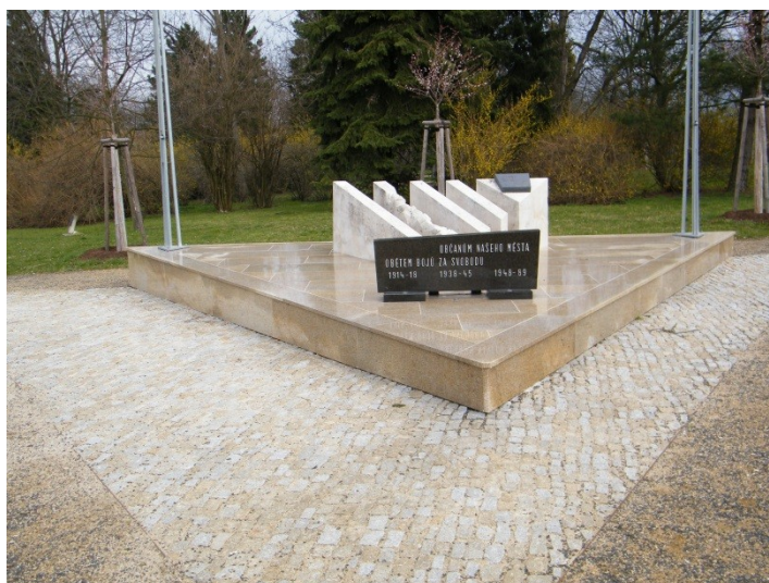
Příloha č. 8) Současný stav centrálního pomníku obětem války v Brandýse nad Labem. 382