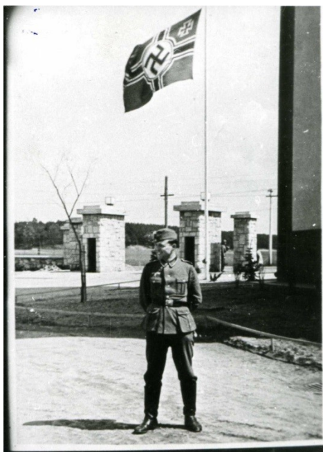
Příloha č. 3) Památeční fotografie německého vojáka na dvoře staroboleslavských kasáren. Nedatováno. 377