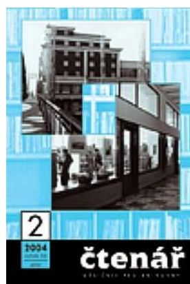
Obr. 4: Obálka Čtenáře z r. 2004

V roce 2008 doznala jen menších změn grafická úprava údajů o čísle, roce, ročníku a ceně na obálce časopisu, vedle kterých se tento rok také poprvé objevil čárový kód. V roce 2009 zmizel z obálky černý podklad, na kterém byly uváděny údaje o názvu a číslování časopisu a tematický obrázek pokrývá celou stranu (viz Obr. 5). Pro rok 2008 byly na titulní stranu vybrány různé grafiky s metaforickým významem na téma knihovna v 21. století, grafika v čísle 7-8 je věnována 60. výročí časopisu. V roce 2009 se na obálce objevovaly nové moderní budovy knihoven z celého světa, včetně architektonického návrhu nové budovy Národní knihovny od Jana Kaplického.