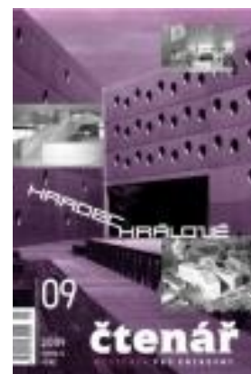
Obr. 5: Obálka Čtenáře z r. 2009