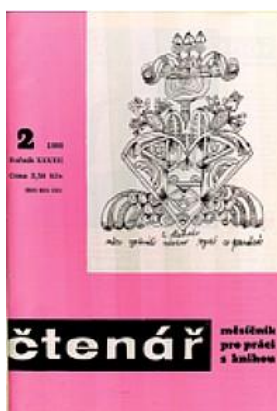
Obr. 1: Obálka Čtenáře z r. 1989