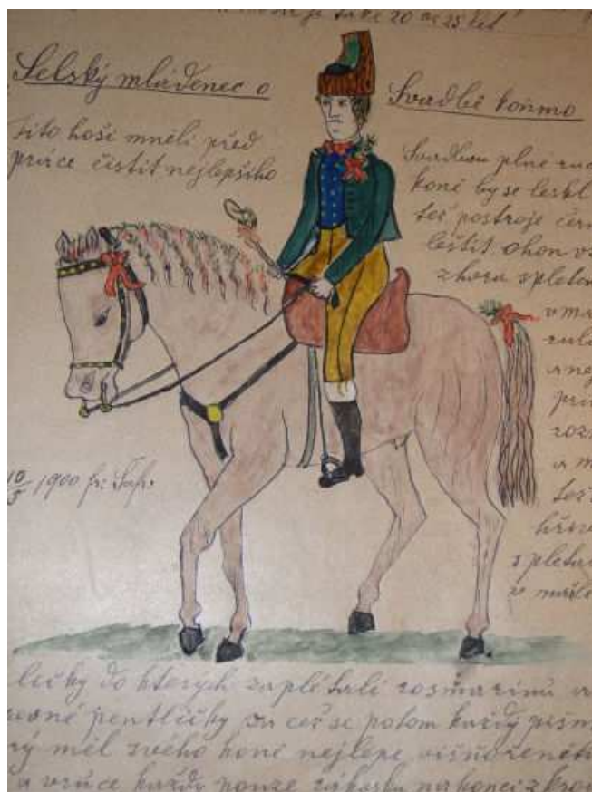
Obr. 9: Selský mládenec (Šafránek 1894 – 1900, 480).