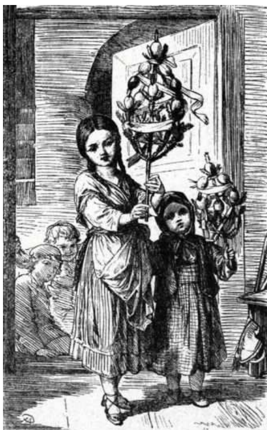
Obr. 4: Petr Maixner. Obchůzka s létem (Zíbrt 1910, 51).