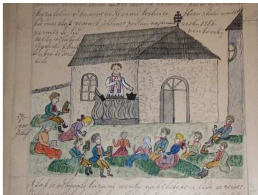
Obr. 6: Kázání o pouti na Gothardě (Šafránek 1894 – 1900, 487).