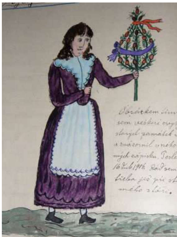
Obr. 3: Obchůzka s létem (Šafránek 1904 – 1907, 235).