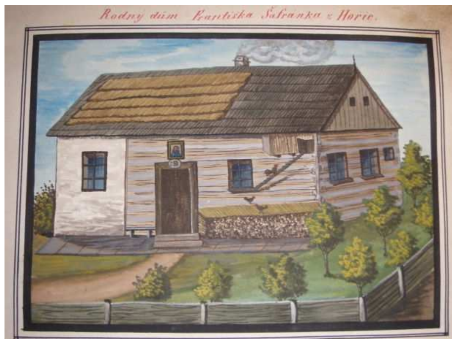
Obr. 2: Rodný dům Františka Šafránka (Šafránek 1867 – 1895).