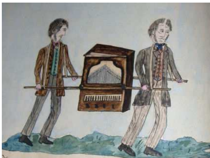
Obr. 12: Přenosné varhany užívané při venkovní bohoslužbě (Šafránek 1904 – 1907, 165).