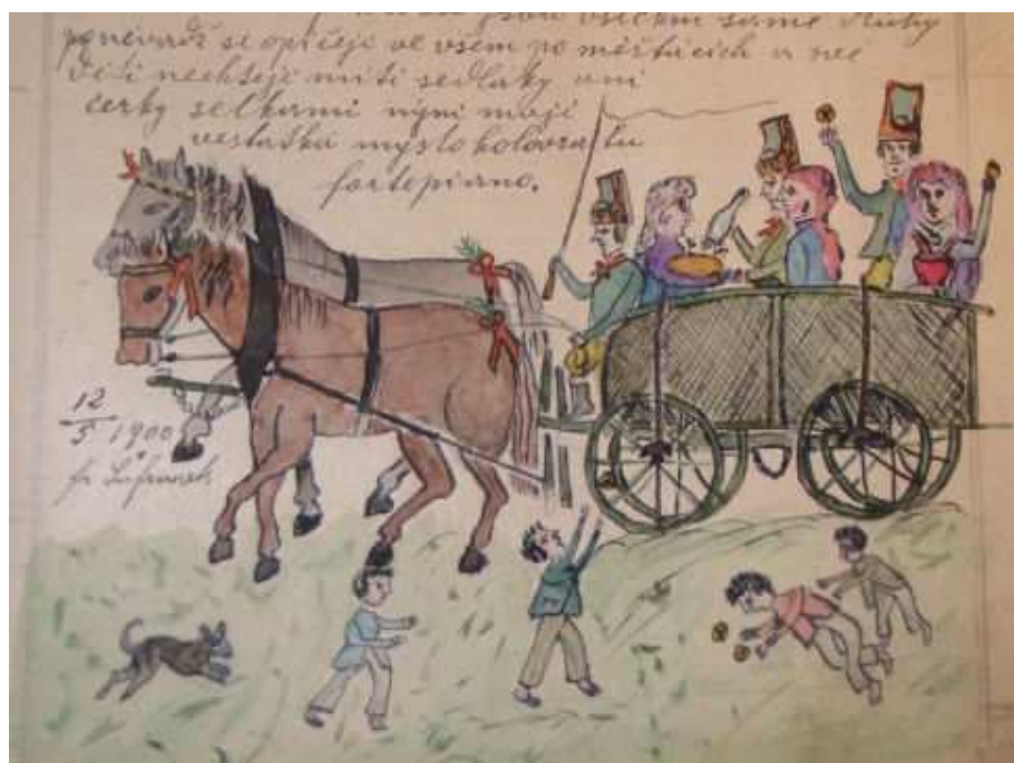
Obr. 10: Vůz se svatebčany (Šafránek 1894 – 1900, 482).