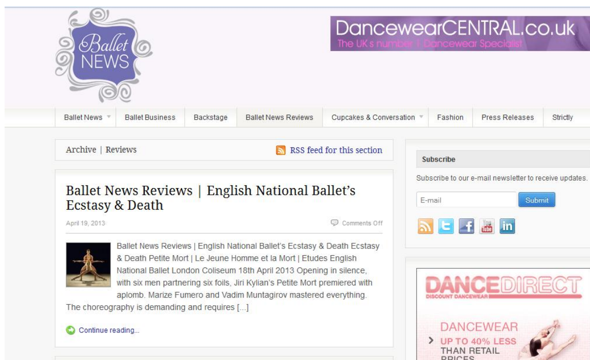
obr.č.14 ukázka web. stránek Ballet News 42

Dle slov autora se stala velmi populární mezi čtenáři Ballet News rubrika Cupcakes and Conversations , kde probíhají rozhovory s nadanými studenty předních baletních škol nebo s již čerstvými absolventy a nadějnými tanečníky některého z předních souborů.