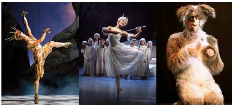
obr. č. 10- ukázka inf. zpravodaje 37

Šipková Růženka, Francesco Scarpato, foto: A. Rasmussen Louskáček – Vánoční příběh, Nikola Márová a dle z Baletní přípravy ND, foto: O. Zehemer Zlatovláska, Viktor Komvalinka, foto: O. Zehemer