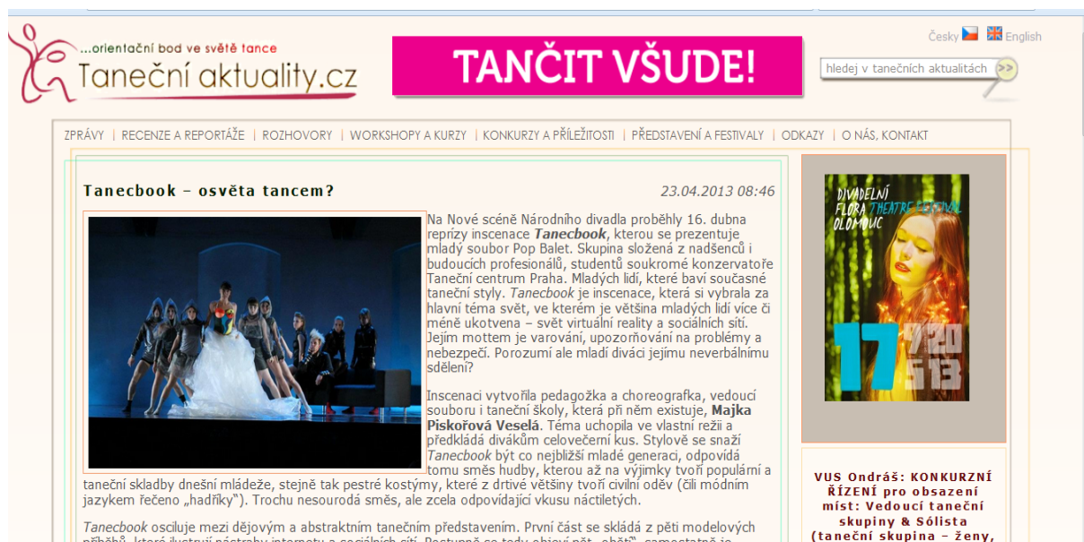
obr. č.2 - struktura el. časopisu 24

Strukturu portálu zachycuje obr. č. X. Je rozdělen do několika sekcí. Taneční profesionál najde v časopisu důležité informace o konkurzech v divadlech a další příležitosti, kde se mohou tanečníci uplatnit (viz sekce Konkurzy..... ). Součástí tanečního umění je potřeba se neustále vzdělávat, sekce Workshopy a kurzy nabízí široké možnosti nabídek tanečních seminářů. V neposlední řadě je důležitým vývojem v životě umělce porovnání vlastních schopností se schopnostmi ostatních tanečníků, proto lze zde najít informace o různých představeních a tanečních festivalech a to nejen v Čechách, ale i v zahraničí.