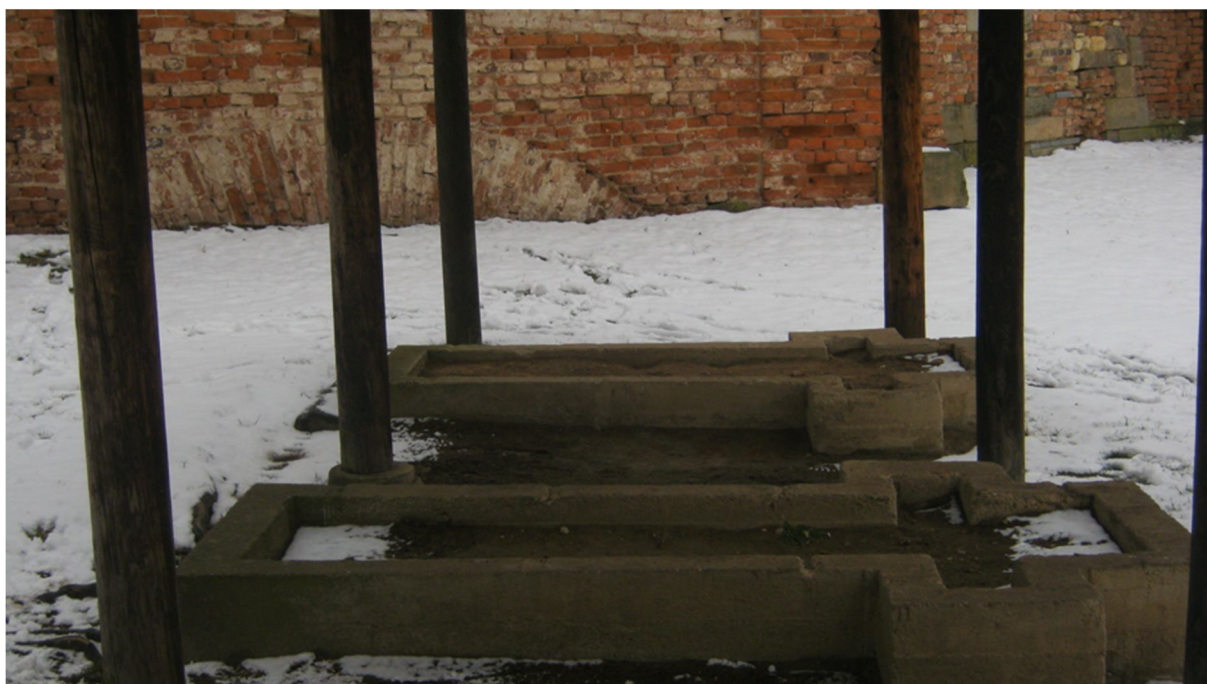
Příloha č. 8, místo, kde byli vězni popravováni zastřelením v Malé pevnosti, Terezín