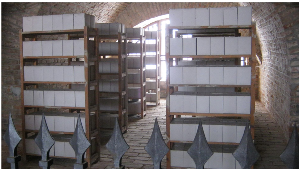
Příloha č. 21, židovský hřbitov s 9000 zemřelými vězni z ghetta Terezín