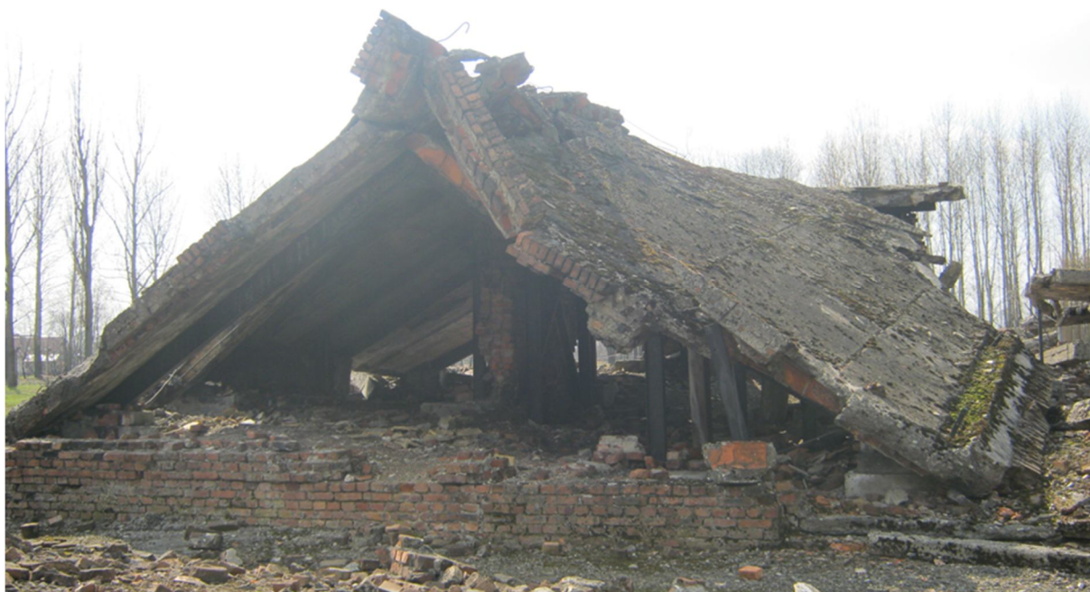
Příloha č. 28, trosky jednoho z krematorií, Osvětim – Březinka