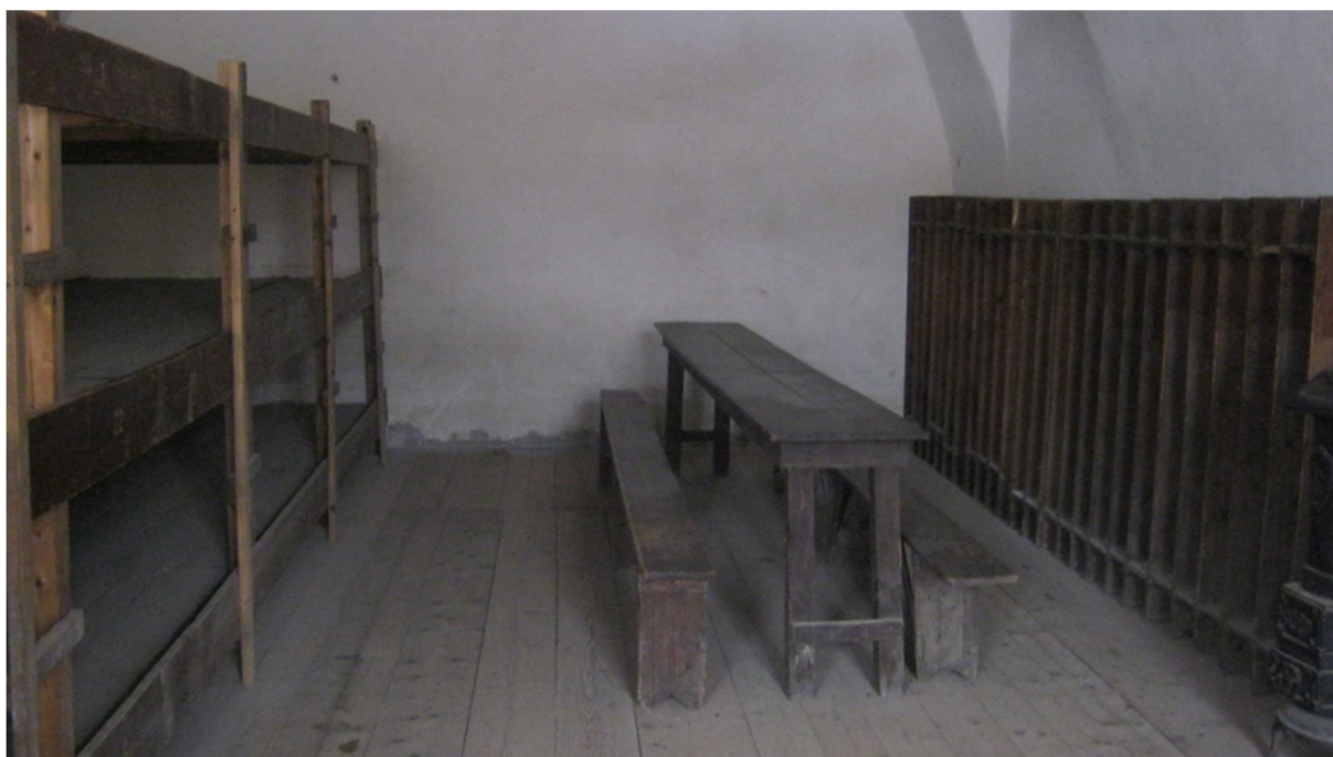
Příloha č. 17, stůl v jedné z cel vězňů, Malá pevnost, Terezín