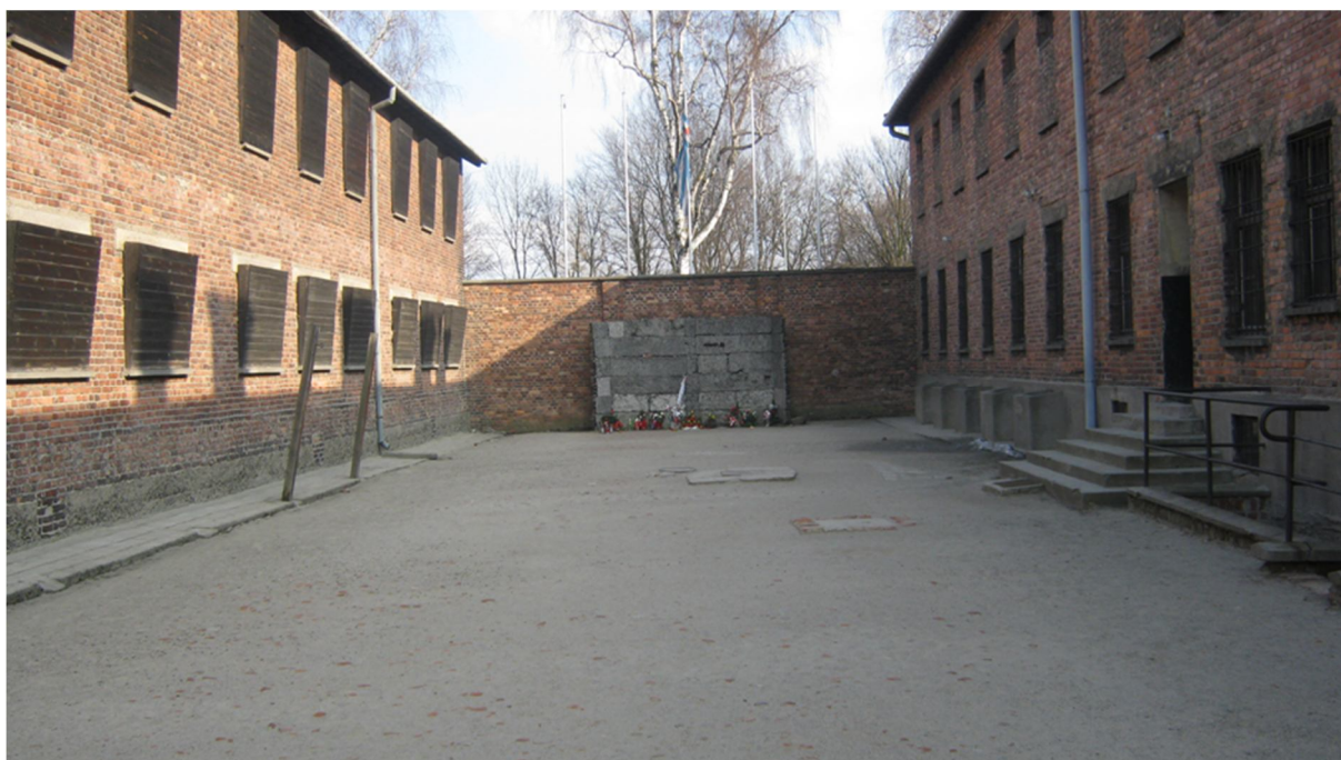
Příloha č. 40, pohled „zevnitř ven“, Osvětim I.