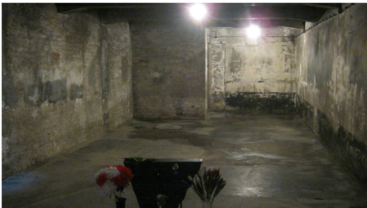
Příloha č. 38, spalovací pece, krematorium, Osvětím I.