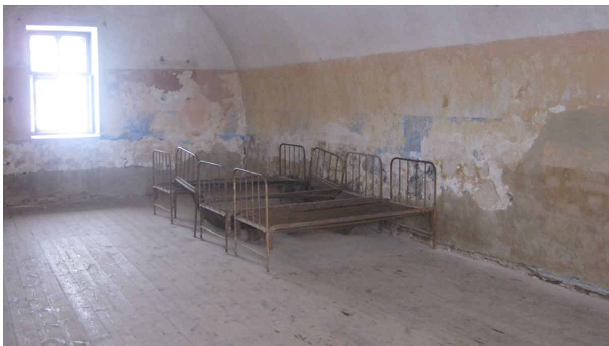
Příloha č. 13, umývárny, Malá pevnost, Terezín