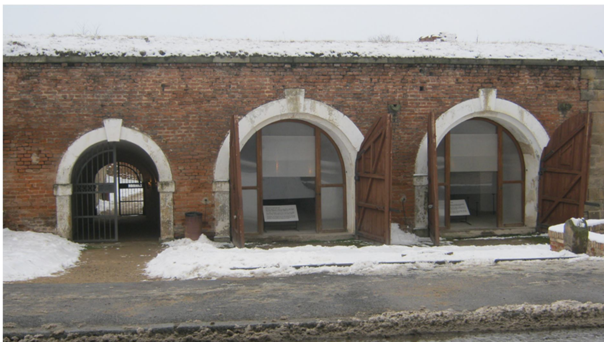
Příloha č. 19, obřadní síň, ghetto Terezín