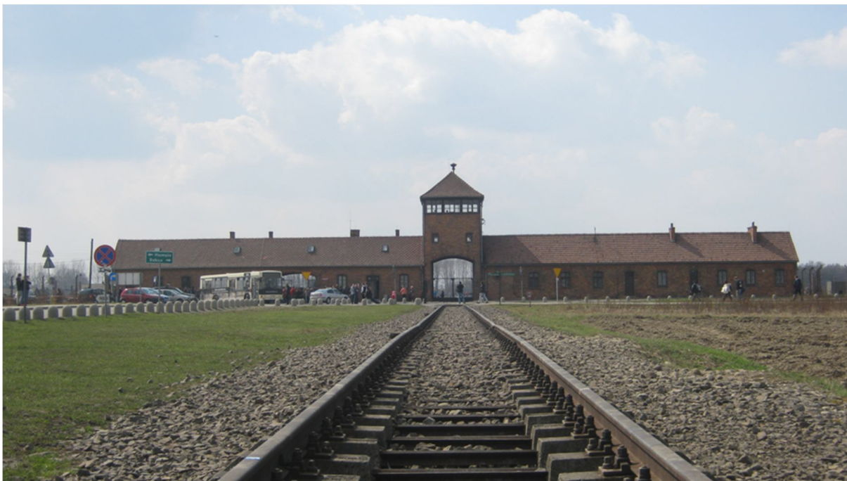
Příloha č. 24, ostnaté dráty a strážní věž, Osvětim-Březinka