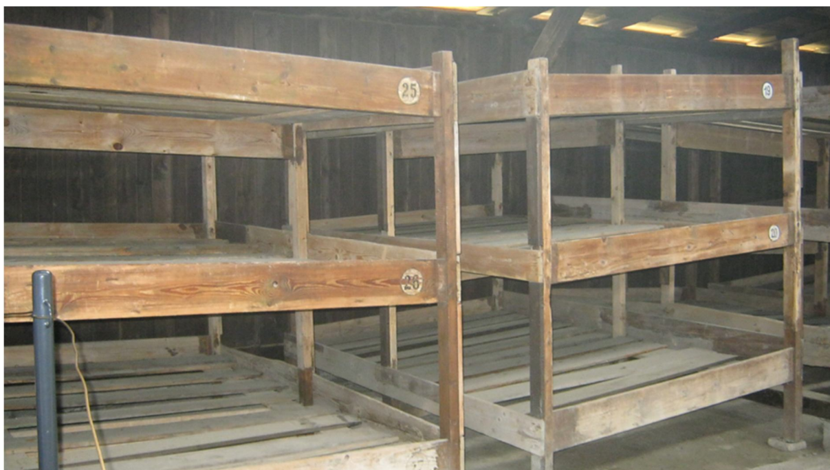
Příloha č. 33, památník obětem holocaustu, Osvětim-Březinka