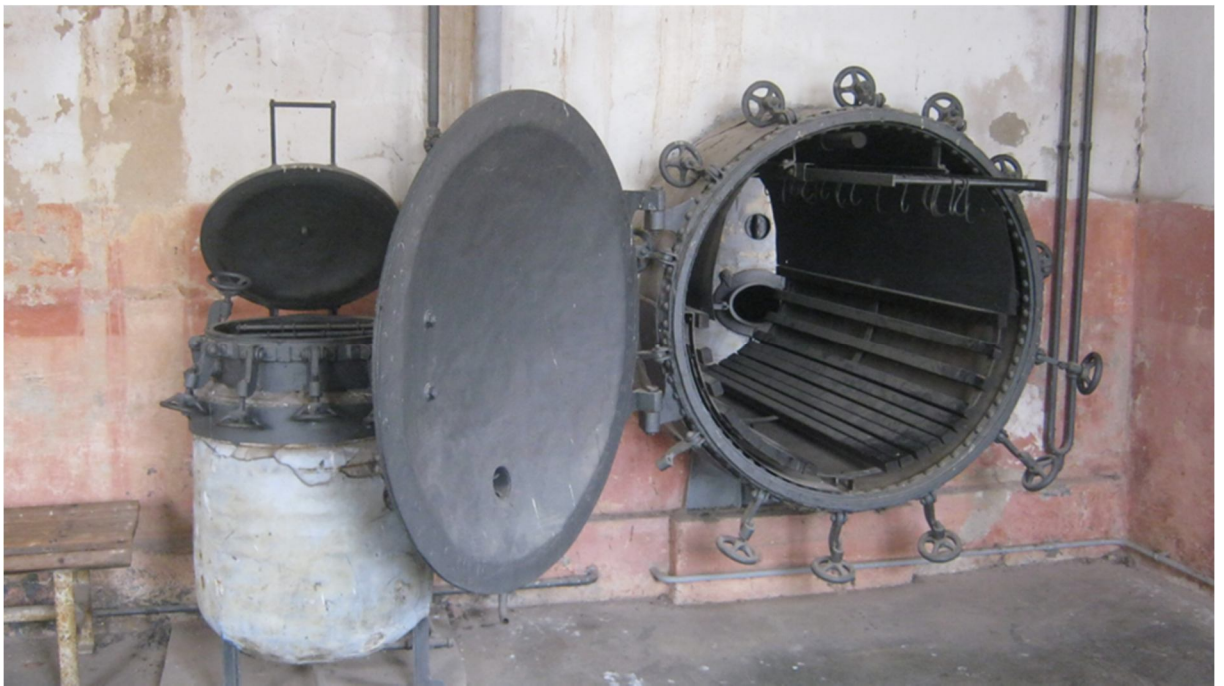
Příloha č. 15, appelplatz, Malá pevnost, Terezín