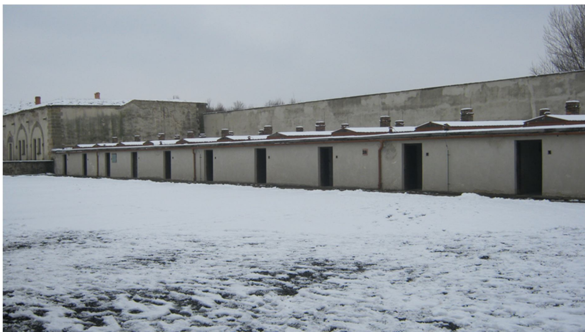
Příloha č. 6, část Malé pevnosti, Terezín