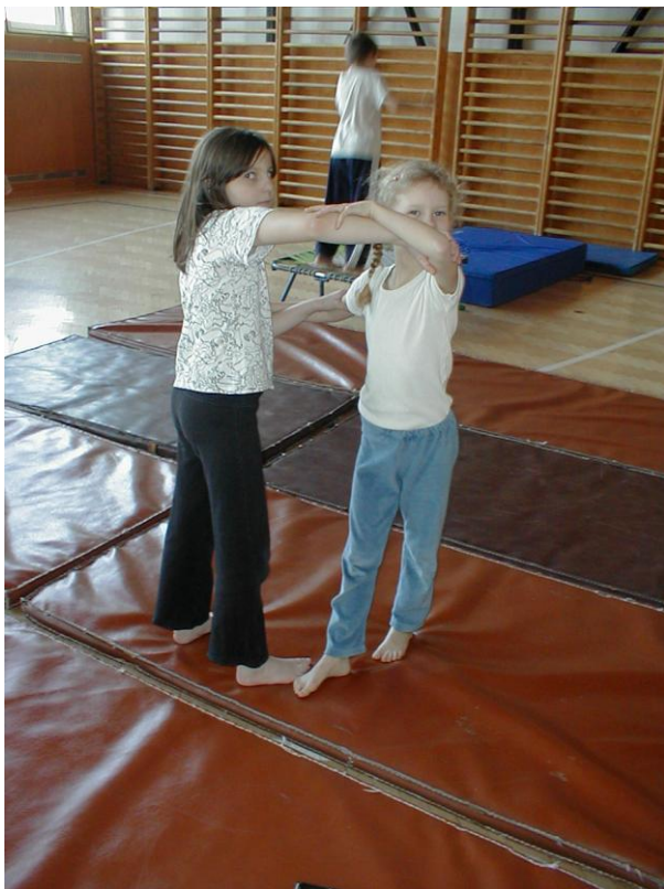
Vychýlení do chvatu (provádí dívka v modrém) bez vychýlení není možné žádný chvat provést správně. Toto je vychýlení bud pokračovat chvatem O- goshi.