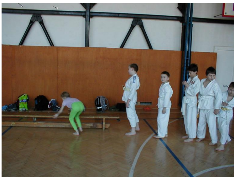
Začátek překážkové dráhy.