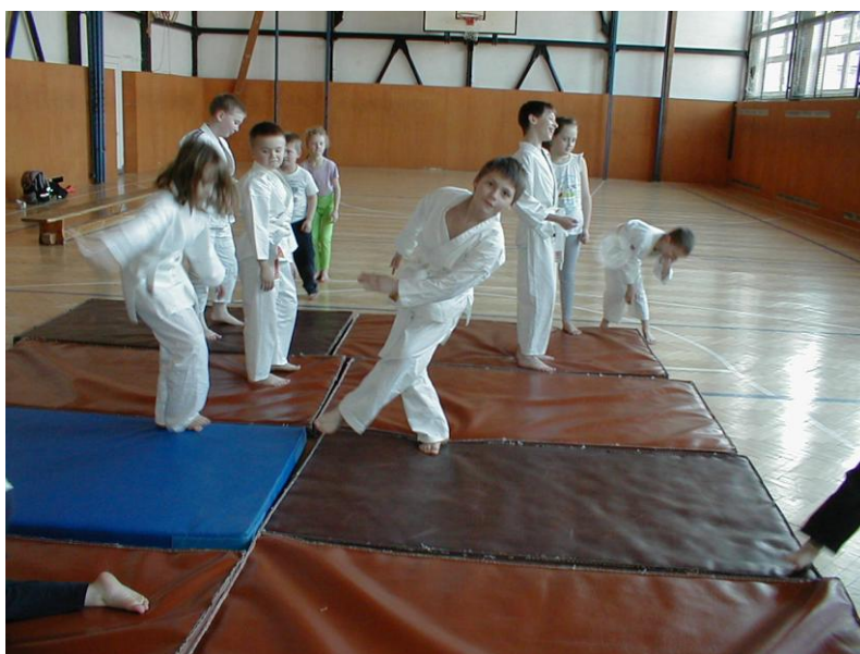
Chlapec napravo provádí pád stranou již ze stoje.