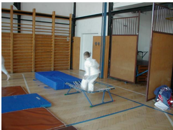
Skákání do duchny.