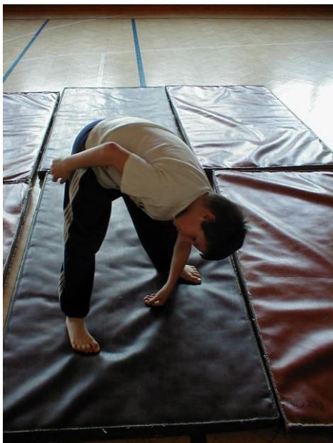
Počáteční fáze pádu v před, již s předsunutou nohou, v předu je stejná noha i ruka.( způsob učení v USK Praha a kidsport)