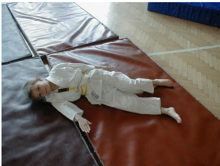
Konečná správná fáze pádu v před a stranou, jištěná hlava, ruka vzdálená od nohy tak 45 stupňů.