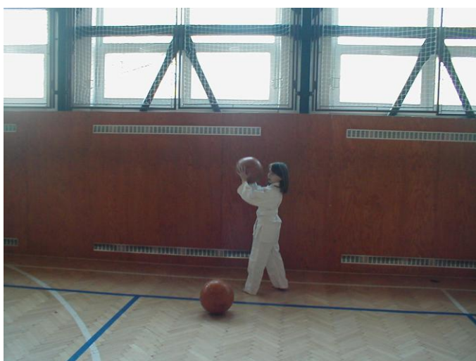
Jemné posilování s medicinbalem, součást překážkové dráhy, úkol byl třikrát vyhodit míč do vzduchu.