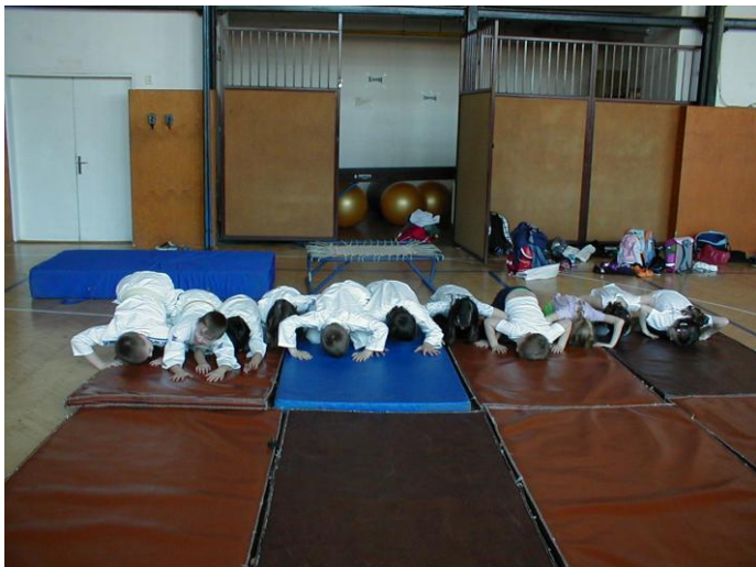
Judistický pozdrav ukloněním na začátku i na konci hodiny.