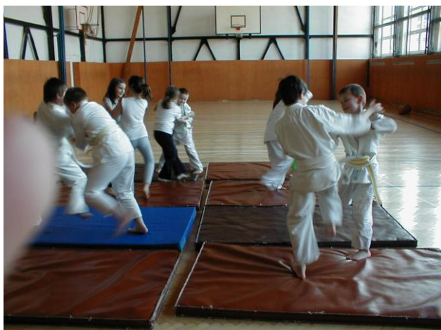
Randory v postoji.