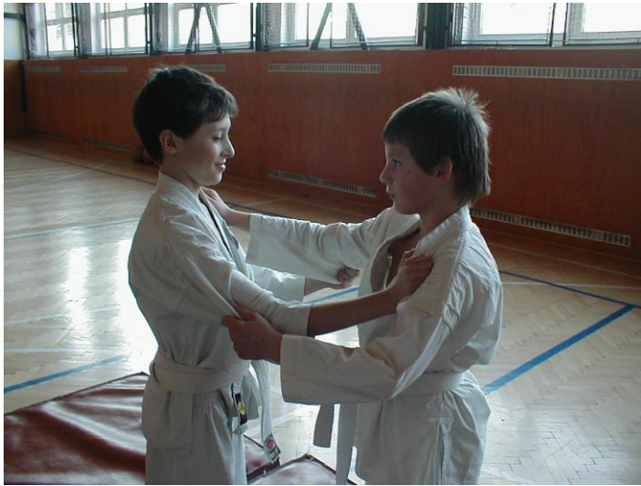
Základní judistický úchop. Správné provedení.