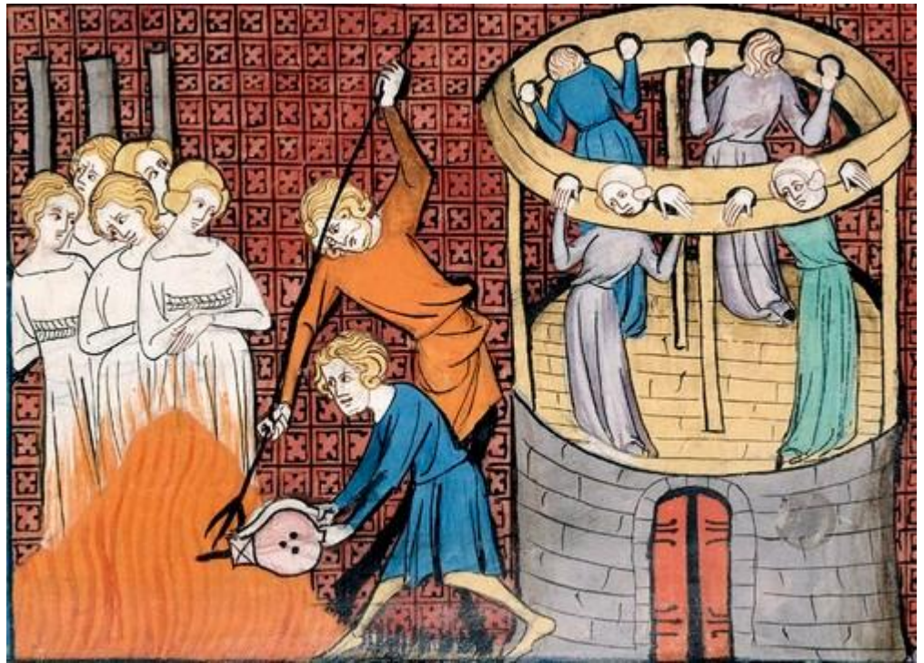
Obrázek č. 2 Vyobrazení tortury ze 14. století