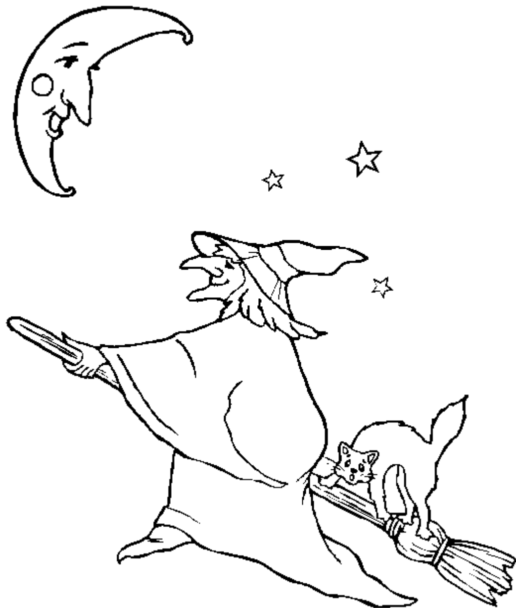
Obrázek č. 5 Dnešní pojetí čarodějnic