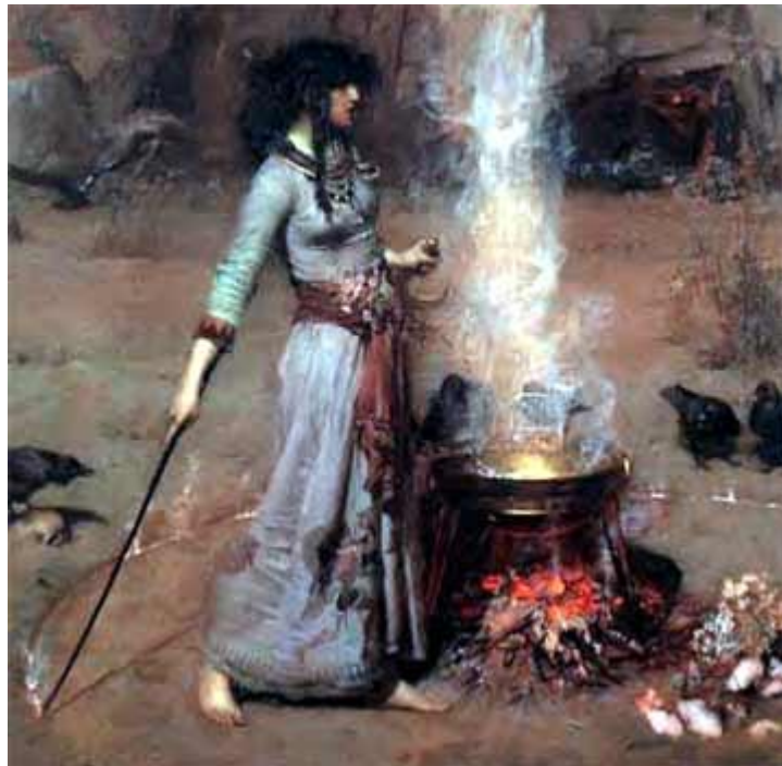
Obrázek č. 4 The magic circle, John William Waterhouse (1886)