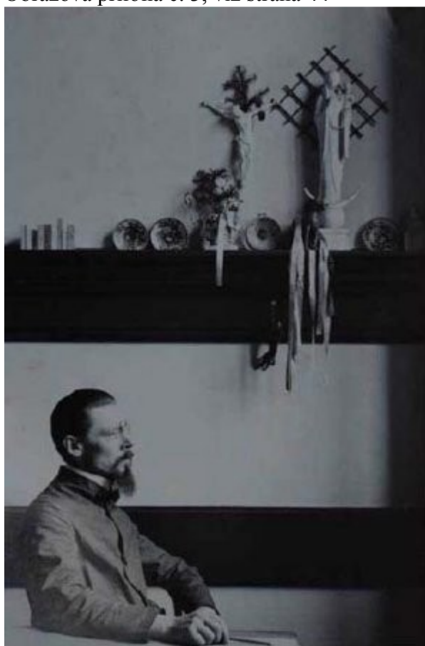
8 Plečnik za ním na polici sádrový odlitek Isis-Madonny

Lenzův návrh Isis-Madonny Obrazová příloha č. 3, viz strana 44