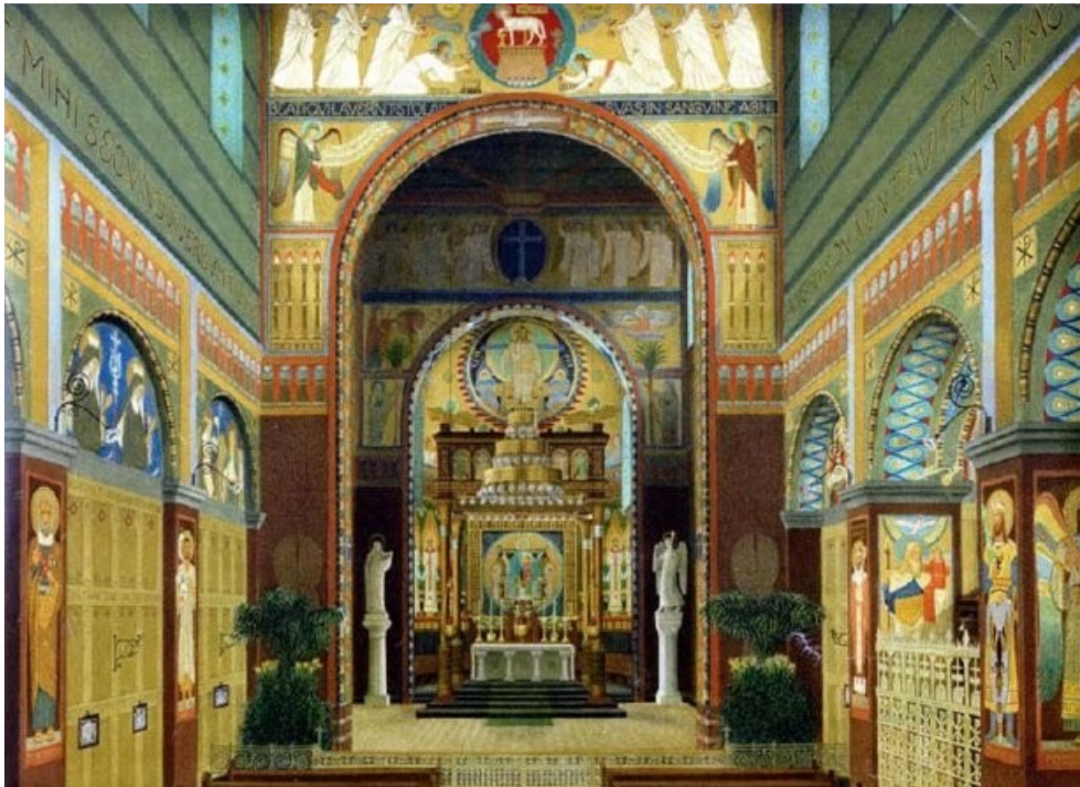
Interiér kostela Zvěstování panně Marii na Smíchově