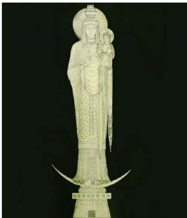
3 návrh na Isis-Madonnu, 1872

Lenzův návrh Isis-Madonny Obrazová příloha č. 3, viz strana 44