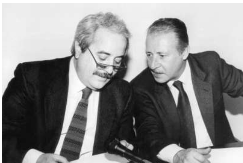
Obr. 17 – soudci Falcone a Borsellino