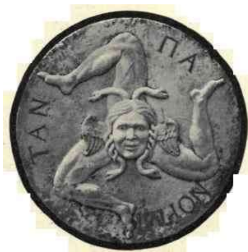
Obr. 2 – Trinacrie