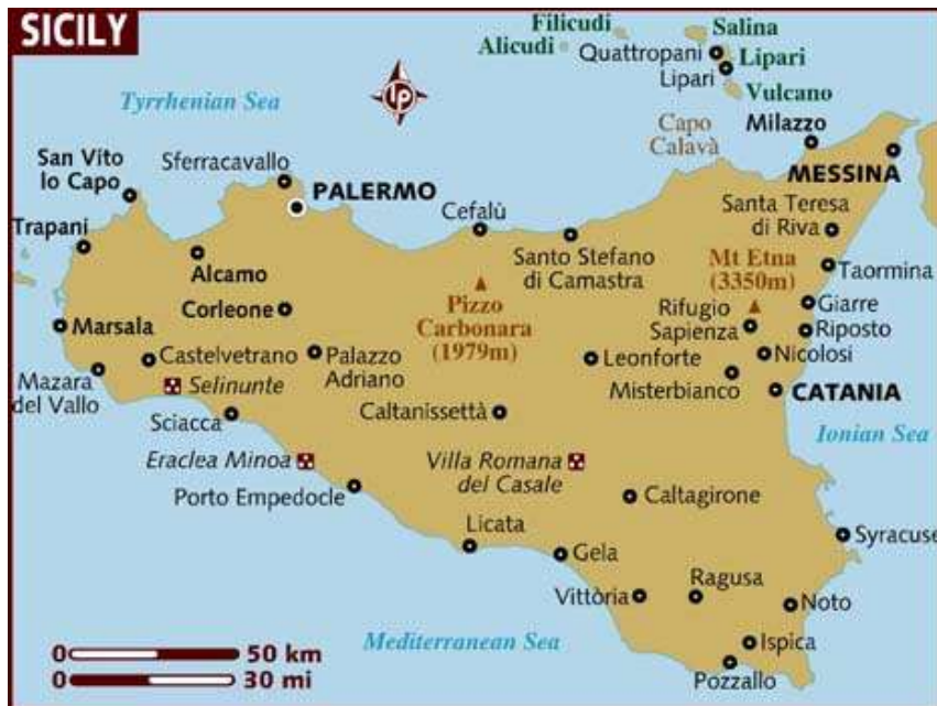
Obr. 1 – mapa Sicílie