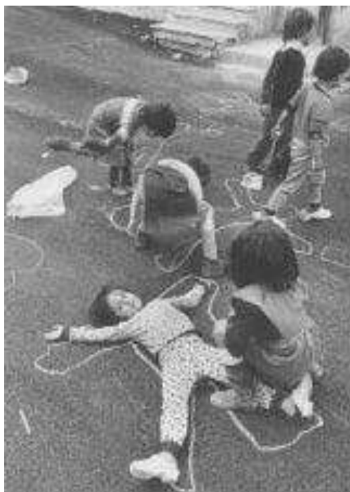
Obr. 16 – děti hrající si v ulicích Palerma na vraždy mafie