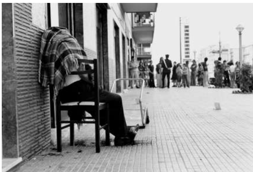
Obr. 13 – zavražděný v ulicích Palerma