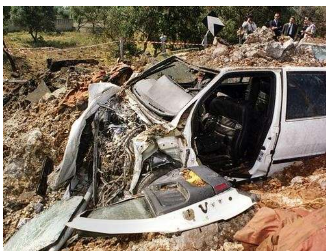
Obr. 19 – vrak vozu, ve kterém jel soudce Falcone