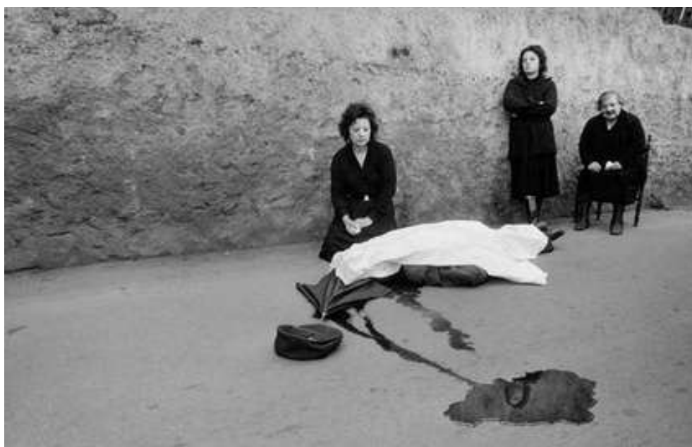
Obr. 15 – ženy u těla zavražděného příbuzného