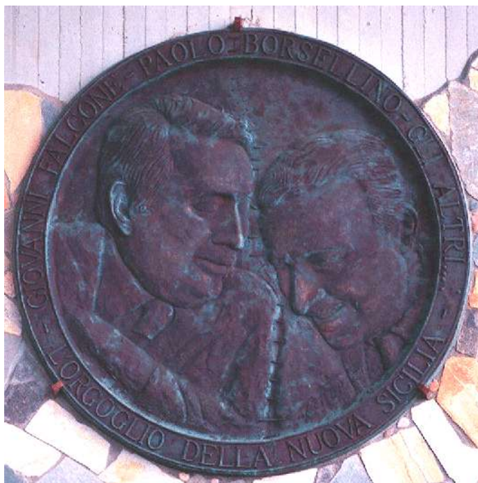
Obr. 20 – pamětní deska na Falconeho a Borselliniho na palermském letišti