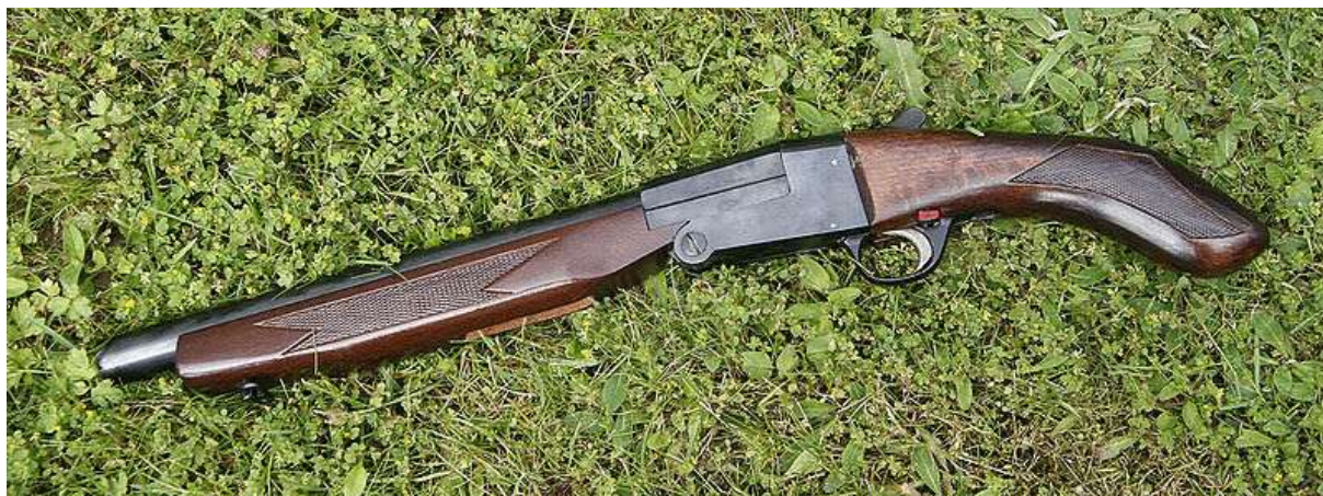
Obr. 9 – lupara