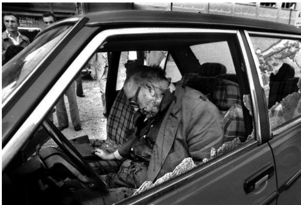
Obr. 14 – muž cti zastřelený ve svém voze