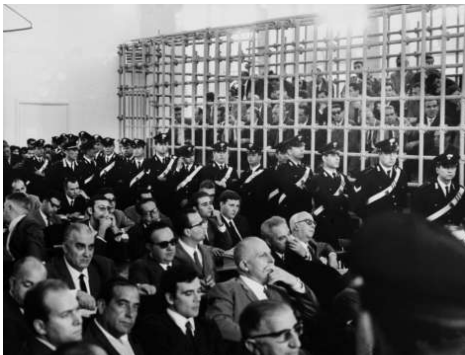
Obr. 10 – proces v Catanzaru