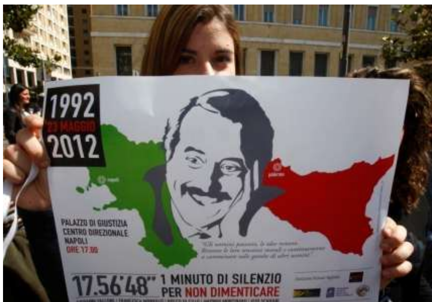
Obr. 21 – vzpomínka na soudce Falconeho v den výročí jeho smrti