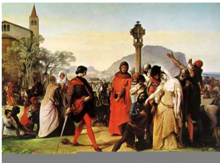
Obr. 4 – Francesco Hayez, 1846, ze série obrazů Sicilské nešpory