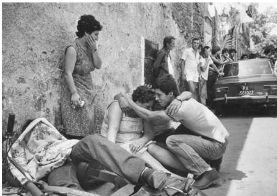
Obr. 12 – zavražděný muž cti