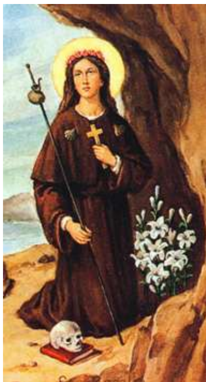
Obr. 3 – Svatá Rozálie, patronka Sicílie