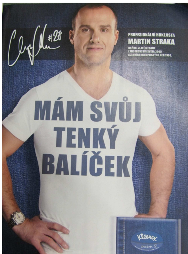
Příloha č. 3 (FHM, 6/2011)