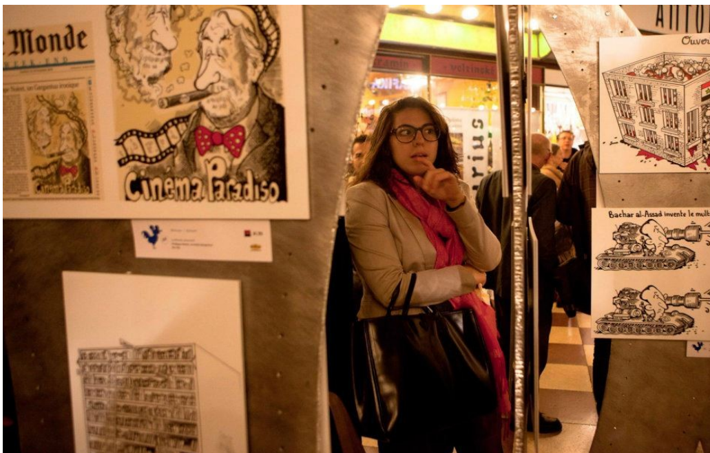
Image 10 : Une photo de l'exposition de Plantu