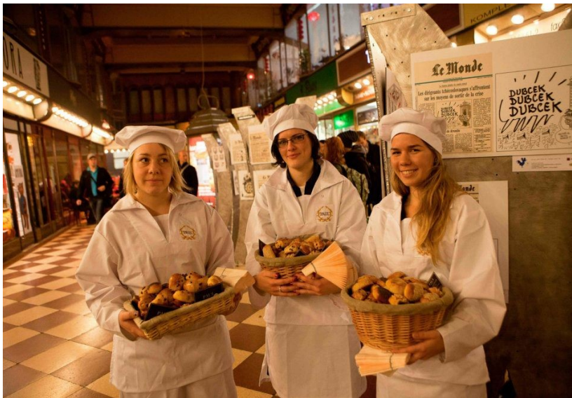
Illustrace 1: Image 11 : Une photo du vernissage de l'exposition de Plantu. Boulangerie Paul

Annexe 2 : Photos du vernissage de l'exposition de Plantu.