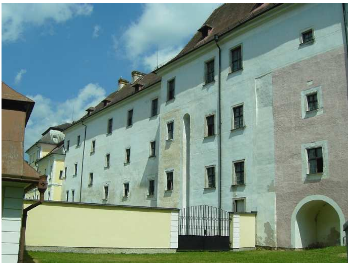
VIII. Současný pohled na bývalé klášterní hospodářské budovy.