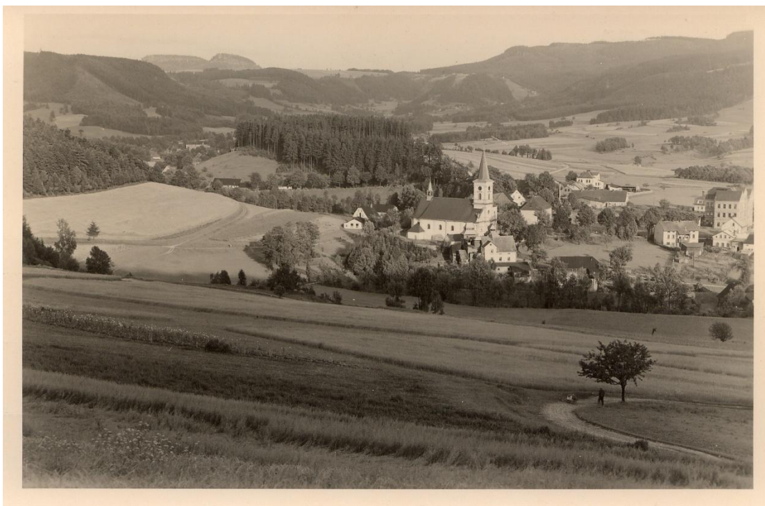
Obrázek 2-Machov a okolí