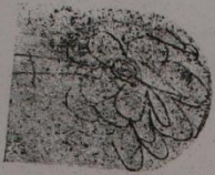
Stromy. (Kreslilo slabomyslné děvče.) \frac{1}{2}