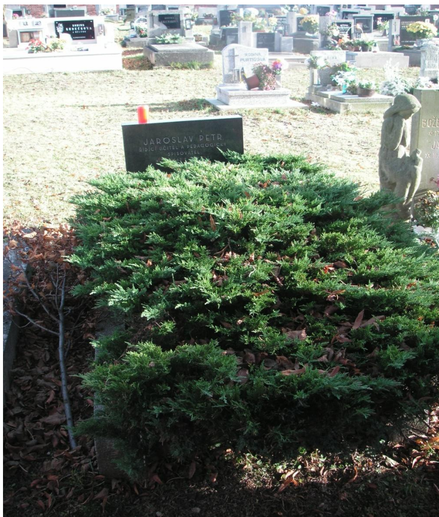
Obrázek 9 - hrob J.P. na katolickém hřbitově v Machově

(Není-li uvedeno jinak, fotografie byly sebrány mezi obyvateli Machova a okolních vesnic v rámci projektu Z náměstí po naučné stezce řídicího učitele J.P.)