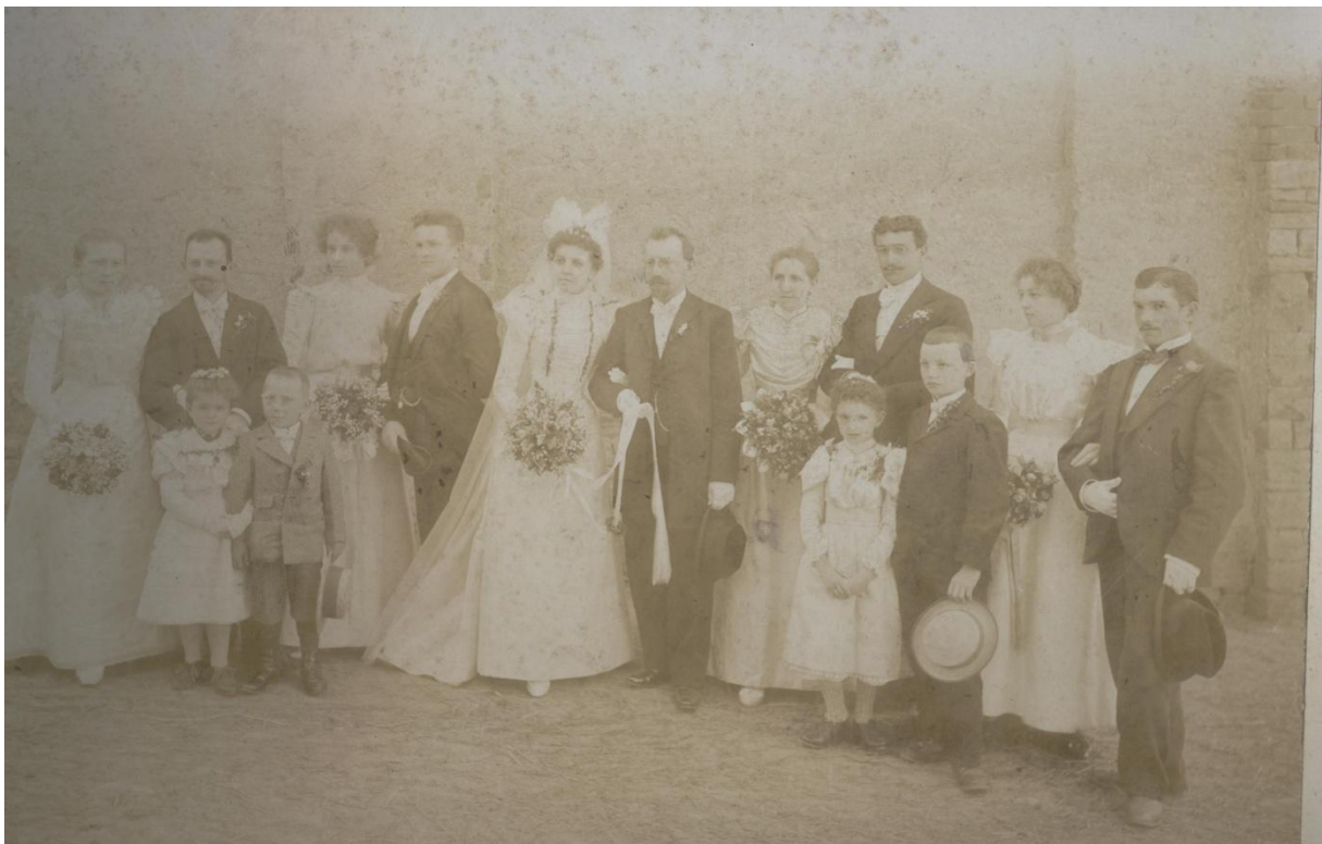
Obrázek 8-svatební foto 1898