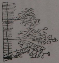
Jak jsme česali jablka.

Z potlučených jablek maminka naváří povídel a nasuší křízal. To všechno na posvíceni a na zimnu.