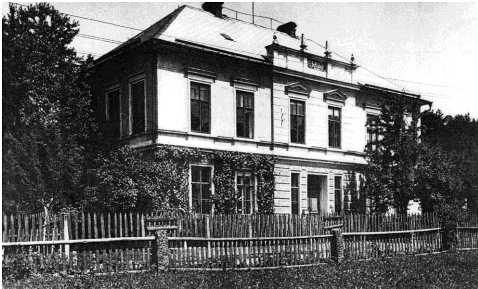
Obrázek 5-obecná škola v Nizké Srbské, vybudována v roce 1895, J.P. zde působil jako řídicí učitel od jejího zřízení do své smrti v roce 1922, škola byla zrušena v 50. letech a dnes je zde bytový dům.