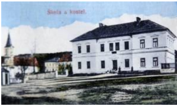
Obrázek 4-obecná škola v Machově, vybudovaná v roce 1900 a sloužící dodnes (s dostavbou)