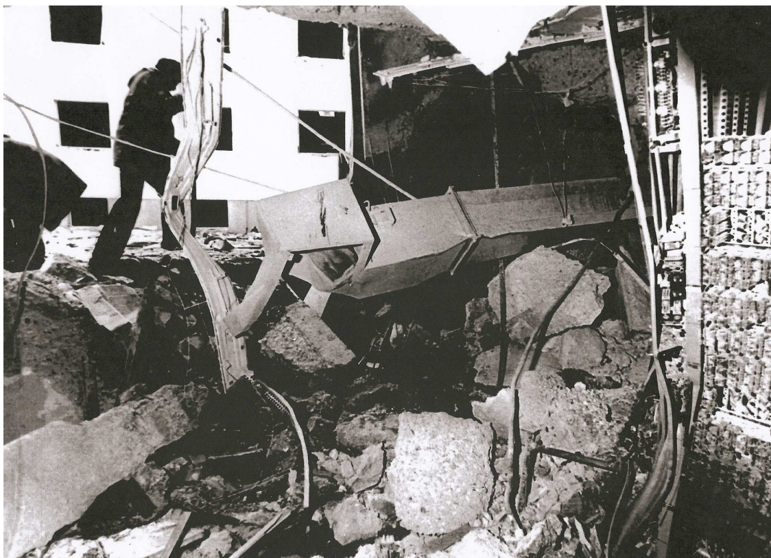
Příloha č. 3: Poničená budova RSE/RS po výbuchu v roce 1981 (fotografie)