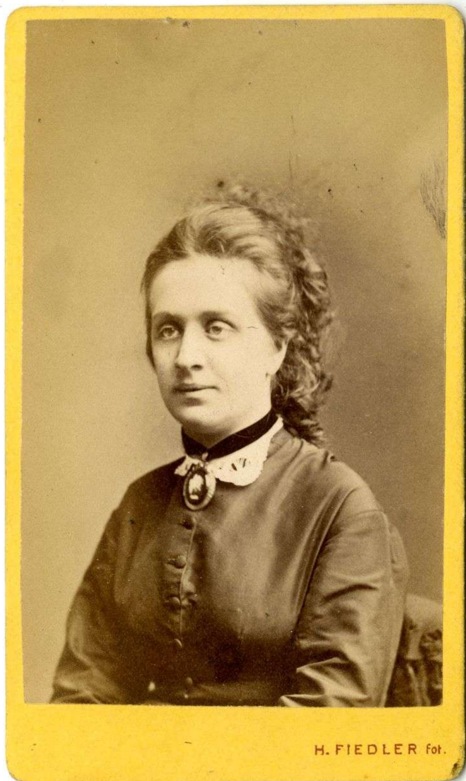
Marie Červinková-Riegrová v 80. letech