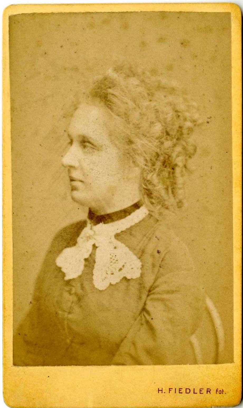
Marie Červinková-Riegrová v roce 1873