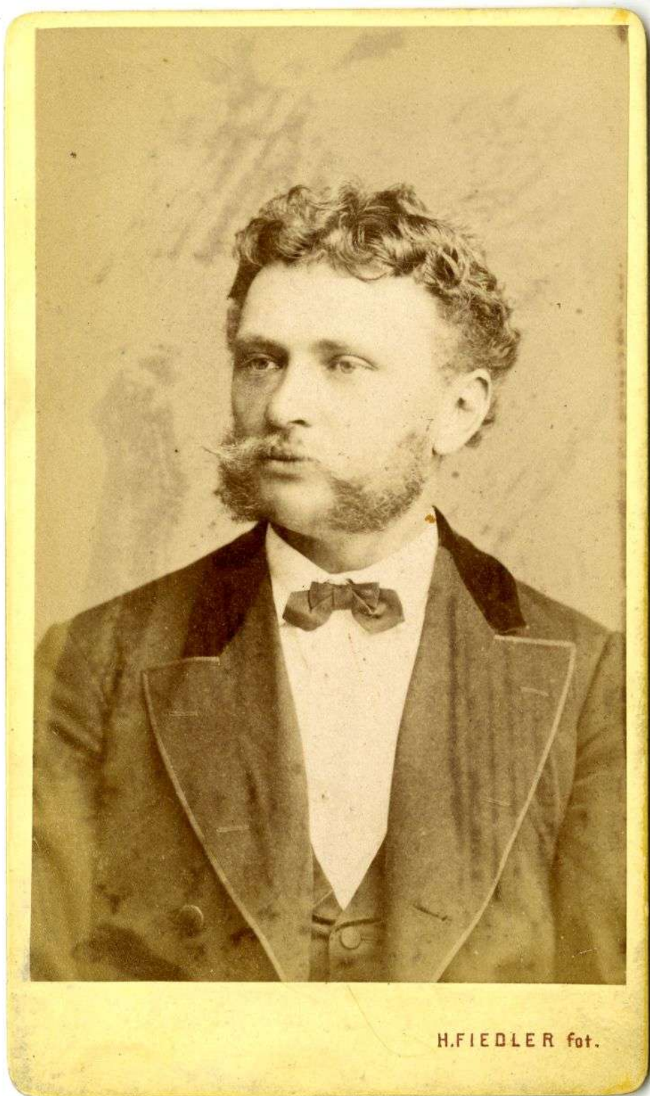
Václav Červinka (1844–1929)