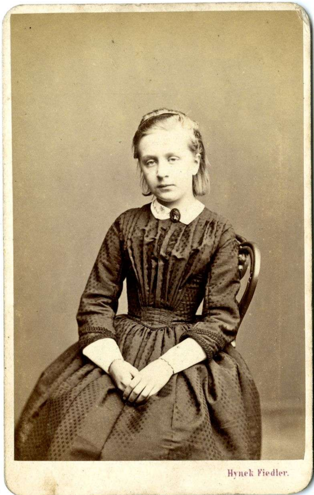
Marie Červinková-Riegrová v roce 1865