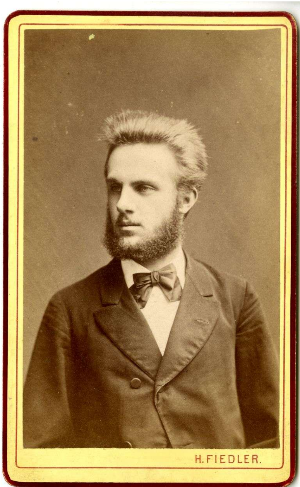
Bohuslav Rieger (1857–1907)