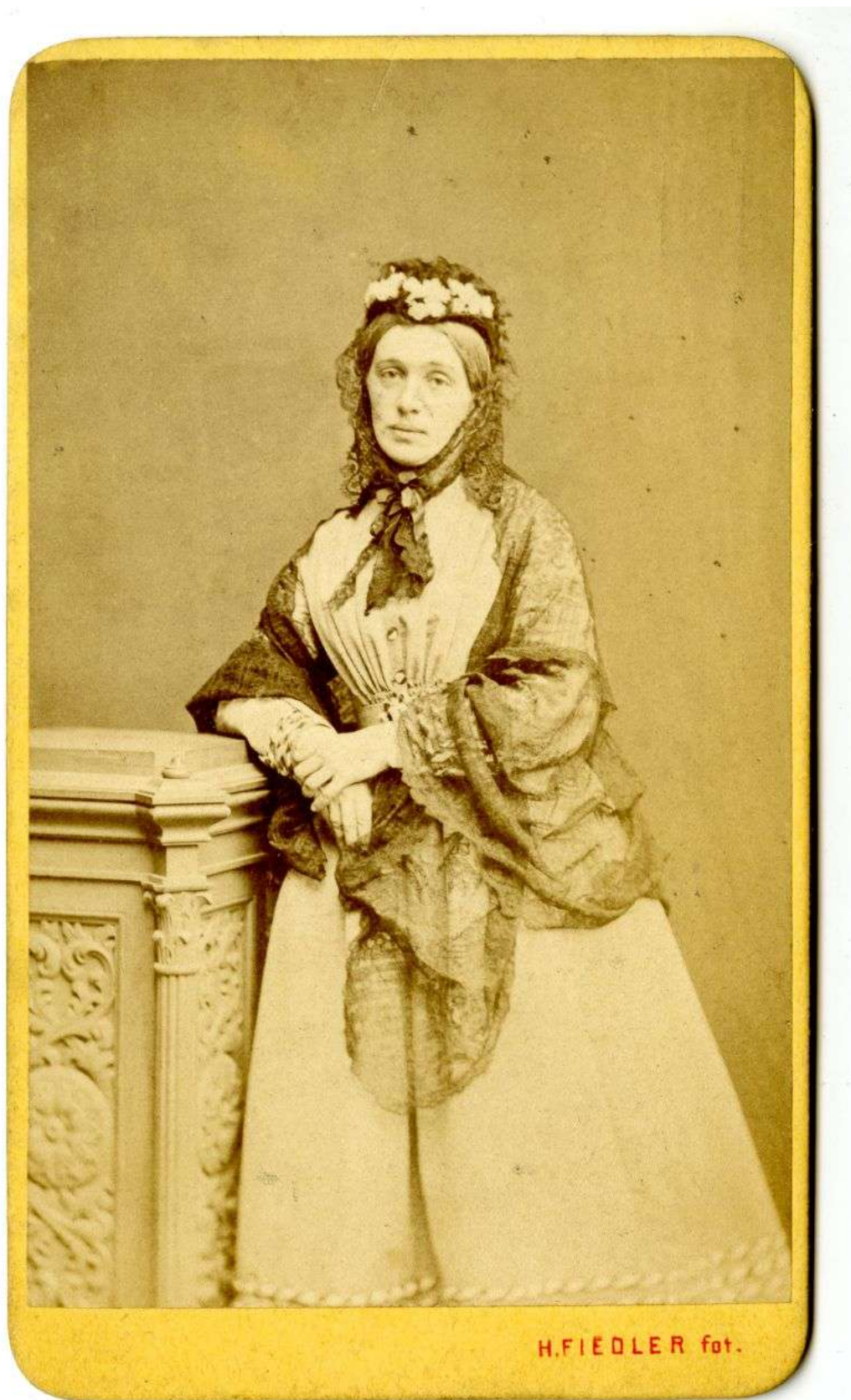
Marie Riegrová roz. Palacká (1833–1891)