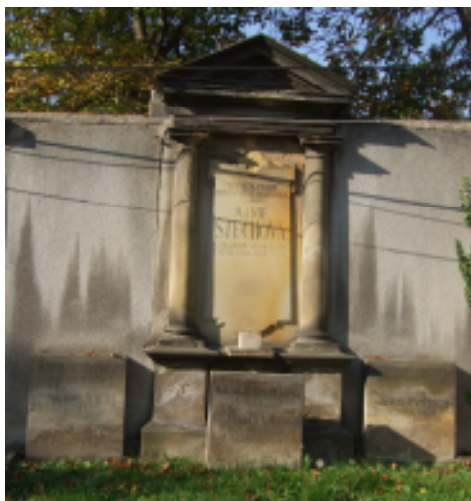
Hrob rodiny Štechovy