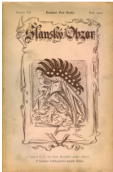
– starý přebal (1904)