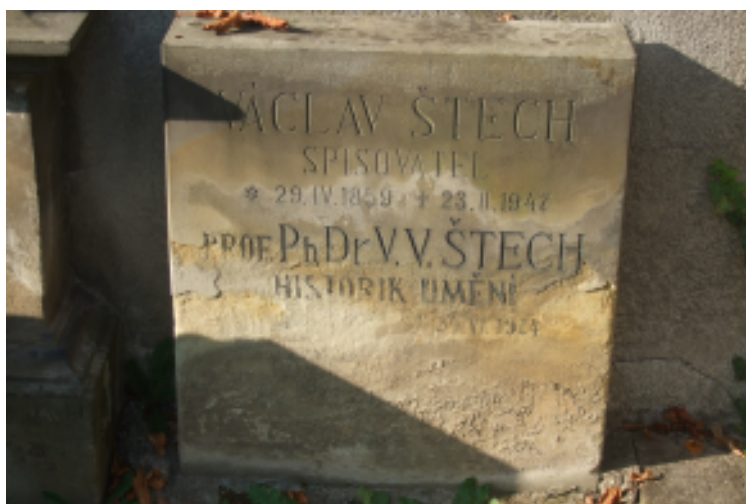
Náhrobek Václava Štecha a jeho prvorozeného syna Václava Viléma Štecha