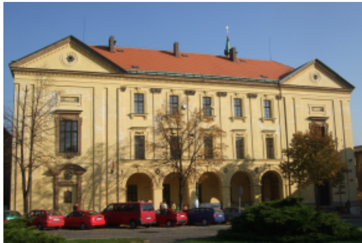
Slánské vlastivědné muzeum, Knihovna V. Štecha, Infocentrum Slaný (dříve piaristická kolej, později slánské gymnázium)