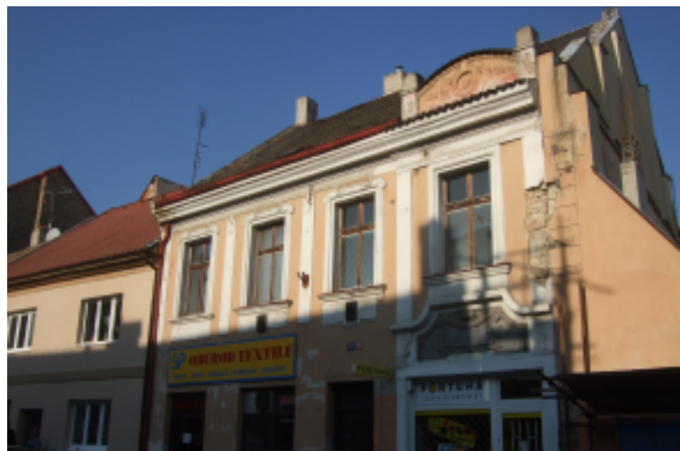
Dům Václava Štecha v ulici Třebízského