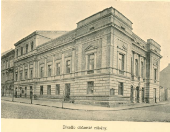
Divadlo občanské záložny