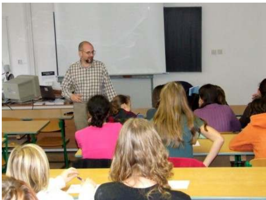
autor práce na jedné z přednášek, kde prováděl dotazníkový výzkum