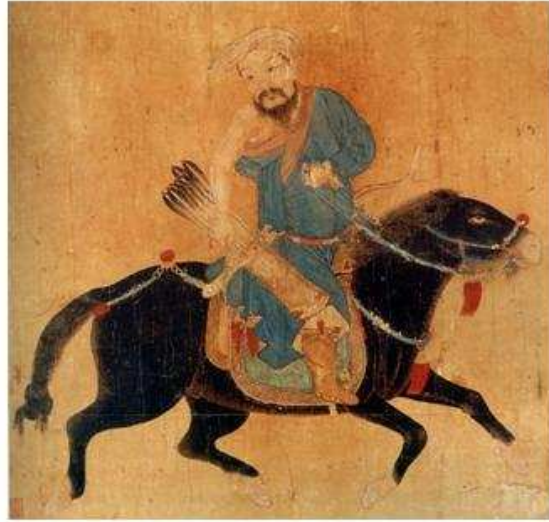
Mongolský válečník na koni