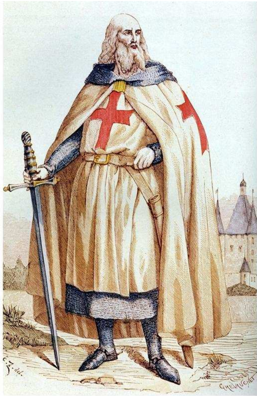
Poslední templářský velmistr Jacques de Molay