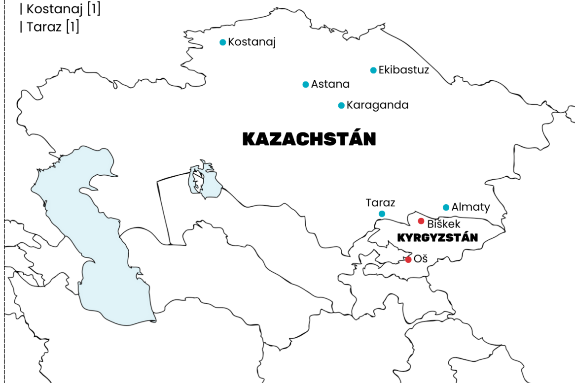
Obrázek 4: Mapa původu respondentů | grafické zpracování: autor práce

Co se týče věkového ohraničení, snažili jsme se oslovovat respondenty ve věku od 18 do 30 let. Nejmladším zúčastněným respondentům bylo 21 let, nejstarším respondentům 30 let. Průměrný věk všech zúčastněných vychází na 25 let. Celkově se výzkumu zúčastnilo více respondentek než respondentů. Přikládáme stručný přehled: