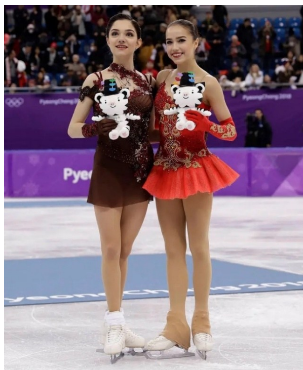
Obrázek č. 4 ZOH Peking 2022