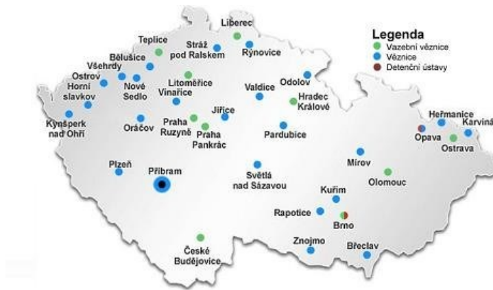
Obrázek 1 Vězeňská zařízení v České republice

Dle ustanovení § 56 odst. 3 trestního zákoníku pak může soud o zařazení odsouzeného rozhodnout i jinak, a to zejména pokud má, se zřetelem na závažnost trestného činu a na stupeň a povahu narušení pachatele, za to, že působení na odsouzeného, aby vedl řádný život, bude v jiném typu věznice zaručeno lépe.