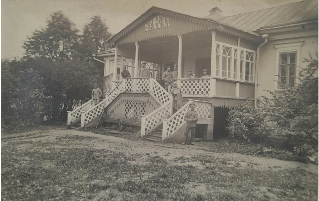
2. Vila ve Vrchnia Mulli v Permské gubernii v Rusku, kde byli ubytováni váleční zajatci - důstojníci