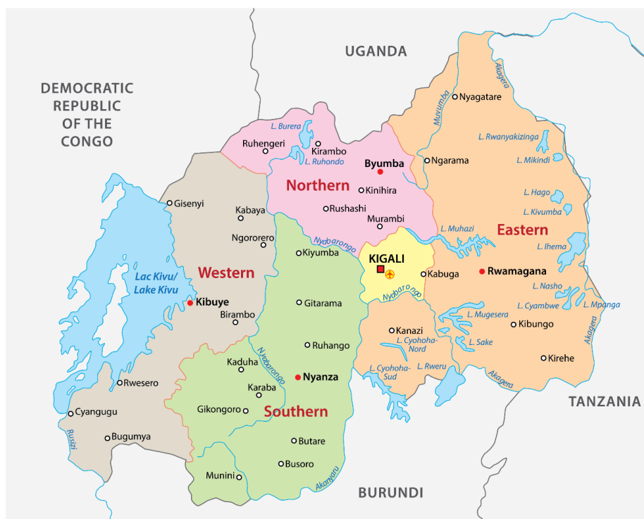
Obrázek 1: Rwanda a její provincie