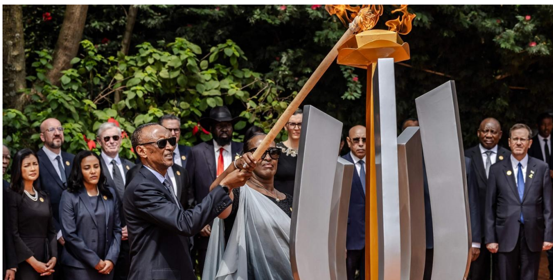
Obrázek 5: Zapálení ohně v památníku Gisozi během vzpomínkových akcí v roce 2024