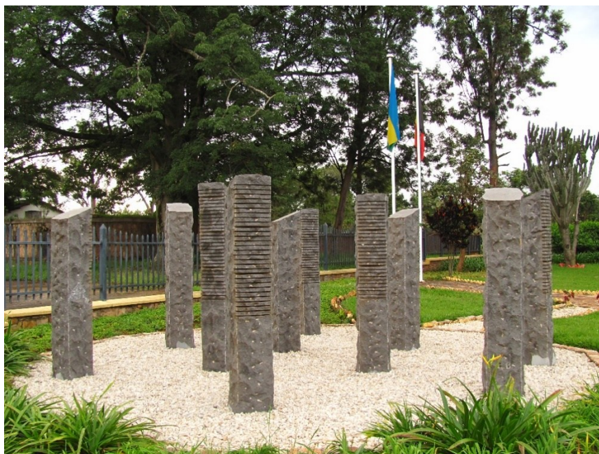
Obrázek 6: Památník deseti padlých belgických vojáků v Kigali