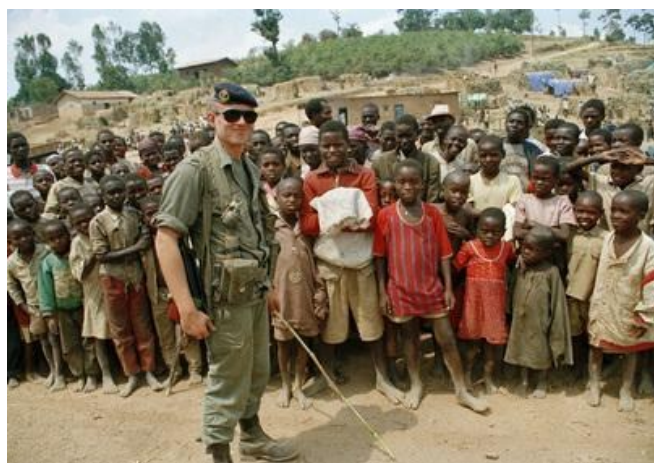
Obrázek 3: Voják mírové mise UNAMIR během genocidy ve Rwandě