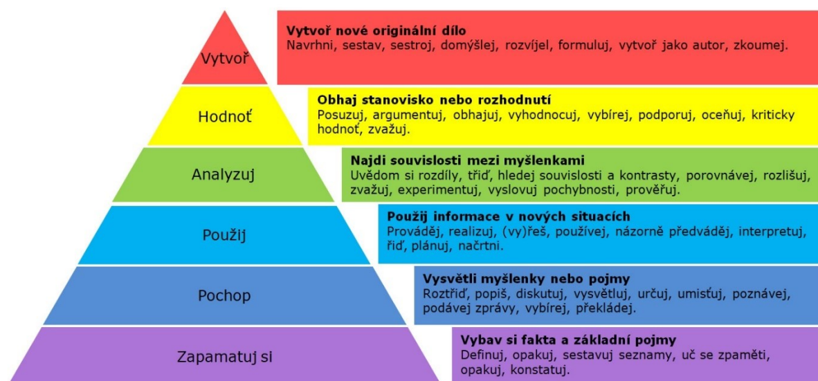
Obrázek 1 – Bloomova taxonomie

dílčích částí do nových celků. To zahrnuje nejen kombinaci existujících poznatků, ale i tvorbu zcela nových výstupů. Rozdíl mezi syntézou a nižšími kategoriemi spočívá v tom, že žáci vytvářejí něco nového, i když to může být subjektivní. Mezi používaná slovesa patří kategorizovat, klasifikovat, kombinovat, modifikovat, navrhovat, organizovat, shrnout nebo vyvodit obecné závěry. Produkty této kategorie mohou být články, vynálezy, písně nebo soubory pravidel. Nejvyšší kategorií je hodnocení posouzení, které zahrnuje schopnost hodnotit složité produkty na základě předem stanovených kritérií. Aktivní slovesa zde zahrnují argumentovat, obhajovat, ocenit, oponovat, porovnávat, provádět kritiku, posuzovat, ověřovat, srovnávat s normami, uvádět klady a zápory, zdůvodňovat a hodnotit. Produkty mohou zahrnovat závěry, posudky, diskuse nebo sebehodnocení.