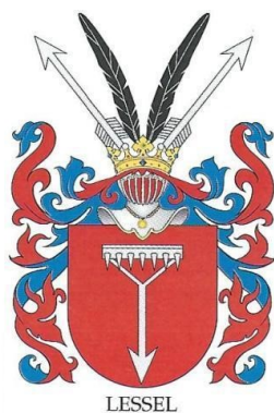
Obrázek č.1 - Erb rodiny Lessel 47

Kombinace červené a modré barvy naznačuje dobročinnost. Uprostřed štítu jsou umístěny hrábě, hlavní symbol rodu Grabie, které odkazují na vazby rodiny na zemědělské tradice a hospodářství. Na konci hrábí se nachází šipka naznačující dynamiku a směr, což může symbolizovat pokrok a vytrvalost rodu. Nad štítem se tyčí přilba a brnění, tradiční prvky heraldiky, které odkazují na vojenskou tradici a ochranu, kterou erb ztělesňuje. Přilbu zdobí zlatá koruna, symbol šlechtického postavení a moci rodu. Dekorativním prvkem nad přilbou jsou pravděpodobně pštrosí pera, která dodávají erbu další vrstvu významu, symbolizují ducha a noblesu. Z každé strany erbu vyčnívá jedno kopí, vyjadřující odhodlání a připravenost bránit rodinu a její hodnoty. Celkově erb rodiny Grabie ztělesňuje nejen rodinnou identitu, ale také kulturní a historické hodnoty. Hrábě jako hlavní symbol zdůrazňují spojení rodu s půdou, zatímco vojenské prvky podtrhují jeho historickou roli v obraně a ochraně. Tento vzhled erbu vyjadřuje hrdost a tradici, které jsou nedílnou součástí identity rodu Grabie 46 .