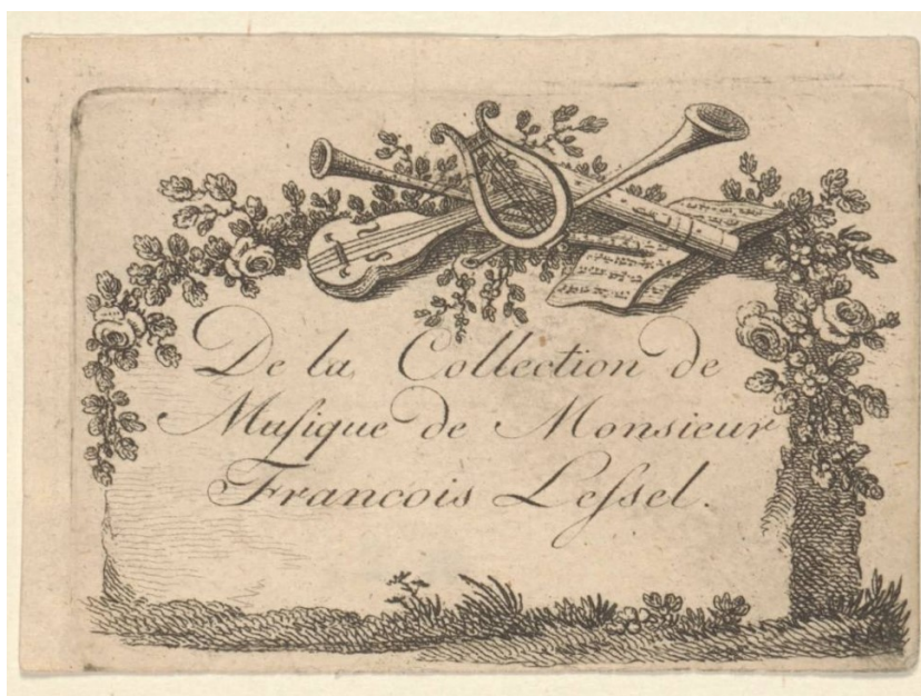
Obrázek č.3 Rukopis s nadpisem De la Collection de Musique de Monsieur François Lessel 164