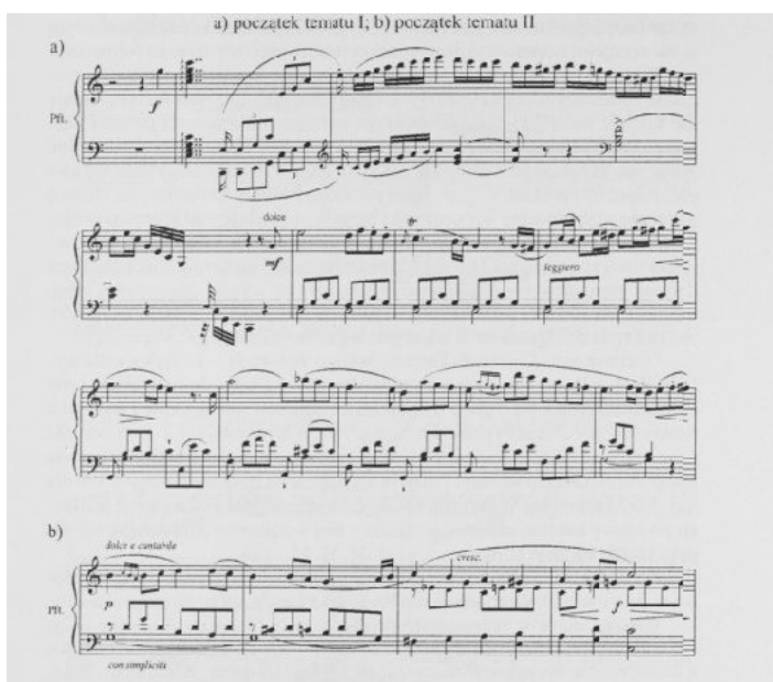
Obrázek č.2 Ukázka skladby z prvního charitativního vystoupení Franciszka Lessela ve Varšavě, Koncert fortepiano C dur op. 14 , dne 3. února 1810 135 .