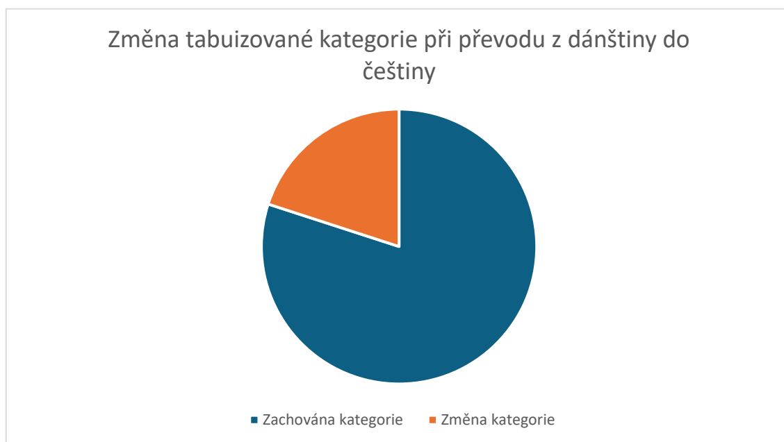
Graf č. 2

kategorie třikrát. Z celkových šedesáti negativních expresiv došlo ke změně tabuizované kategorie při převodu do češtiny pouze dvanáctkrát, což činí 20 % (Graf č.2).