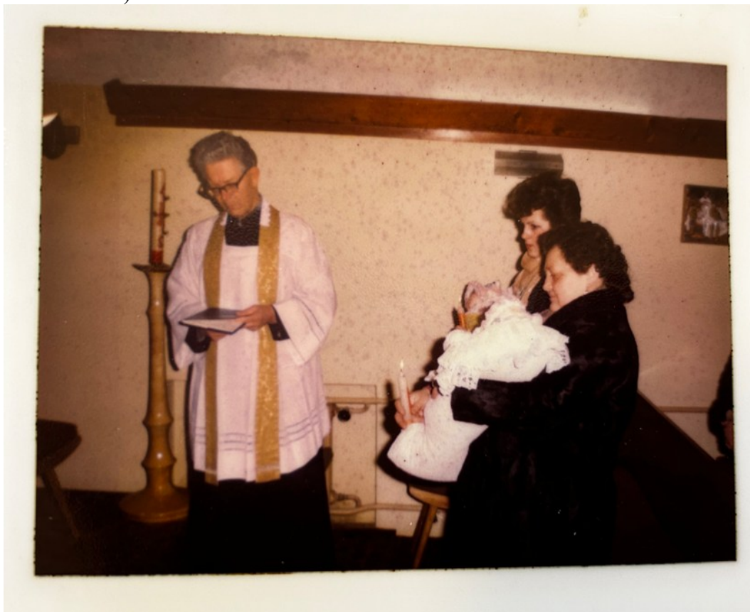
13) Při křtu.