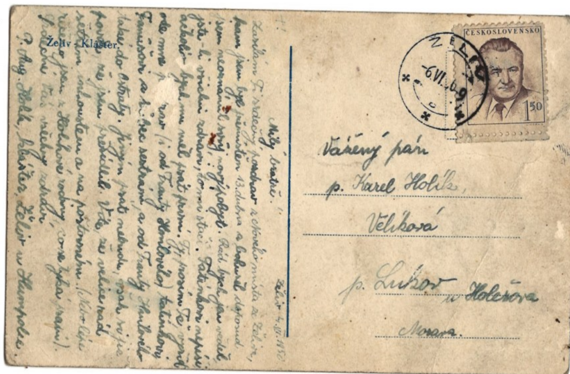
2) Pohled ze Želiva adresovaný bratru Karlovi. 4. června 1950.