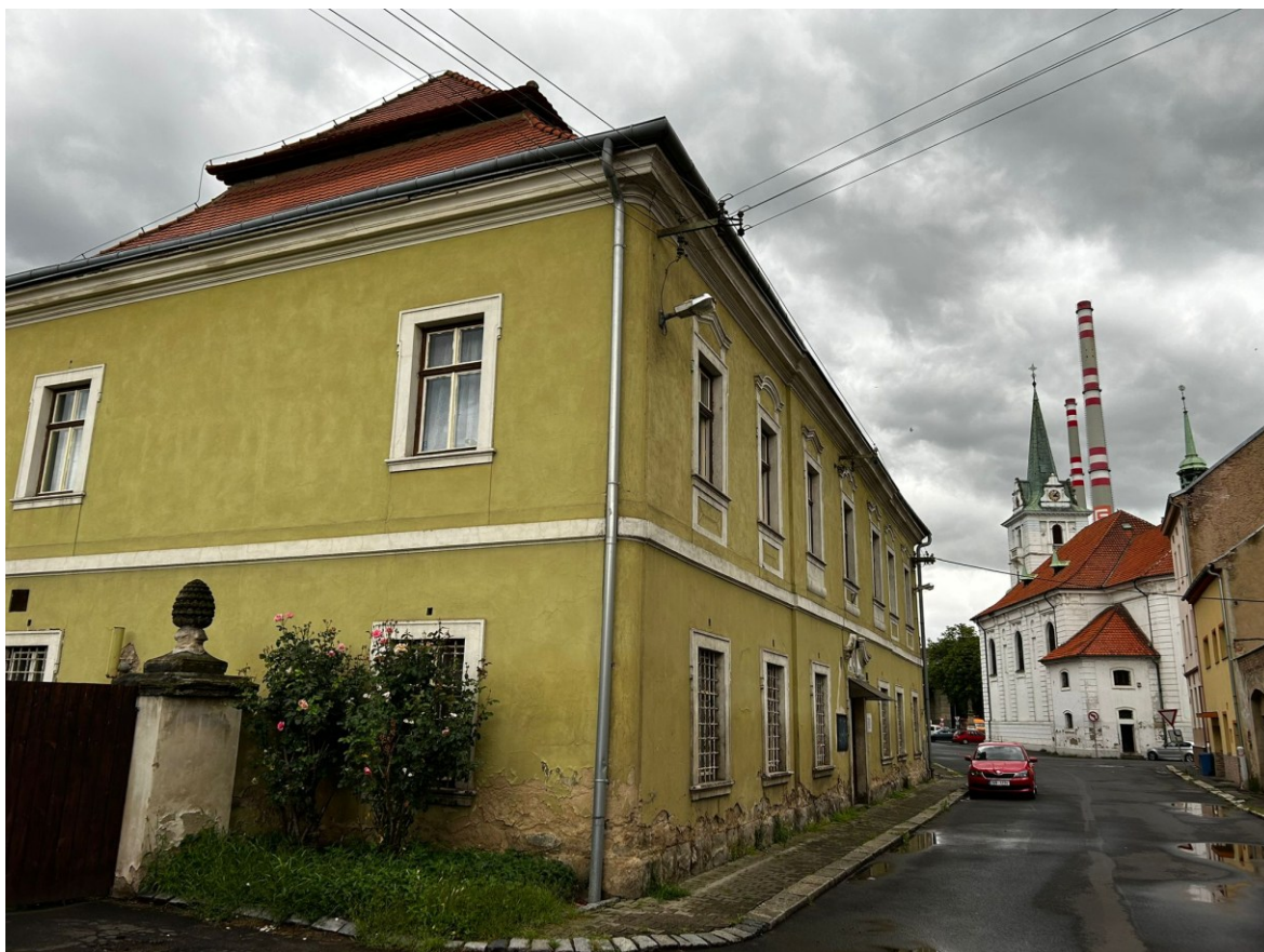
12) Trnická fara. V pozadí kostel Narození Panny Marie a Teplárna Trmice.