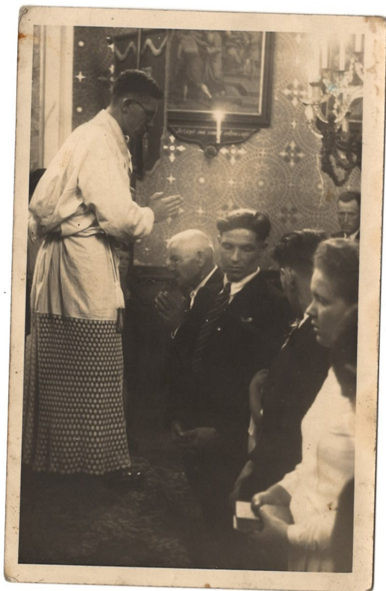
4) Primiční mše v Lukově. 13. července 1947. (osobní archiv Jaroslava Holíka)