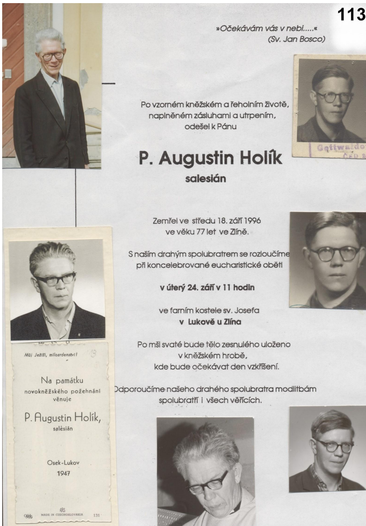
1) Parte.