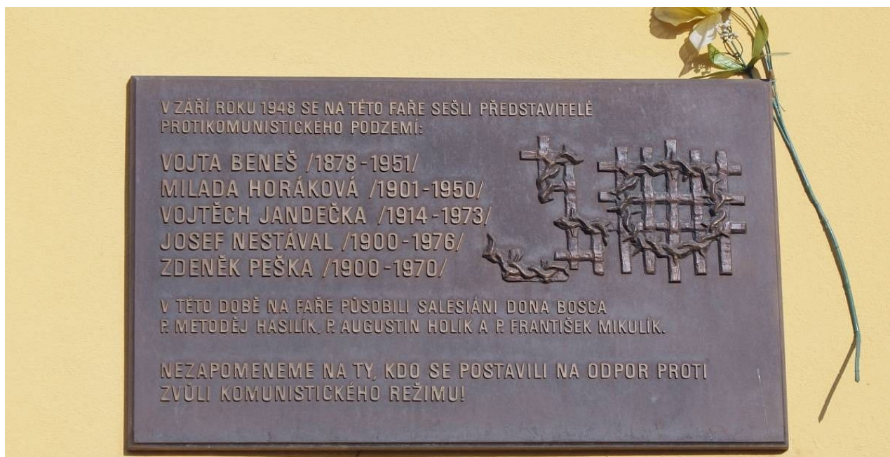
6) Pamětní deska na faře ve Vinoři