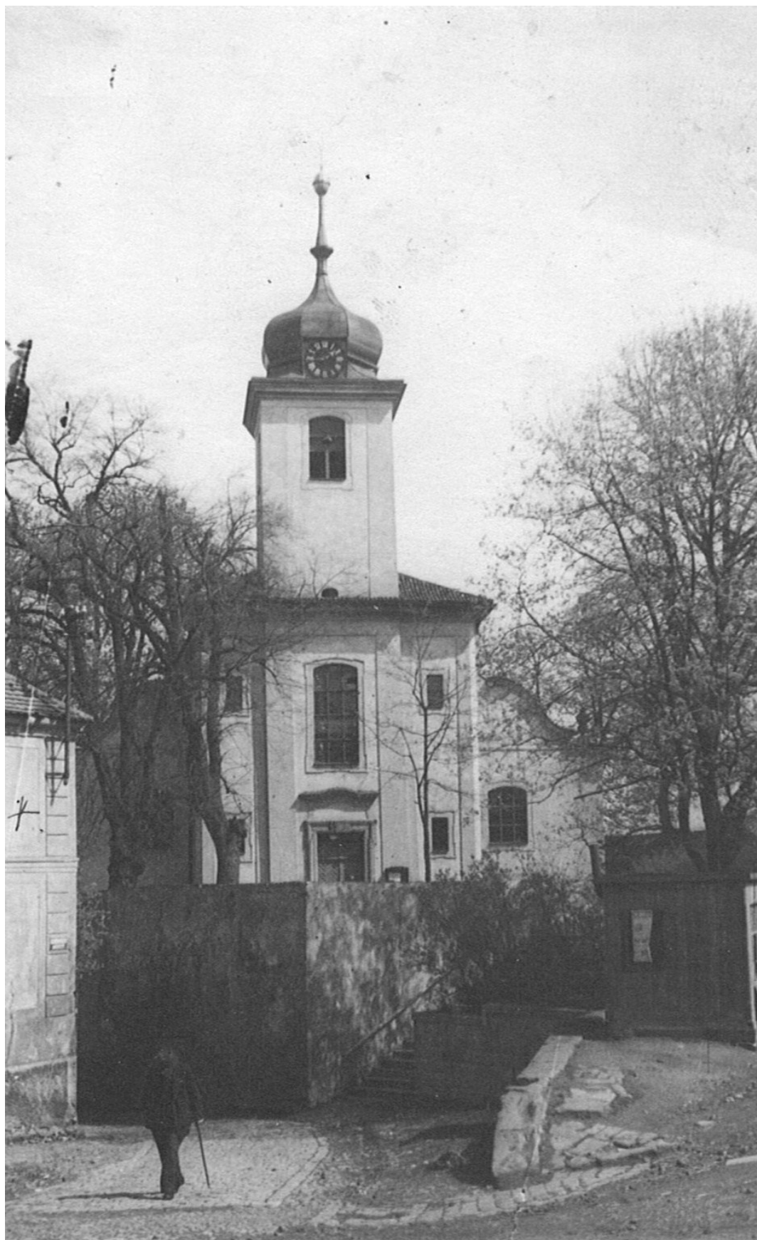
5) Vinořský kostel Povýšení svatého kříže.