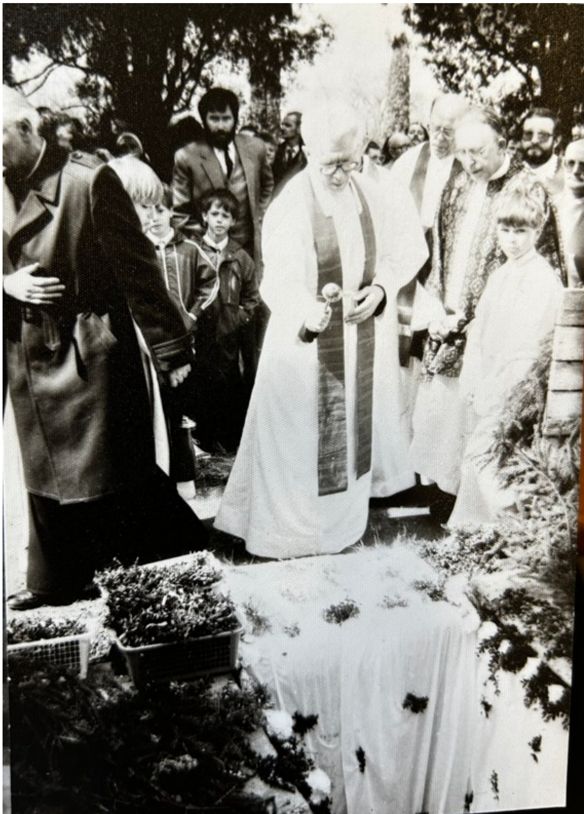
14) Při pohřbu.