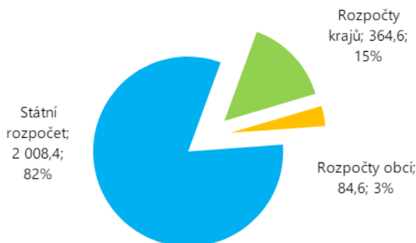
Obrázek 3: Struktura výdajů na politiku v oblasti závislosti z veřejných rozpočtů v r. 2021, v mil. Kč. (Chomynová et al., 2023, s. 30)

jednorázové finanční příspěvky na základě individuálních žádostí poskytovatelů služeb, nebo kombinaci obou forem podpory. Kromě toho města a obce podporují služby i prostřednictvím bezúročných půjček, poskytnutím finančního příspěvku na provozní náklady, dary, pronájem prostorů za symbolické ceny atd., přičemž tyto formy podpory nejsou součástí systematických nástrojů financování (RVKPP, 2019a).