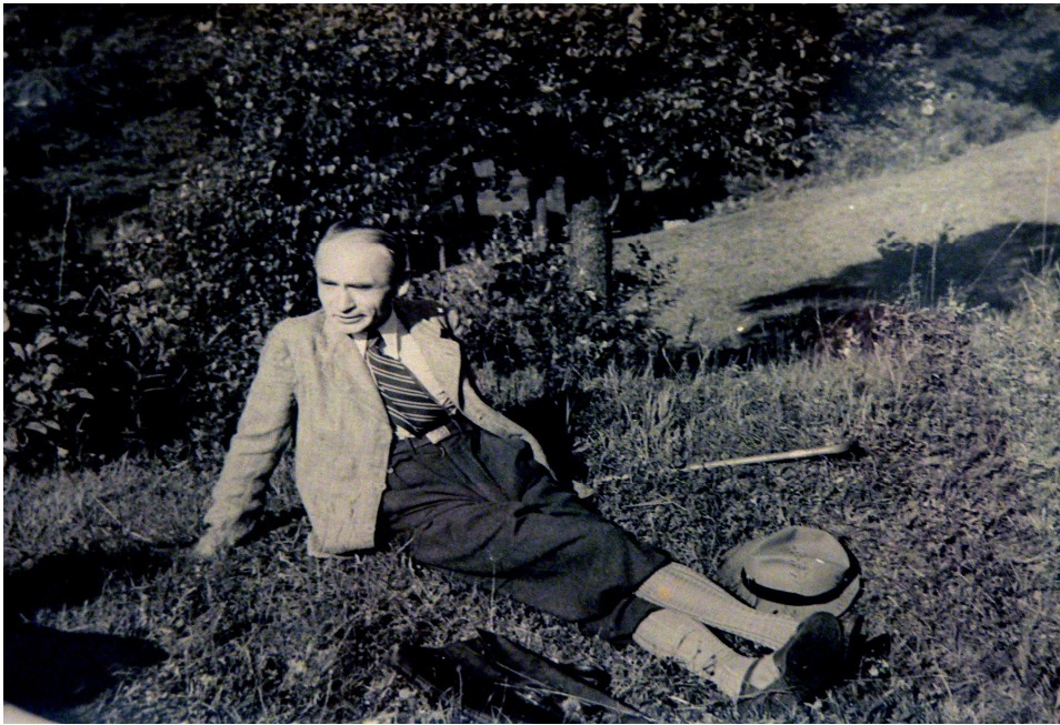
Na dovolené v Jilemnici v létě 1943.