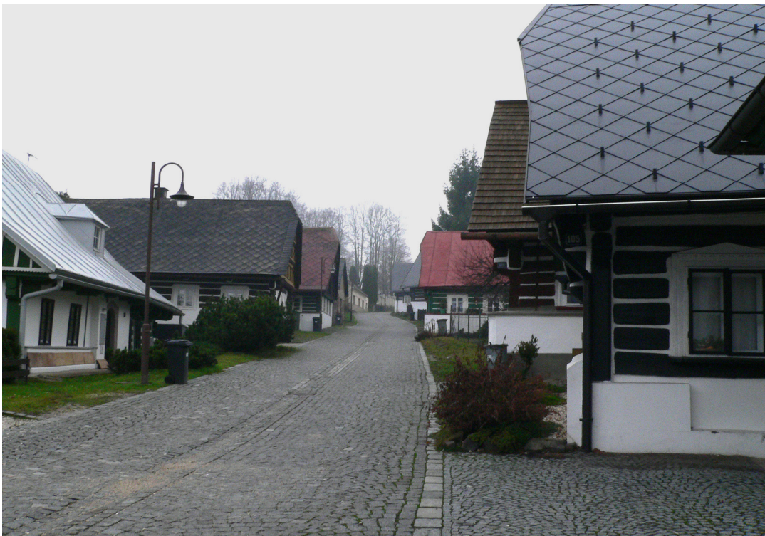
Zvědavá ulička v Jilemnici se „zvědavě“ nakloněnými průčelími domů. Setkáváme se s ní ve Weissově románu Přišel z hor.