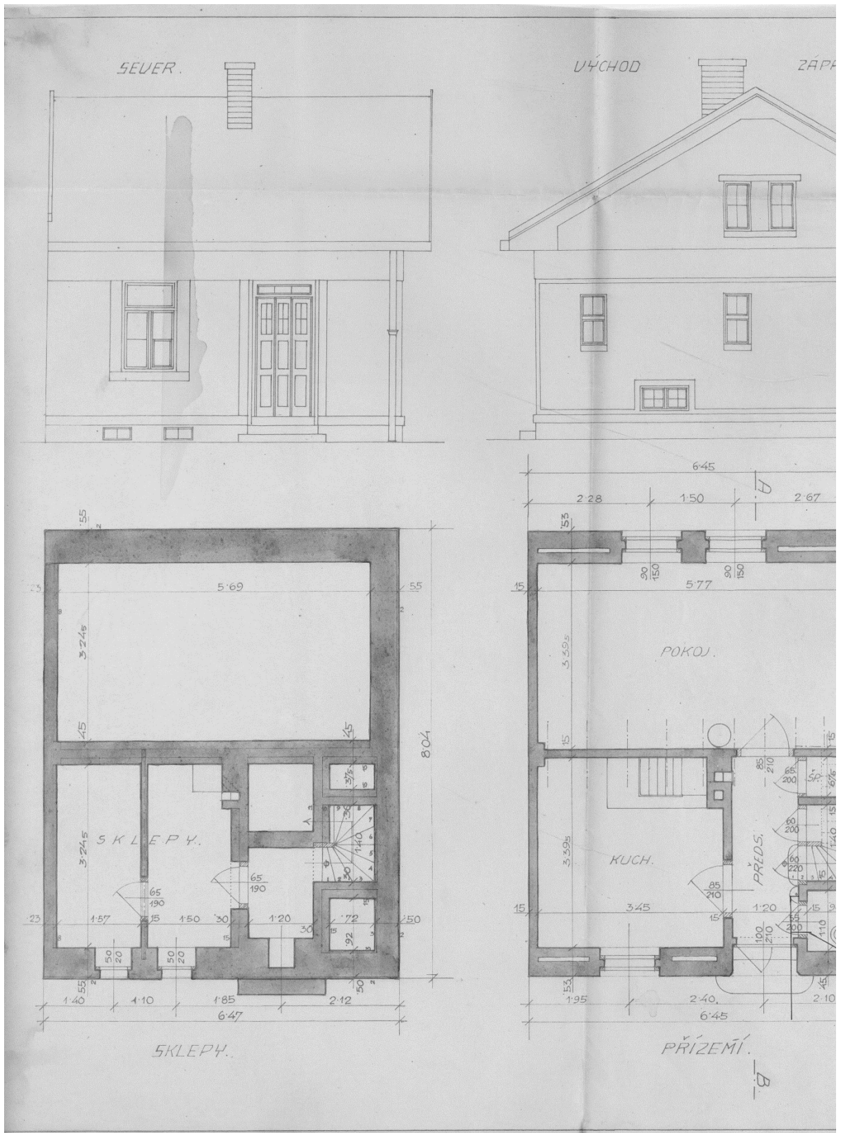
Obrázek 3, Návrh domku o dvou místnostech, část I.