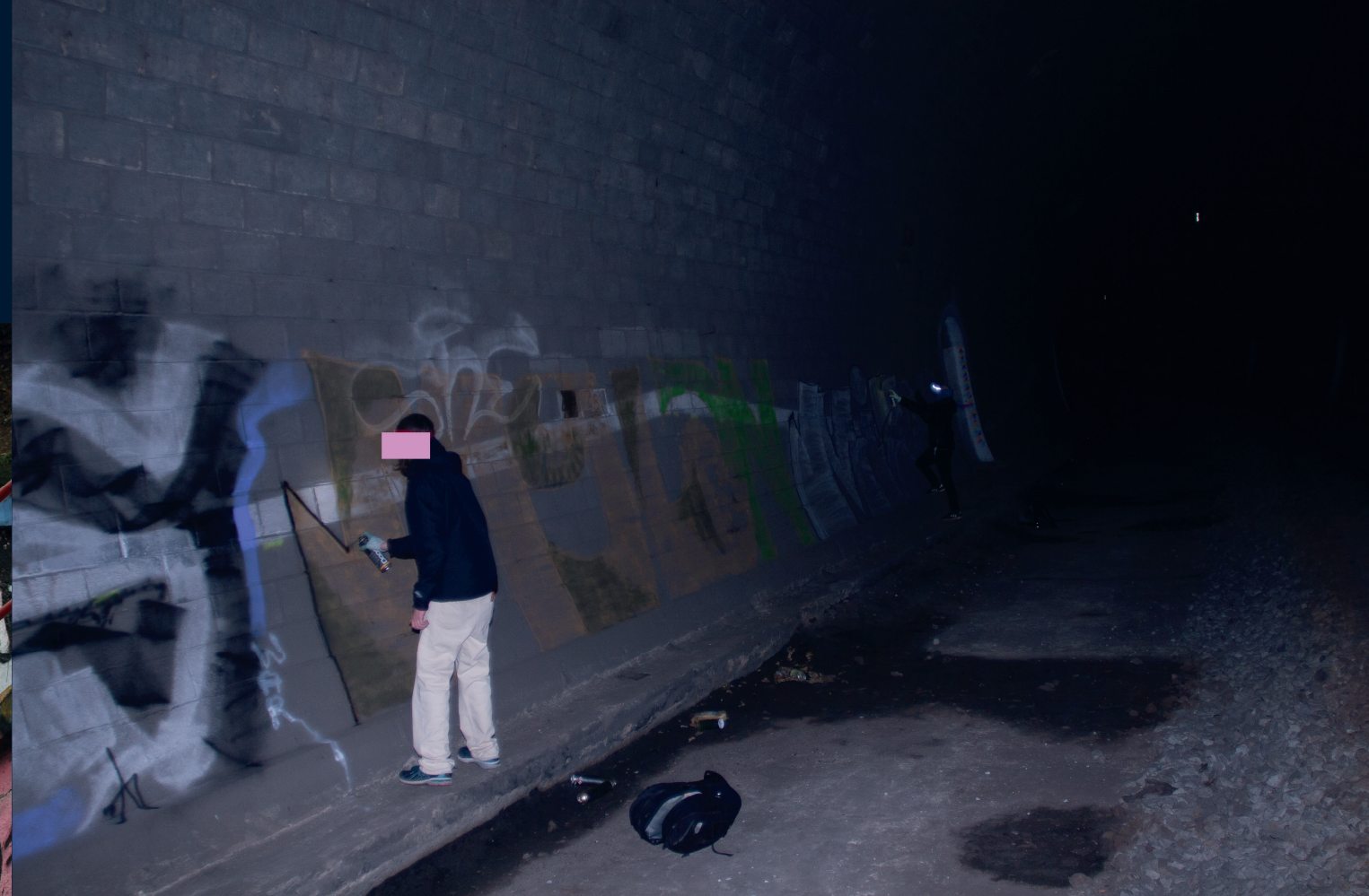
Praha – Žižkov/ říjen 2021 Praha – Braník/ listopad 2021