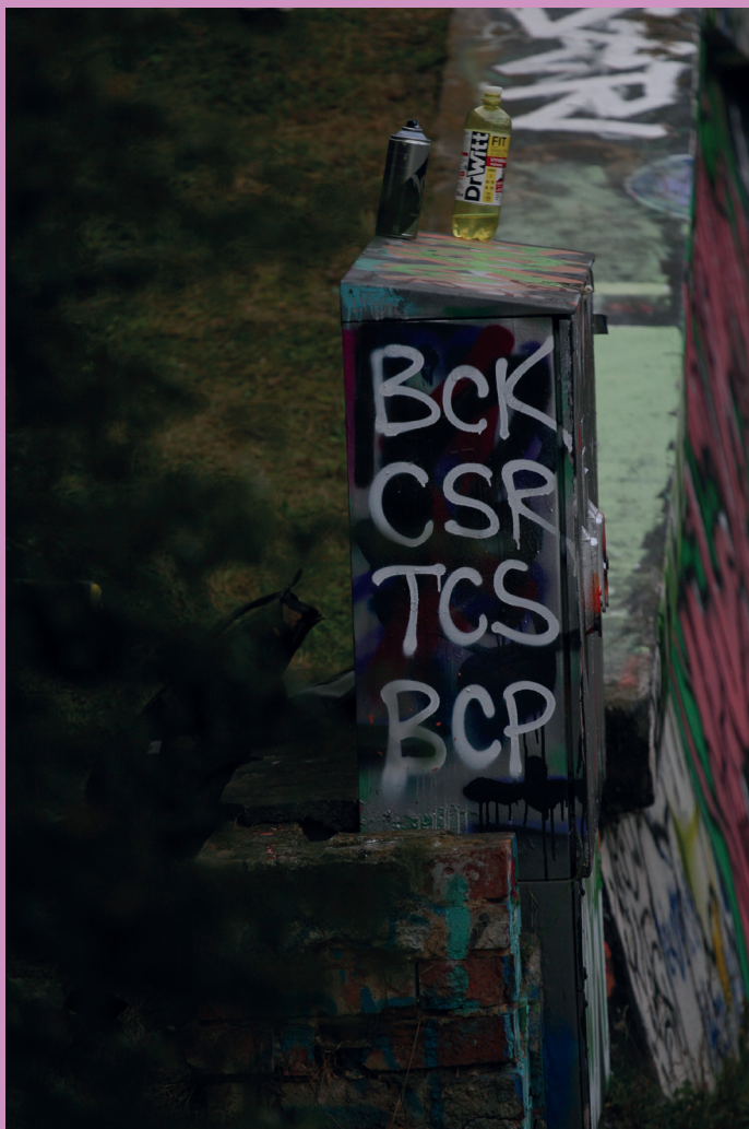
Praha – Žižkov/ říjen 2021