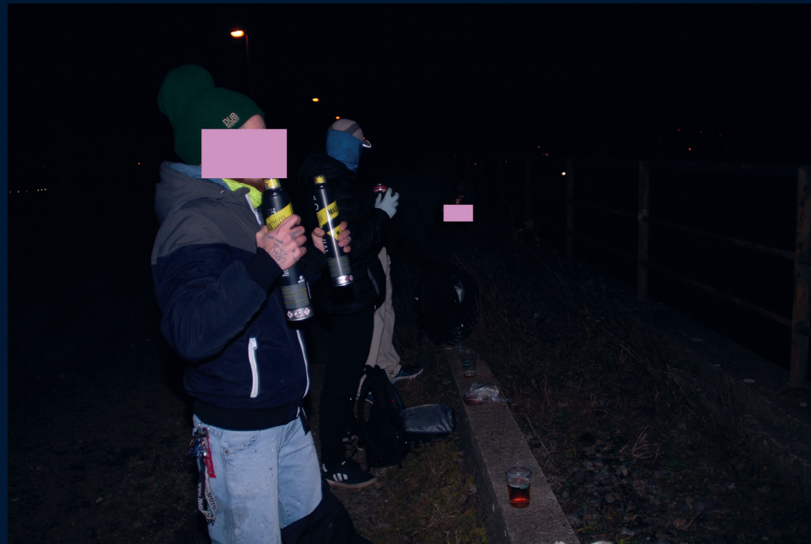
Praha – Žižkov/ říjen 2021 Praha – Braník/ listopad 2021