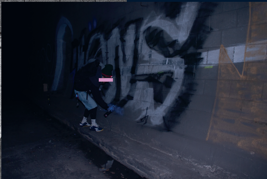
Praha – Braník/ listopad 2021 Praha – Vyšehrad/ srpen 2021 Praha – Braník/ listopad 2021