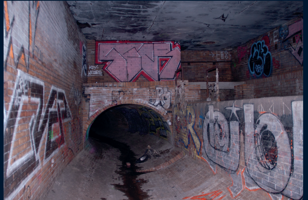
Praha – Žižkov/ říjen 2021 Praha – Vršovice/ březen 2022