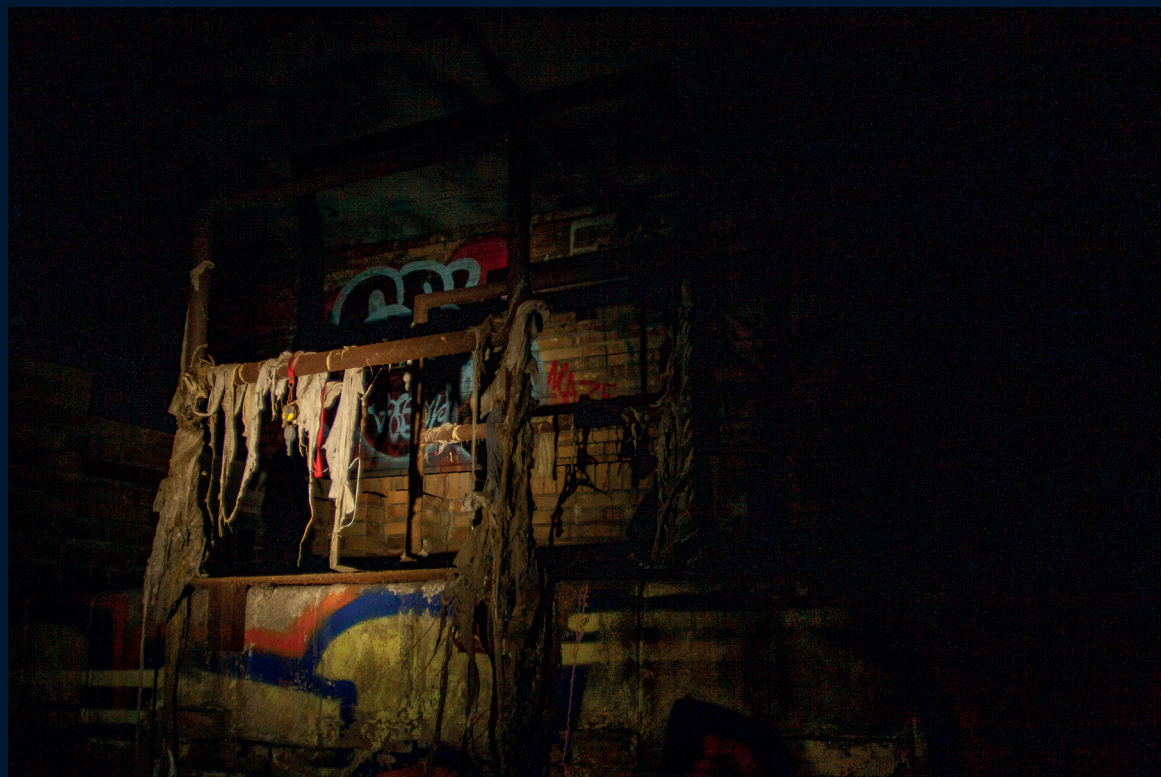
Praha – Vršovice/ březen 2022 Praha – Holešovice/ prosinec 2021