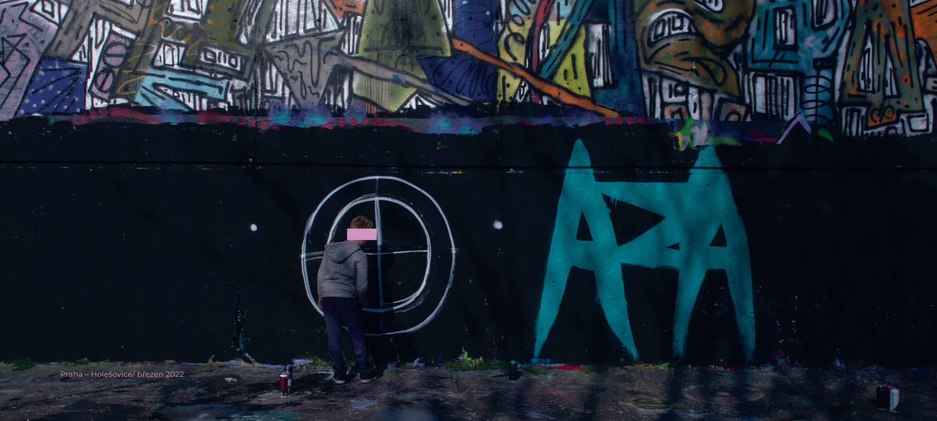
Praha – Holešovice/ březen 2022