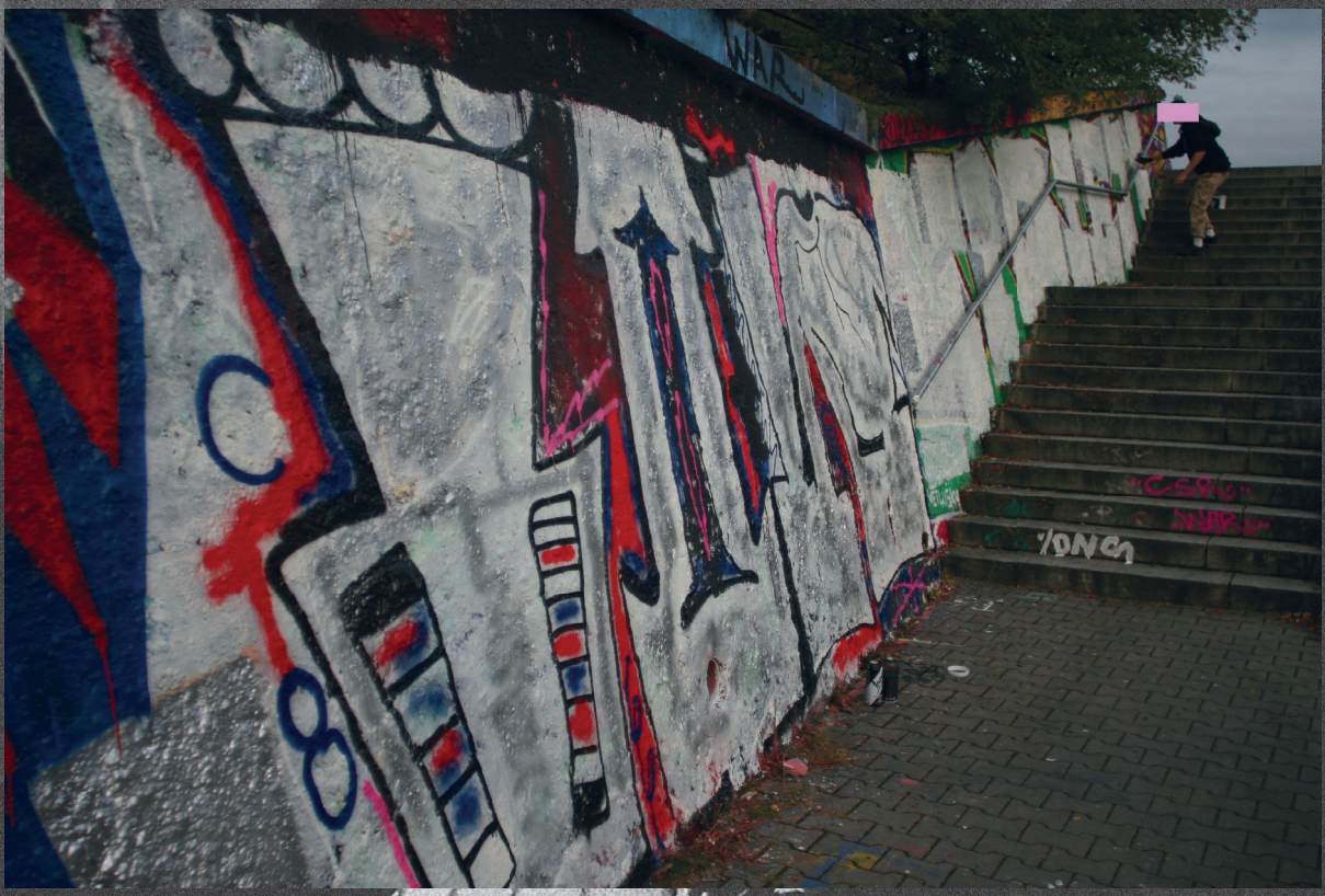
Praha – Černý Most/ červenec 2021 Praha – Žižkov/ říjen 2021