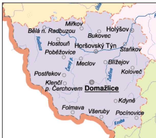
Obrázek 2: Plzeňský kraj – města 2