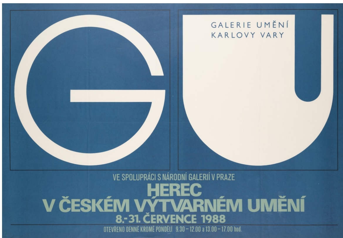
Obr. 12: Plakát k výstavě Herec v českém výtvarném umění.