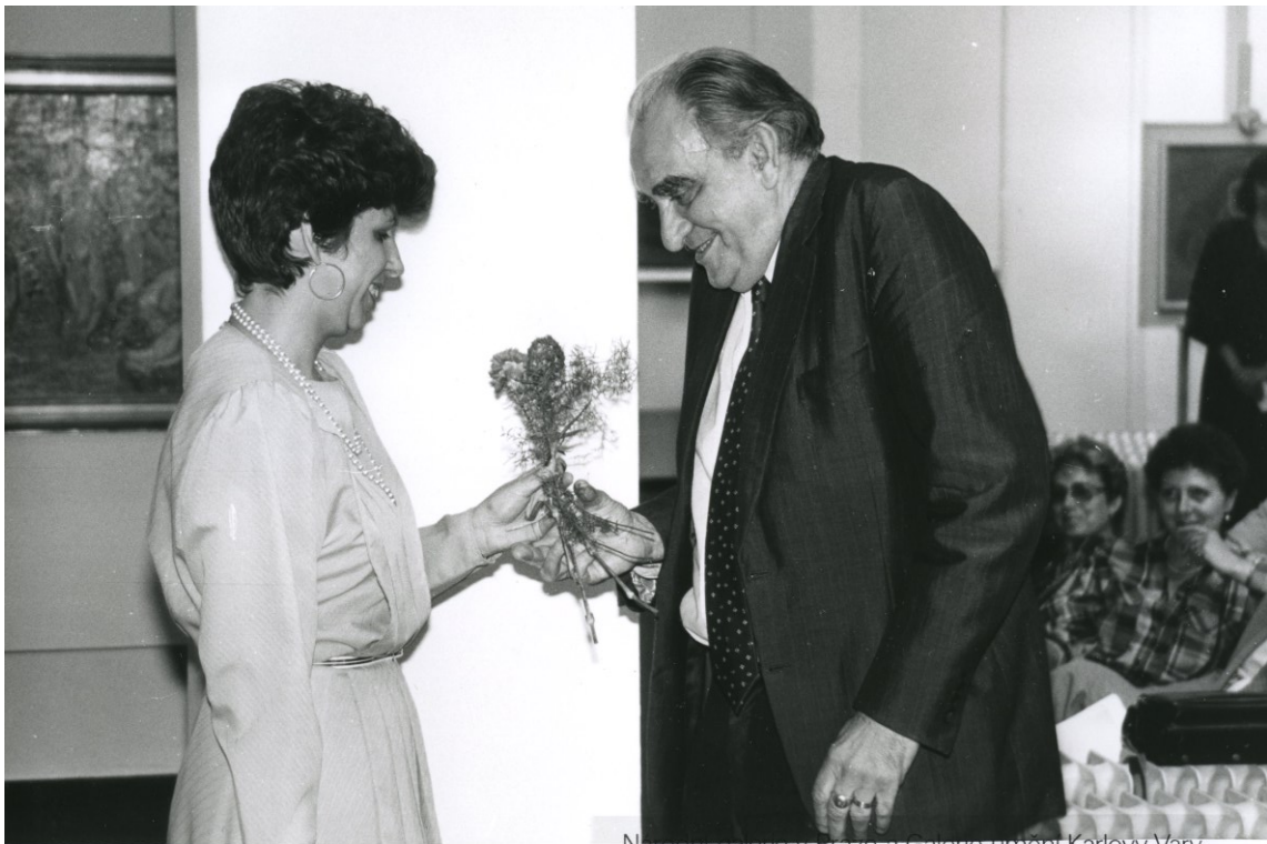
Národní galerie v Praze a Galerie umění Karlovy Vary