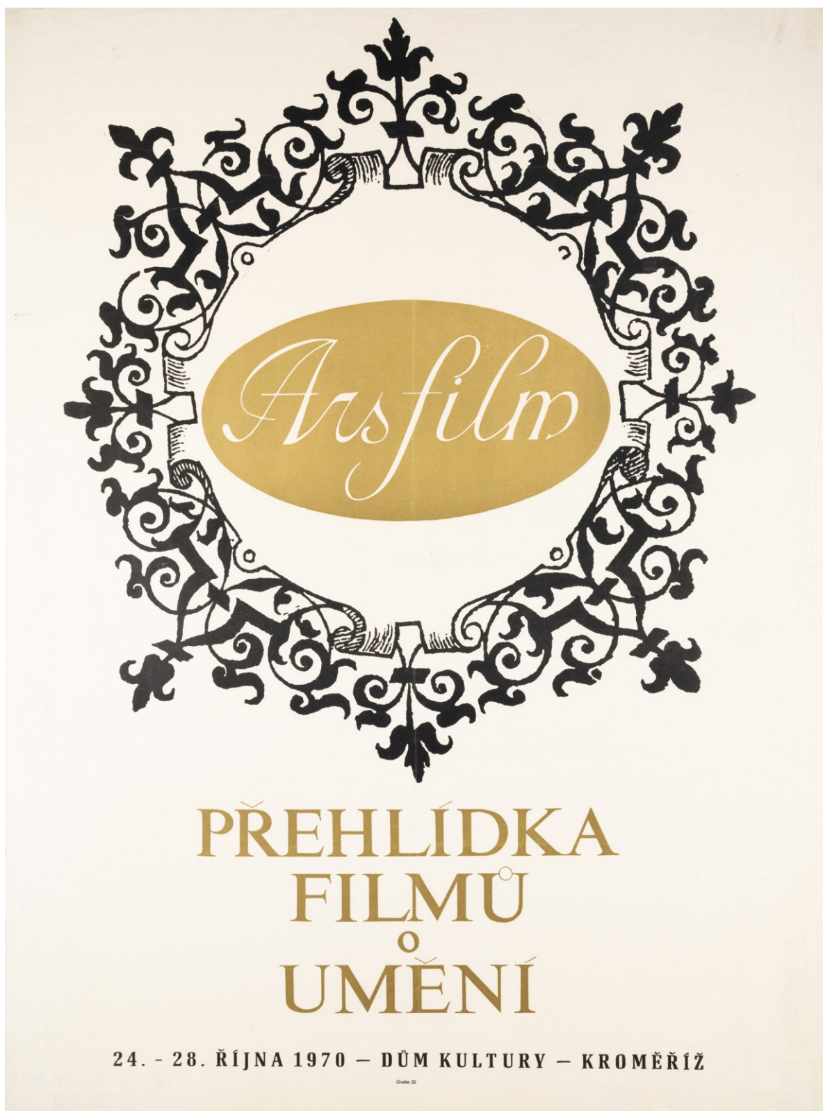
Obr. 2: Plakát festivalu Arsfilm Kroměříž, 1970.