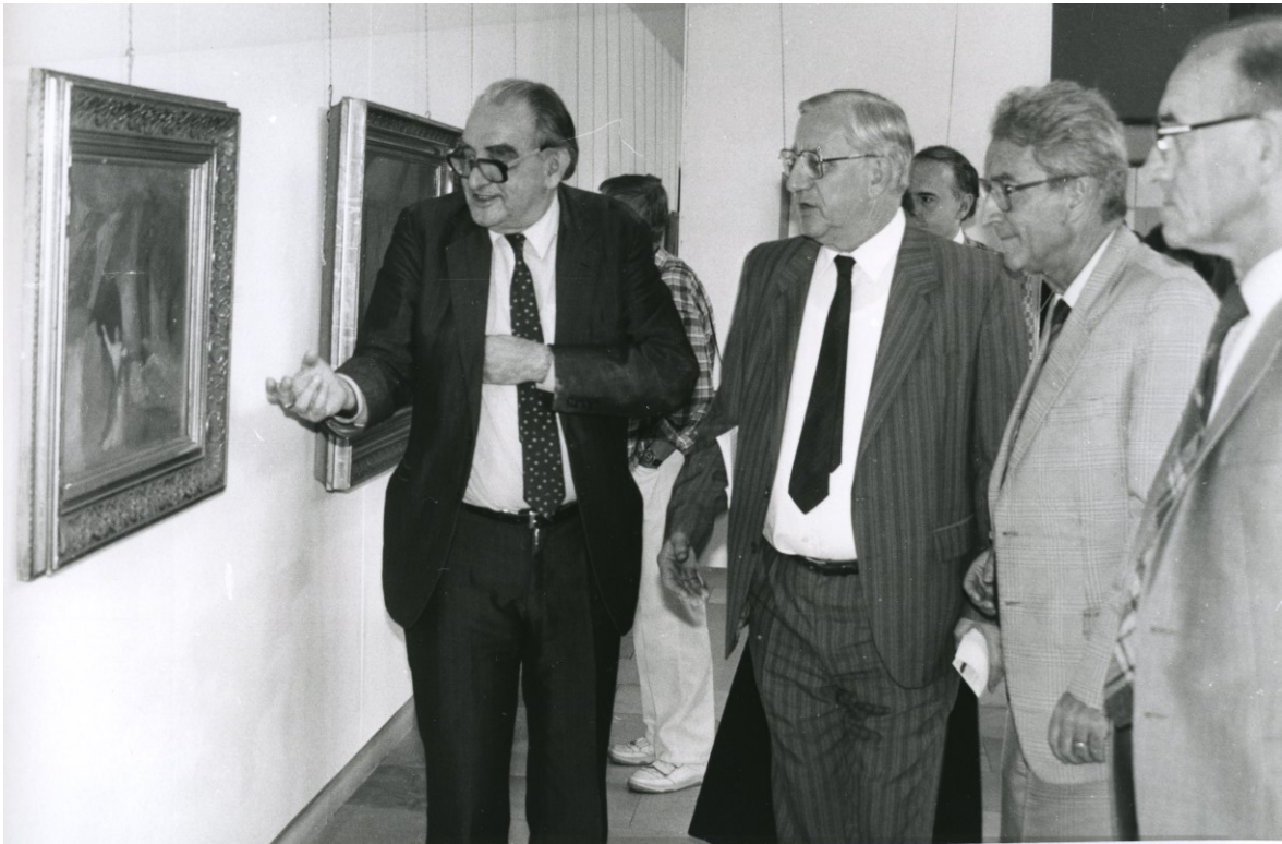
Národní galerie v Praze a Galerie umění Karlovy Vary