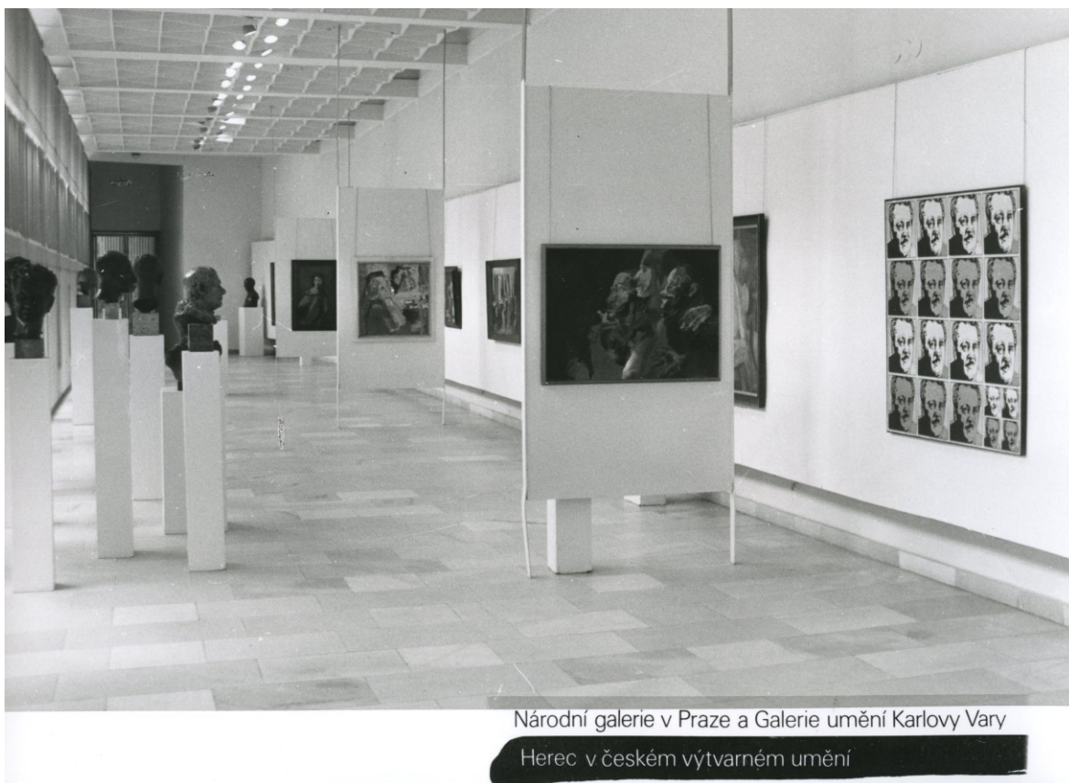
Obr. 8: Pohled do výstavy Herec v českém výtvarném umění.