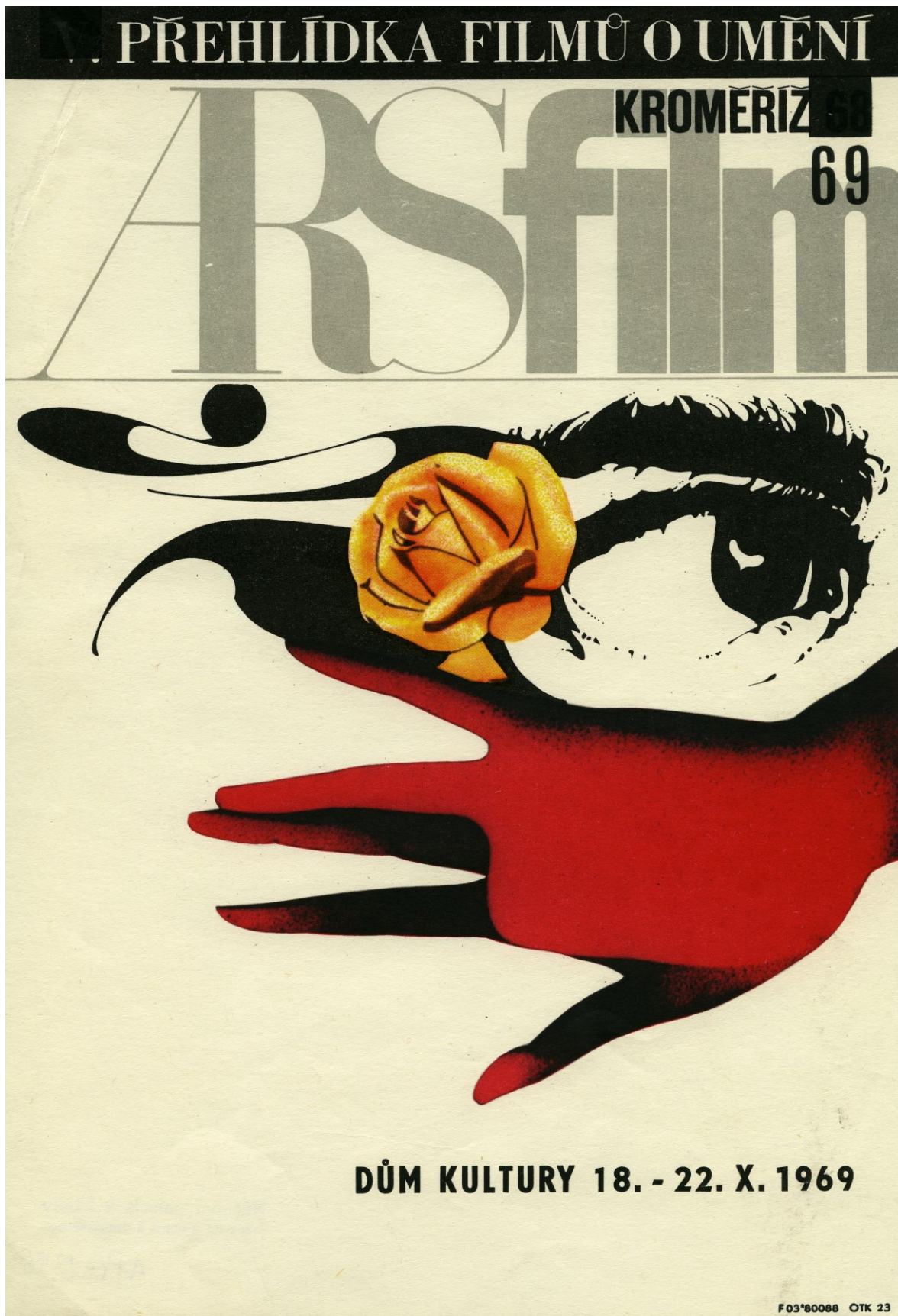
Obr. 1: Plakát festivalu Arsfilm Kroměříž, 1969.