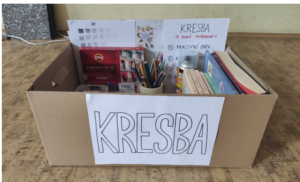
Obrázek 1: Centrum kresby

Na závěr, jakmile bylo celé centrum uspořádané a patřičně srovnané, jsem pořídila jeho fotografii, kterou jsem vytiskla a centrum jsem jí doplnila. Jejím účelem je napovědět dětem při budoucím úklidu, do jakého stavu mají všechny shromážděné materiály po dokončené práci zase navrátit.