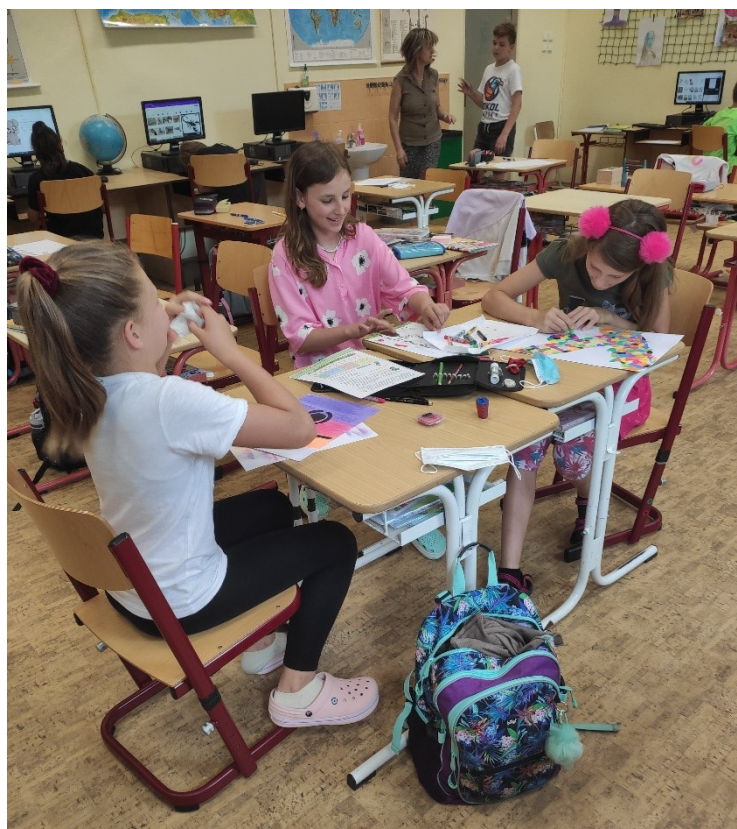
Obrázek 8: Samostatná tvorba

Jelikož už jsem si byla jistá bezproblémovostí závěrečného úklidu, nechala jsem děti samostatně pracovat až do poslední možné chvíle, abychom ještě stihli diskuzi.