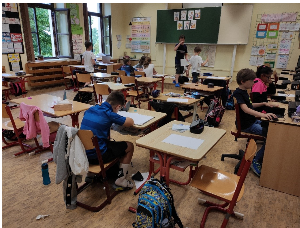
Obrázek 5: Samostatná tvorba

desky a přesunuly se s nimi k počítačům, kde si povětšinou vyhledaly chtěný obrázek a snažily se kreslit podle předlohy. Vzniklé uspořádání je patrné na obrázku 5.