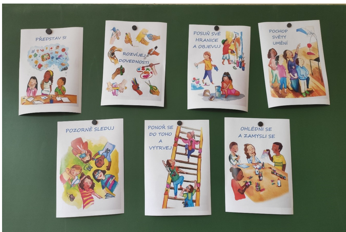
Obrázek 3: Studio Habits of Mind, ilustrace návyků z publikace Studio Thinking from the Start doplněné o překlad názvů

Žáci poté začali vyjmenovávat, čím vším musí dle jejich názoru umělec disponovat, od vlastních dovedností po nutné vybavení. Při této příležitosti jsem do hodiny zapojila Studio Habits of Mind, každý z návyků byl s dětmi prodiskutován a následně připevněn na tabuli v podobě ilustračního obrázku, které jsem si vypůjčila z publikace Studio Thinking from the Start (pro účel porozumění jsem si dovolila názvy návyků přeložit do češtiny).