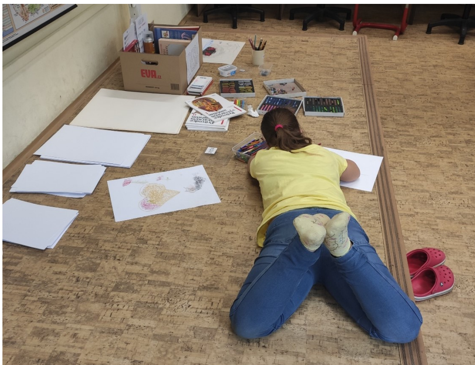
Obrázek 10: Samostatná tvorba

Druhým a pro mě nesmírně poučným úkazem byla práce žákyně s Downovým syndromem. Dívka od začátku projevovala své unikátní myšlení a přistupovala k tvorbě zcela odlišně než její spolužáci – jako pracovní plochu si zvolila stupínek, na kterém probíhalo úvodní demo, a obě hodiny strávila v různých polohách na zemi, obklopena pastelkami a svými výkresy. Jelikož nebyla svázána jednotným tématem, mohla rozvinout své vlastní nápady a tím byly částečně smazány rozdíly ve fyzických i kognitivních schopnostech. Její jedinečný přístup zaregistrovali i její spolužáci a při pochválení například barevnosti jejích obrázků jí při závěrečné diskuzi udělali upřímnou radost.