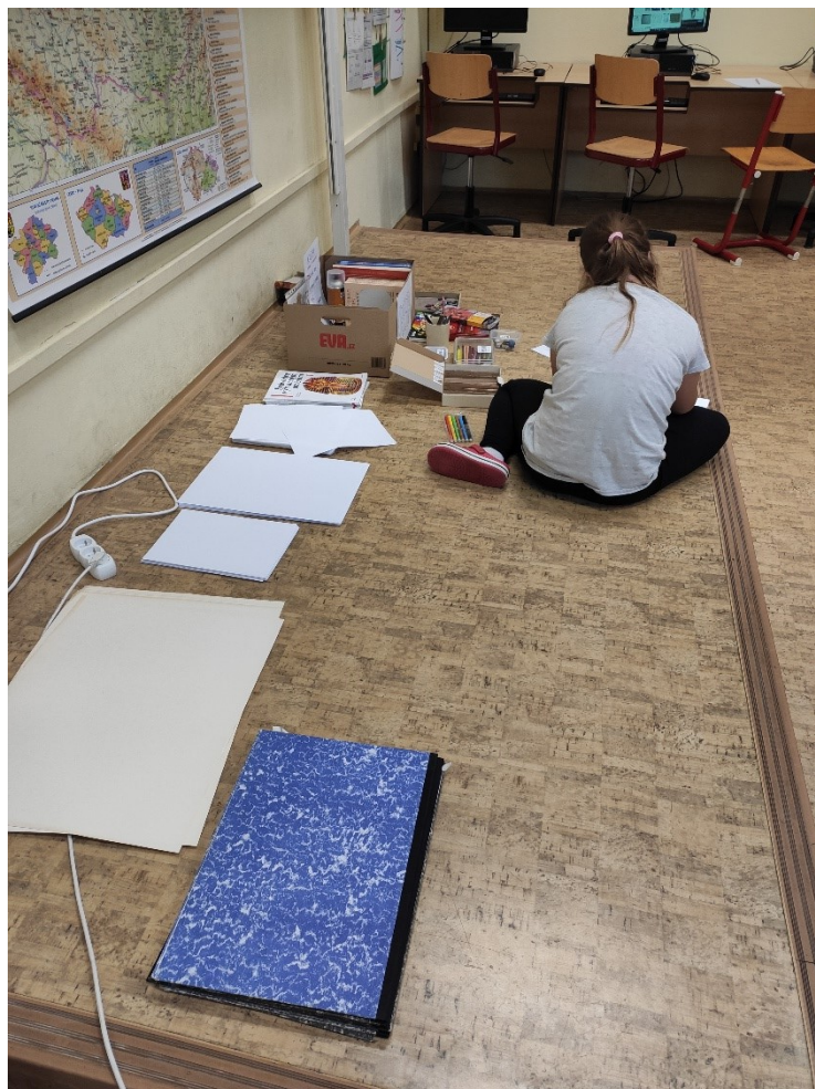
Obrázek 4: Demo area a centrum kresby

U tužek jsem stručně vysvětlila označení různých tvrdostí a na dvou papírech odlišných gramáží jsem dětem ukázala, jakým způsobem se mění jednoduchá stopa při použití jak rozdílných tvrdostí, tak i jiných podkladů. U pastelů byla demonstrována práce s jedním odstínem i smíchání vícero barev. Další položkou byly pastely – suché, olejové a giascondy – u kterých jsem poukázala pouze na rozdílnou stopu, a co se týče suchých, i na specifika práce s nimi. Následovala ořezávátka a gumy, u nichž bylo upozorněno na druhy (plastické a pevné) a jejich použití, především pak na nutnost udržovat je v čistotě.