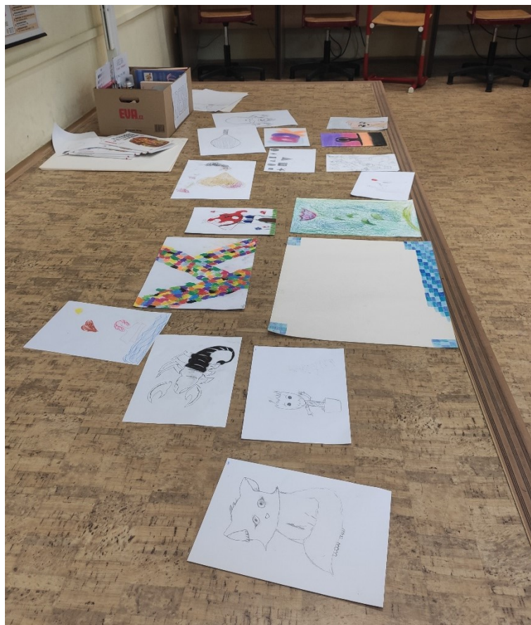
Obrázek 9: Závěr hodiny