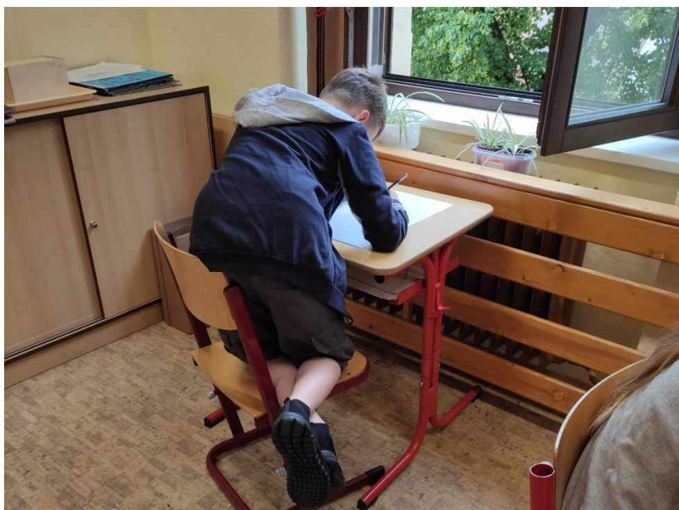
Obrázek 7: Samostatná tvorba

Po ukončení dema padlo několik doplňujících dotazů, mezi nimi například jestli se tužka dá rozmazávat, a po jejich zodpovězení se přistoupilo k samostatné tvorbě.