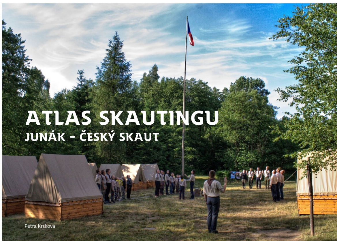
Obr. 4 – Obálka Tematického atlasu skautingu

Z důvodu barevného zaplnění stránky až do jejího okraje u obálky a prvních stránek kapitol byl nutný tisk na spad. Atlas byl tedy vytištěn na velkoformátový papír, svázan sešitovou měkkou vazbou V1 a ořezán na rozměr A4 na šířku.