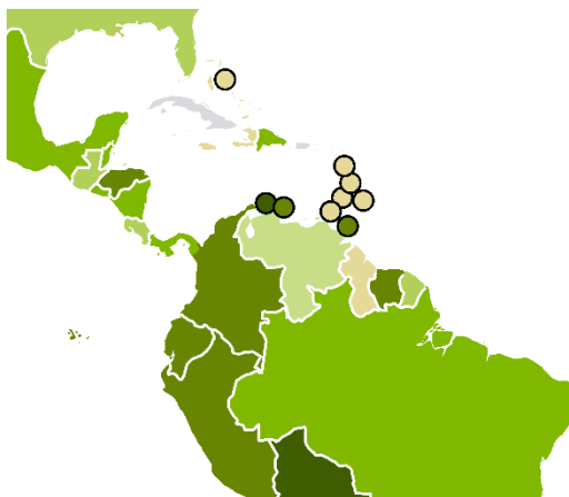
Obr. 1 – Příklad zobrazení malých ostrovních států

vybrány a byla z nich vytvořena nová bodová vrstva malých států WOSM ( Malé_státy_WOSM ). Příklad zobrazení malých ostrovních států v Karibském moři na jedné z map je na obrázku 1.