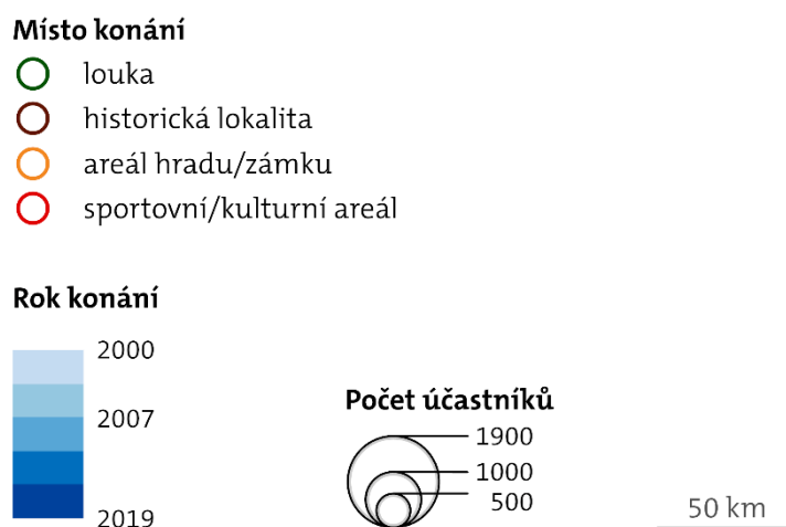
Obr. 2 – Příklad legendy a měřítka z Tematického atlasu skautingu

Pro všechny mapy byla stanovena velikost hlavního mapového pole 257 \times 180 mm vycházející z formátu stránky atlasu. Každá mapa byla doplněna odpovídající legendou, pro kterou byl použit skautský font písma TheMix C5 ve variantě Bold a Semilight. Každá mapa také obsahuje jednoduché grafické měřítko, které je společně s ukázkou legendy jedné mapy zobrazeno na obrázku 2.