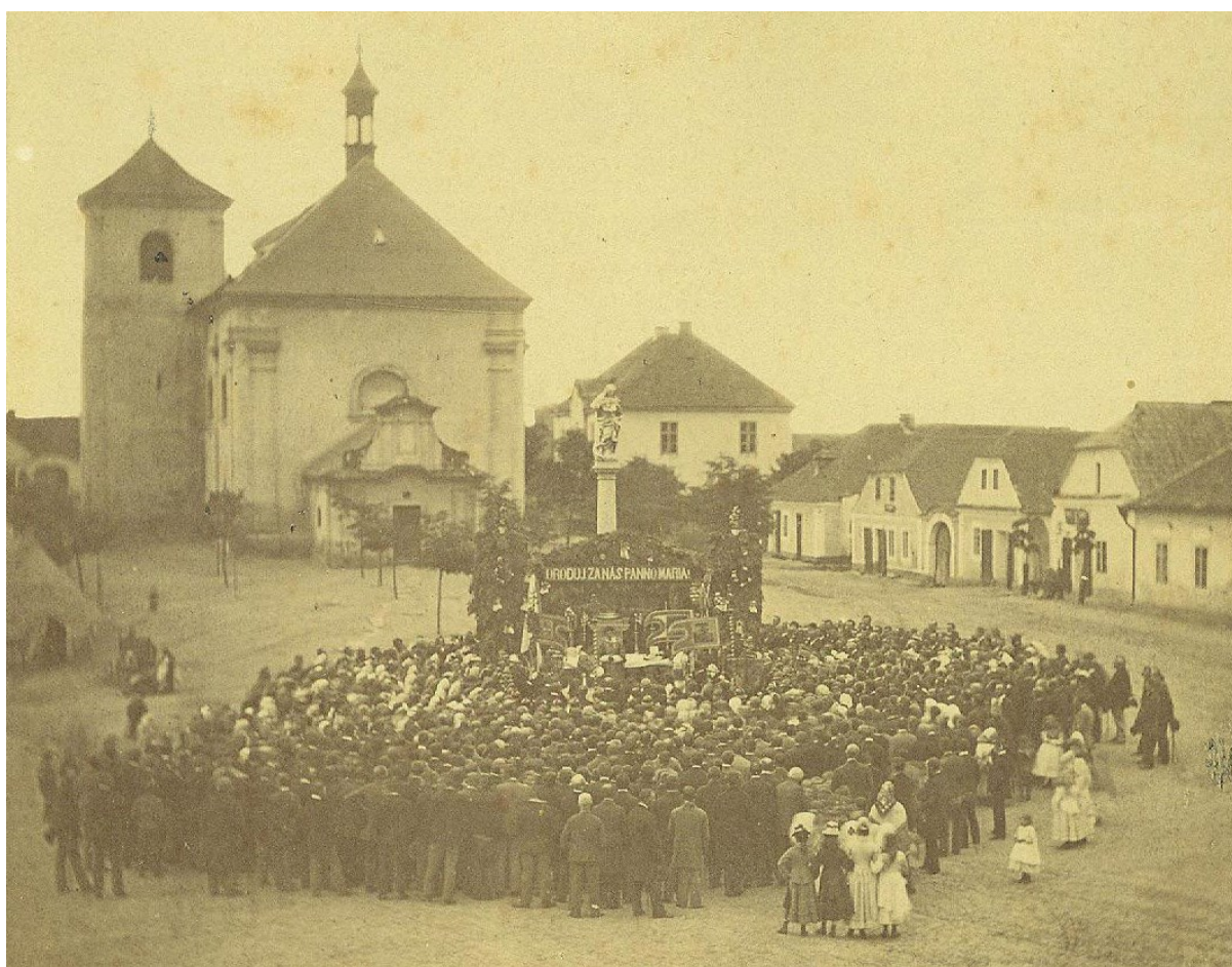
Obr. č. 2 – rodný Hotowetzův dům 171