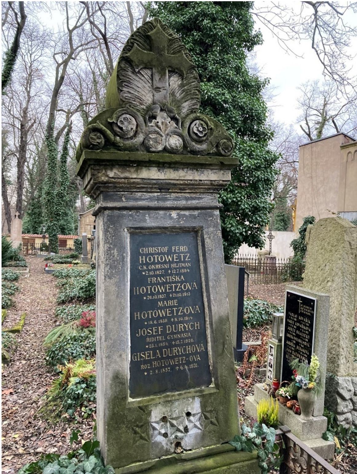
Obr. č. 3 – hrob Hotowetzových na pražských Olšanech 172