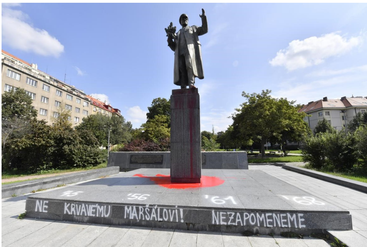
Obrázek 1: Vandalizovaný pomník maršála Koněva na náměstí Interbrigády v Praze, 1. října 2019. Dostupné z: https://ct24.ceskatelevize.cz/sites/default/files/styles/node-article_horizontal/public/images/2353469-p201908220422401_0.jpeg?itok=Bwye8VxY. [citováno 20.05.2022]

Záměrem této podkapitoly bylo naznačit komplexní dynamiku mezi pamětí, dějinami a kulturou, a zároveň upřesnit metodologický aparát této práce. Paměťová studia v posledních desetiletích historikům poskytují při snaze o nahlédnutí studovaného problému v širší sociokulturní perspektivě svou interdisciplinarní účinný badatelský nástroj. Paměť jako předmět analýzy disciplíny memory studies nepředstavuje jen sumu všech existujících reprezentací minulosti, ale komunikační kód, který umožňuje vyjádření příslušnosti ke společnosti/skupině, jíž je jedinec členem. Jako vektor, který paměť uchovává a přenáší, působí kulturní produkce konkrétní skupiny. Kulturní médium se svou formou na podobě vzpomínky, již zprostředkovává, aktivně podílí a je od výsledné vzpomínky neodlučitelné, což znamená, že při analýze pomníku nelze brát v potaz jen samotnou událost nebo osobu, ke které se vztahuje, ale rovněž jeho podobu, umístění, osobu autora a zadavatele nebo formu zpracování. Jak je patrné i z podkapitoly „Umělecké dílo, architektonický objekt nebo historický pramen? Rekonceptualizace pomníku na pomezí tří diskurzů“, pomník a paměťové