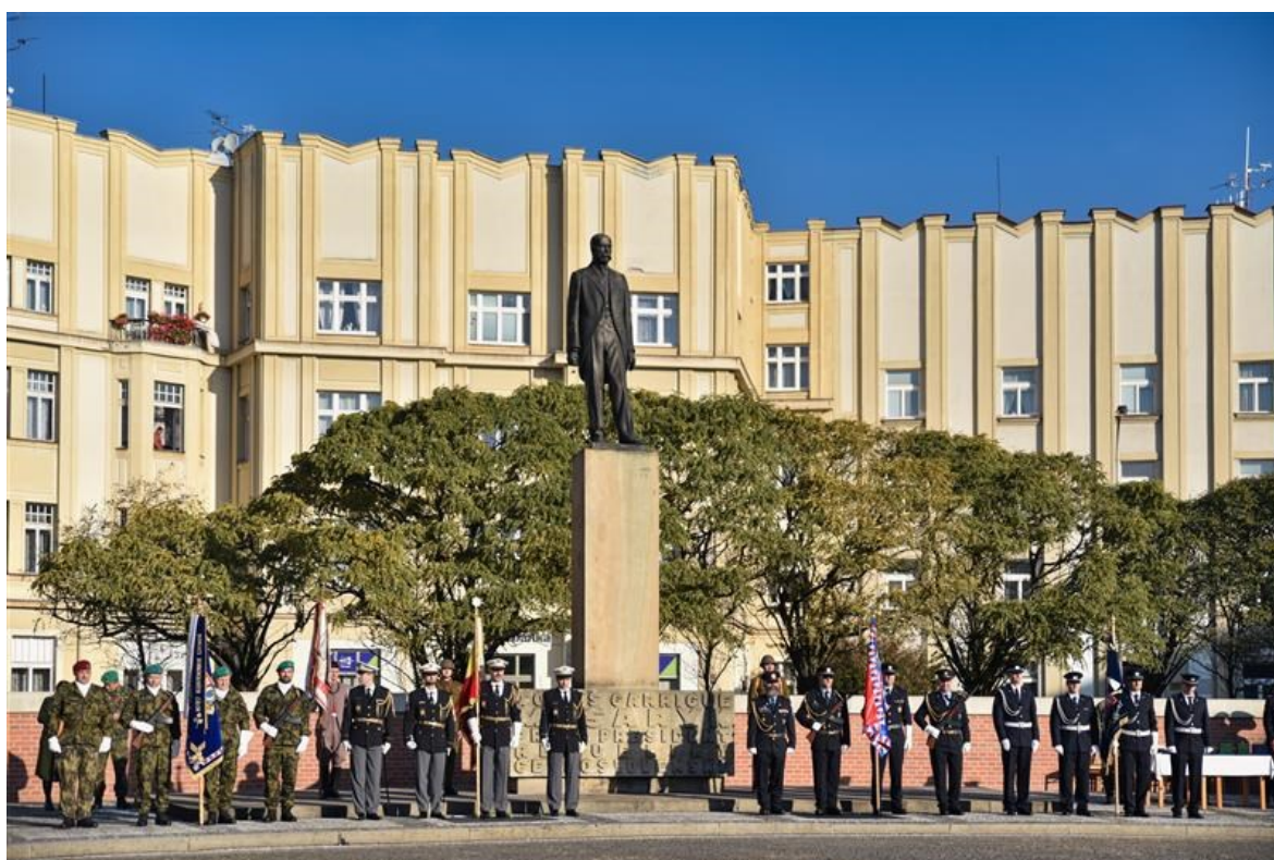
Obrázek 12: Oslavy dne vzniku samostatného československého státu v Hradci Králové, 28. října 2021, Hradec Králové. Dostupné z: https://www.hradeckralove.org/video-oslavy-28-rijna-v-hradci-kralove/d-77062. [citováno 05.05.2022]

prosperující [první Československá republika, pozn. autora] republika“ 229 ). Grandiozita, se kterou je Masaryk v rámci hradeckého aktu připomínán, je podpořena i výrazovými prostředky pomníku. Vzpomínající nejprve vidí sochu Masarykova charakteristického obličeje s ostrými rysy. Postavení sochy v postoji s pokrčenými nohama a rukama podél těla ve spojení s formálními šaty naznačuje váženost, plastika zobrazuje Masaryka jako státníka. Popisná plaketa spolu s prostorovou koncepcí monumentu vybízí diváka mimo jiné i „vynuceným“ pohledem nahoru k recepci pomníku ze subordinované pozice.