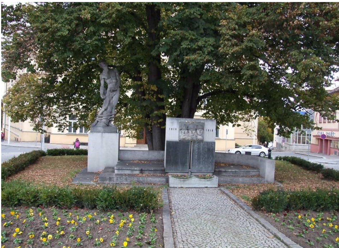
Obrázek 9: Pomník národního osvobození, 21. října 2016, Křížíkovo náměstí v Táboře