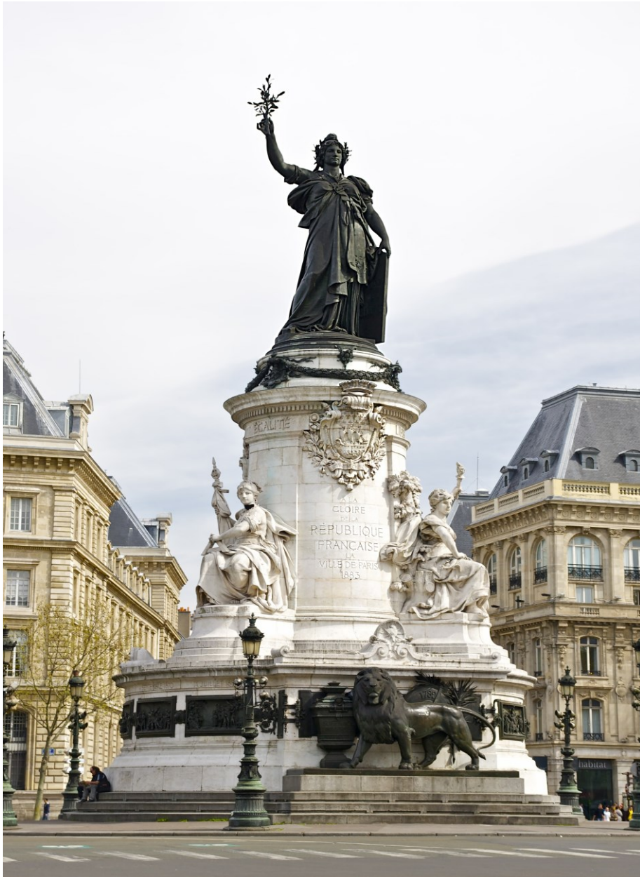
Obrázek 2: Monument à la République, náměstí Republiky, Paříž.

restaurace objektu připomínajícího paměťové znaky spjaté s „němectvím“ a „dobou temna“ stejnou odezvou ve městě regionálního významu na historicky „méně exponovaném“ náměstí? Nejspíš ne. V rámci kolektivní imaginace určité skupiny totiž percepce „centrality“ prostoru pochopitelně ovlivňuje, jak je prostor vnímán, a v důsledku i to, jaké jeho využití je pokládáno za (ne)žádoucí.