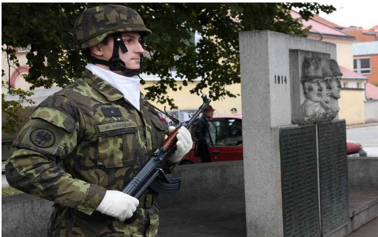
Obrázek 11: Uctili památku, 28. října 2009, Křížíkovo náměstí, Tábor, Tábořský deník. Dostupné z: https://taborsky.denik.cz/galerie/ta_vznik_statu.html?photo=7&back=1996254337-2334-52. [citováno 20.05.2022]