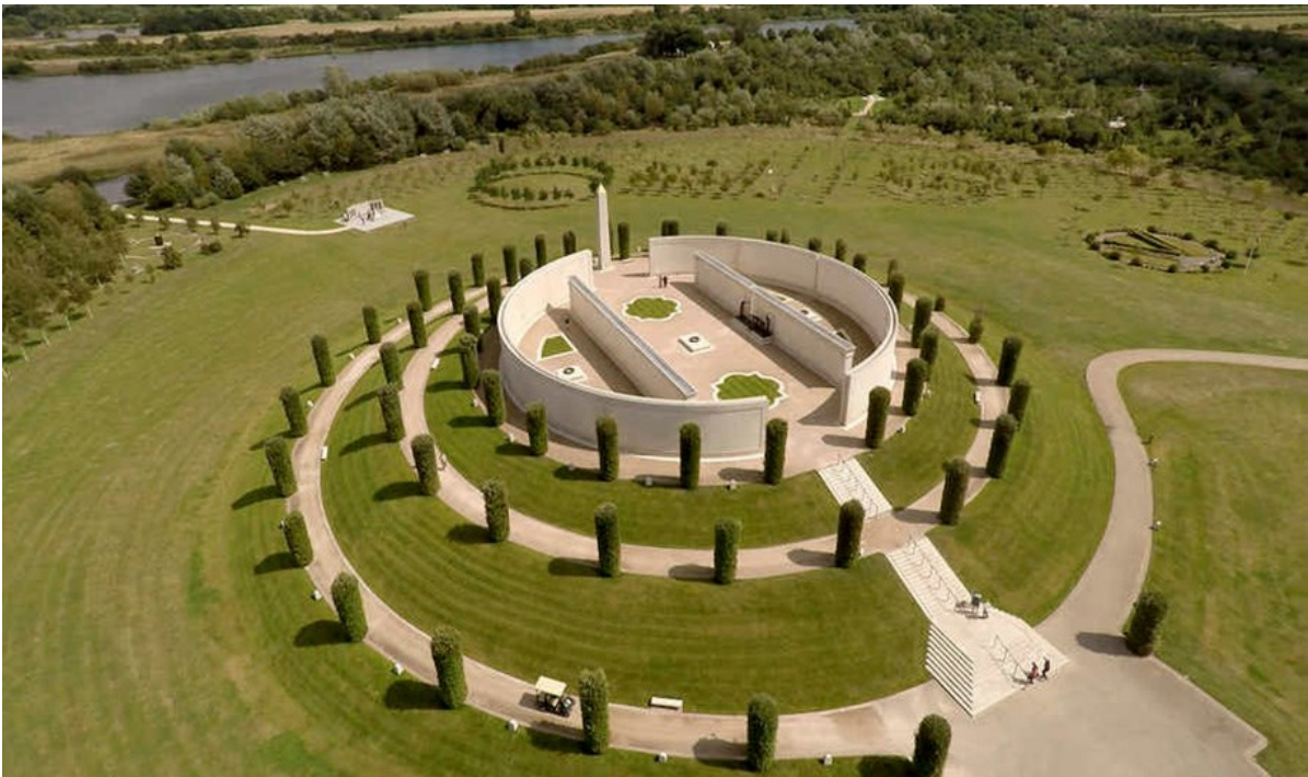
Obrázek 4: Národní památkové Arboretum [ National Memorial Arboretum ], Croxall, Staffordshire. Dostupné z: https://letsgowiththechildren.co.uk/wp-content/uploads/2016/12/The-National-Memorial-Arboretum-1-915px.jpg . [citováno 05.05.2022]