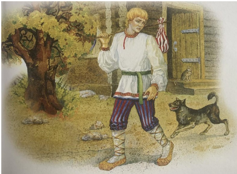
Obrázek 4 - Как Иван ушёл в мир (Летучий корабль)

Jiným příběhem, ve kterém vystupuje Ivan, je pohádka Летучий корабль (Karnauchova, 1984, s. 71-79).