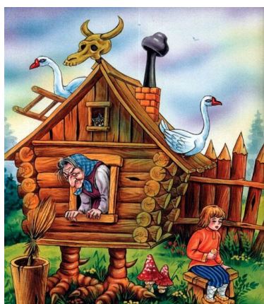
Obrázek 13 - Баба Яга и гуси (Гуси-Лебеди)

V pohádce Гуси-Лебеди (Круглов, 1992б, s. 259-260) vystupuje Baba Yaga jednoznačně jako postava záporná. Jednoho dne rodiče odjeli do práce a nechali své dvě děti doma samotné.