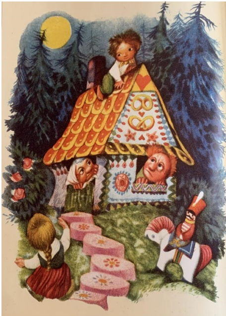
Obrázek 10 - Perníková chaloupka (O perníkové chaloupce)

Příběh, ve kterém vystupuje zlá ježibaba, nese název O perníkové chaloupce (Němcová, 2004, s. 224-230). Variant této pohádky existuje opravdu nespočet – v některé pohádce děti matku neměly, v některé měly macechu, v jiné pohádce děti bábě a dědkovi utekly, v jiné verzi je čarodějnice chytla a vykrmovala. K této analýze byla vybrána verze od B. Němcové.