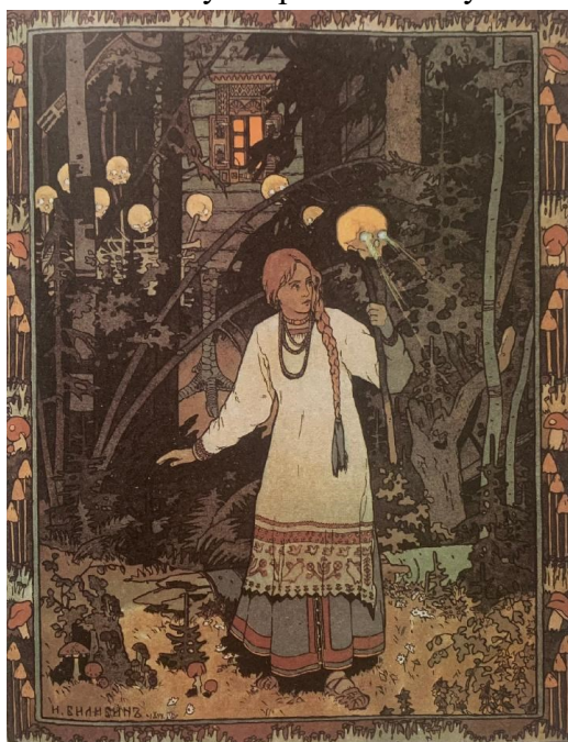
Обр́азек 16 - Василиса Прекрасная (Сказка о Василисе Прекрасной)