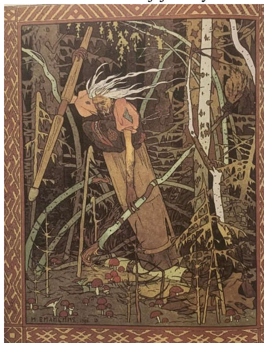
Обр́азек 15 - Баба Яга (Сказка о Василисе Прекрасной)

krásu Vasilise a dělaly jí různé naschvály. Ta musela vždy dělat tu nejtěžší práci. Jednoho dne macešiny dcery vyhnaly Vasilisu za Babou Jagou, aby přinesla světlo. Vasilisa si na cestu vzala panenku, kterou jí tehdy matka věnovala a vyšla na zdlouhavou cestu za Babou Jagou. Baba Jaga jí slíbila, že jí vyhoví jen tehdy, pokud Vasilisa splní všechny úkoly, které od Baby Jagy dostane, a pokud tak neučiní, Baba Jaga Vasilisu sní. Vasilisa díky panenčině pomoci dokázala všechny úkoly splnit a od Baby Jagy dostala kůl se svítící lebkou. Vasilisa začala bydlet u stařenky, u které utkala nádherné plátно. Stařenka vzala plátно a odnesla ho carovi. Car s nadšením plátно přijal a požadoval, aby dívka, která utkala tak nádherné plátно, k carovi přišla a vzala si ho za muže.