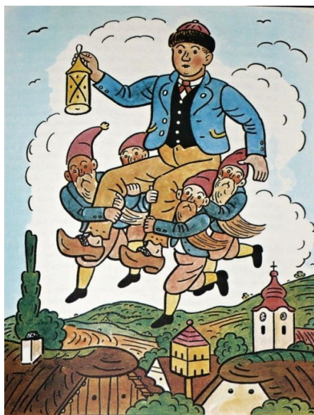
Obrázek 3 - Létající Honza (Jan a duchové v zakletém zámku)

krásný dům a měl vše, na co si jen pomyslel. Žena ho však nemilovala. Jednoho dne mu ukradla kouzelné hodinky a utekla zpět do svého domu. Jan byl smutný, ale společně se svými přáteli hodinky získal zpět.