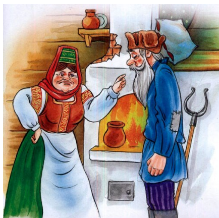
Obrázek 20 - Муж и жена (Морозко)

Ruská lidová pohádka Морозко (Nečajev, Rybakova, 1956, s. 267-269) vypráví příběh o otci, který byl podruhé ženatý. Měl krásnou a milou dceru, naopak jeho nová žena měla dceru ošklivou a zlou. Otcova dcera byla velmi pracovitá, všichni ji měli velmi rádi, kromě její