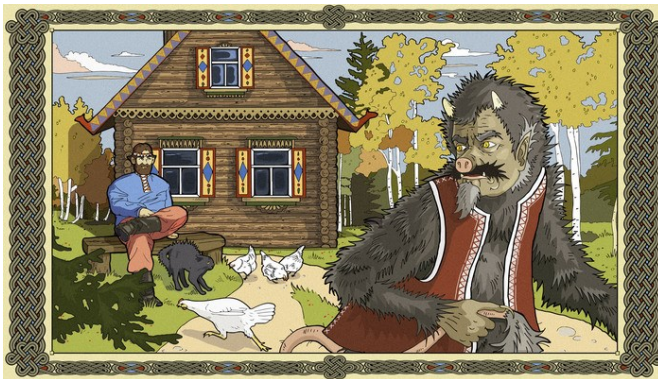
Obrázek 19 - Чёрт и муж (Чёрт-заимодавец)

Чёрт-заимодавец (Круглов, 19926, s. 399–400) vypráví o tom, jak muž přelstil čerta. Jednoho dne se muž rozhodl požádat čerta o peníze. Čert muži vyhověl a peníze mu půjčil. Každý den si čert pro mužův dluh chodil, avšak nikdy se nedočkal. « На третий день идет к нему и видит на воротах другую