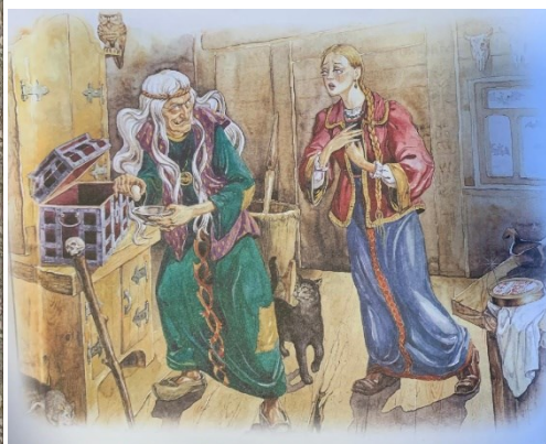
Obrázek 12 - Баба Яга и Марюшка (Финист – Ясный сокол)

s dobrým srdcem. Jednoho dne jel otec do města a zeptal se dcer, co chtějí z města přivést. Starší dcery žádaly velké dary, ale nejmladší dcera