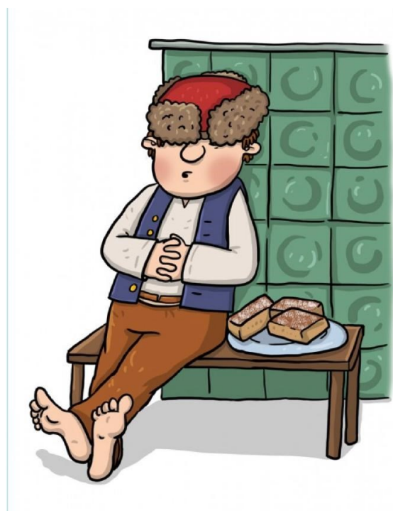
Obrázek 1- Líný Honza u pece (O hloupém Honzovi)

K rozboru této postavy je vybrána pohádka ze sbírky B. Němcové – O hloupém Honzovi (Němcová, 2004, s. 200-208). Pohádka vypráví o vesnickém chlapci, jež svůj čas tráví poleháváním na peci. Jednoho dne se jeho otec rozhodl, že chlapce pošle do kostela. V kostele se Honzovi tuze nelíbilo, nechápal, proč tam lidé tráví svůj čas, a tak otec pochopil, že tímto způsobem Honzu k lepšímu životu nepřivede. Rozhodl se, že Honzu pošle za muzikou, ale ani tím neuspěl. Honza se na otcův příkaz vydal do světa, aby se naučil slušným mravům. Honza se stal sluhou, který dělal neustále neplechu a po čase se vrátil opět domů. Honzův otec byl celý nešťastný, že nedokázal svého syna naučit