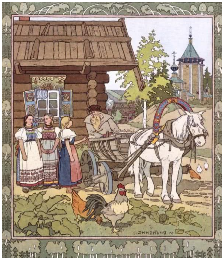
Obrázek 11 - Отец и дочери (Финист-Ясный сокол)

Z ruské kultury byla vybrána pohádka Финист — Ясный сокол (Nečajev, Rybakova, 1956, s. 133-138). Pohádka vypráví o vesnickém chalupníkově, který měl tři dcery – dvě pyšné a jednu velmi skromnou