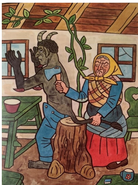
Obrázek 18 - Plajznerka a Trepifajksl (Zapomenutý čert)

Zapomenutý čert (Drda, 1985, s. 60-82) vypráví příběh o čertovi Trepifajkslovi, který žil ve vesnici Dalskabáty v jedné chaloupce, ve které strašil lidi. V chaloupce Trepifajksl začal žít sám, avšak stýskalo se mu po pekle. Jednoho dne přišla do chaloupky žena Plajznerová, která se čerta ani trochu nebála a změnila mu celý život – usekla mu ocas, oblékla ho do slušného oblečení, přejmenovala ho na Matese a naprosto změnila jeho čertovské chování v chování lidské. Z čerta se tak stala velmi kladná postava. Začal pracovat u kováře a získal mnoho přátel. Jednoho dne pro Trepifajksla přišel jiný čert a odvedl ho do pekla. Jakmile v pekle zjistili, že Trepifajksl nejeví skoro žádné čertovské znaky, byl z pekla navždy vyhoštěn. Mates následně žil velmi šťastný život se ženou Plajznerovou a svými přáteli.