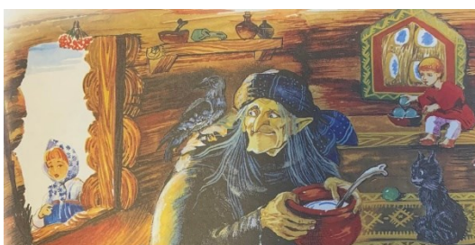
Obrázek 14 - Баба Яга в даче (Гуси-Лебеди)

V pohádce Гуси-Лебеди (Круглов, 1992б, s. 259-260) vystupuje Baba Yaga jednoznačně jako postava záporná. Jednoho dne rodiče odjeli do práce a nechali své dvě děti doma samotné.