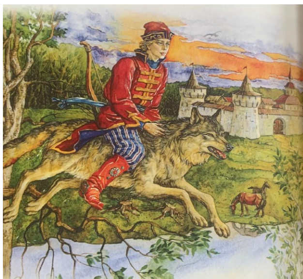
Образек 8 - Иван царевич на волке (Иван Царевич и Серый волк)