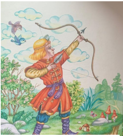
Obrázek 6 - Иван и лук (Царевна-лягушка)