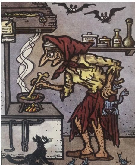
Obrázek 9 - Čarodějnice míchající lektvar (Čarodějnice)

V pohádce O labuti (Němcová, 2004, s. 37–46) vystupuje král, jenž má velmi hodného