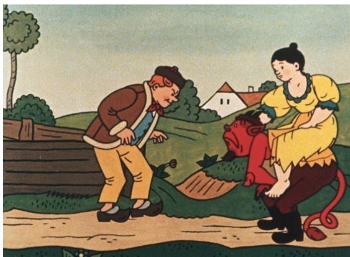
Obrázek 17 - Setkání s ovčákem (Čert a Káča)

Známa česká lidová pohádka Čert a Káča (Němcová, 2004, s. 47-51) vypráví příběh o zlé a ošklivé dívce Káče, která si tuze přála tančit s nějakým mládencem: „Dnes bych si