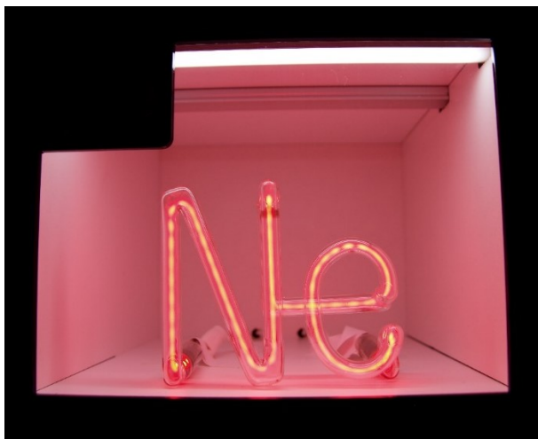
Obrázek 1: Výboj v neonu

uvedené výše. Cvičení c se zaměřuje na dvě témata a těmi jsou názvy skupiny a obecné využití jednotlivých prvků, obě témata jsme již také zmiňovali výše. Navíc žáci mohou během samotné exkurze vidět výboj ve vzorcích plynů viz Obrázek 1. Všechna tři cvičení rozvíjí kognitivní proces vybavování v Bloomově taxonomii 29 . Řešení cvičení a jsou halogeny a alkalické kovy, díky tomu, že mají nejbližší elektronovou konfiguraci vzácných plynů, tedy stabilní konfiguraci, které se snaží dosáhnout, jsou tyto prvky nejreaktivnější. K dosažení stabilní elektronové konfigurace halogeny jeden elektron přijímají, proto mají nejvyšší elektronovou afinitu (energie uvolněná při přijetí elektronu) v rámci periody. Alkalické kovy jeden elektron poskytují, tedy mají nejnižší ionizační energii (energie potřebná pro odštěpení elektronu) v rámci periody (viz také příloha č. 2).