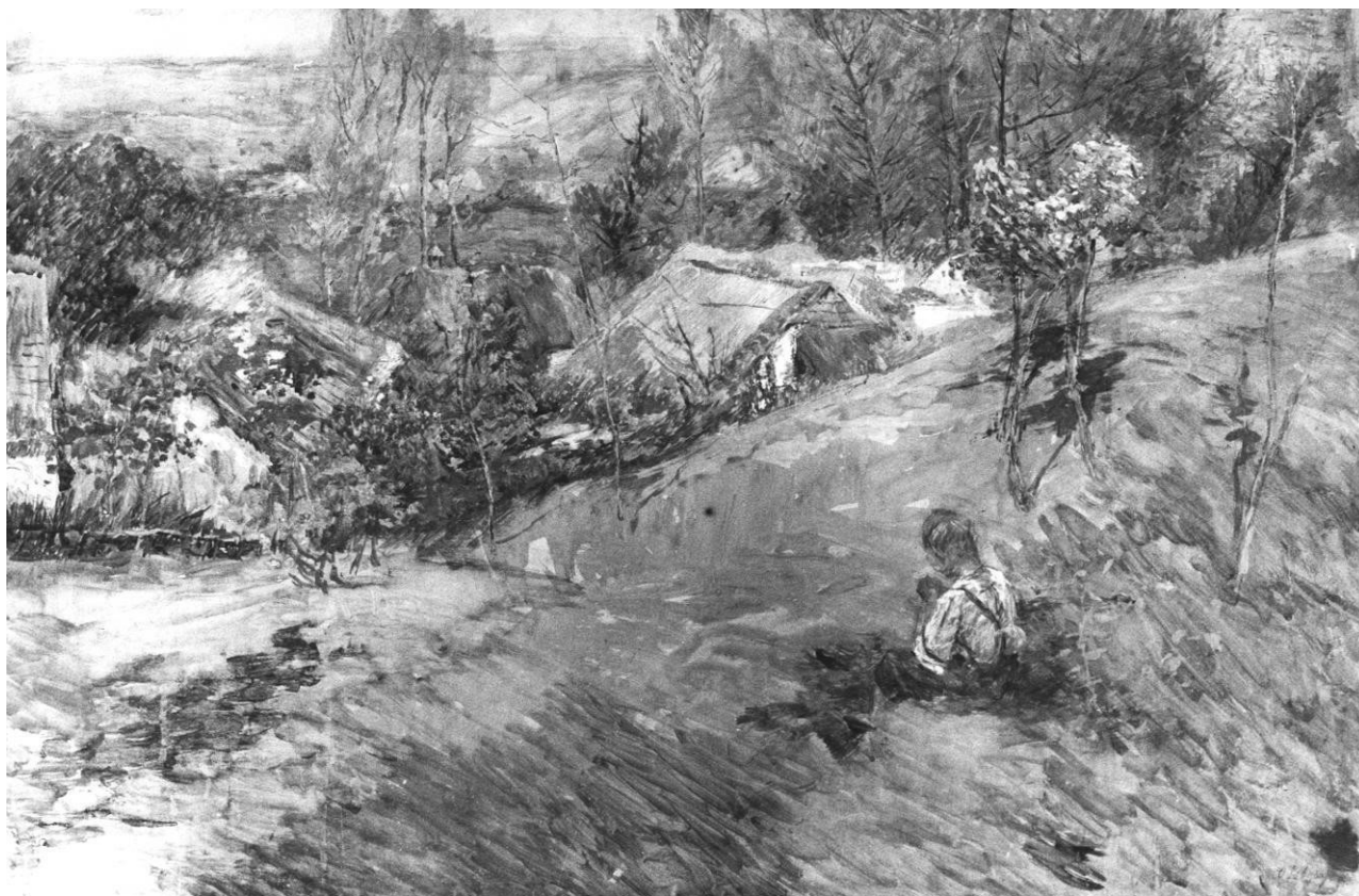
18. Otakar Lebeda: Krajina s červenými střechami, 1899, syntonos, karton, 71 x 105,8 cm, Národní galerie v Praze