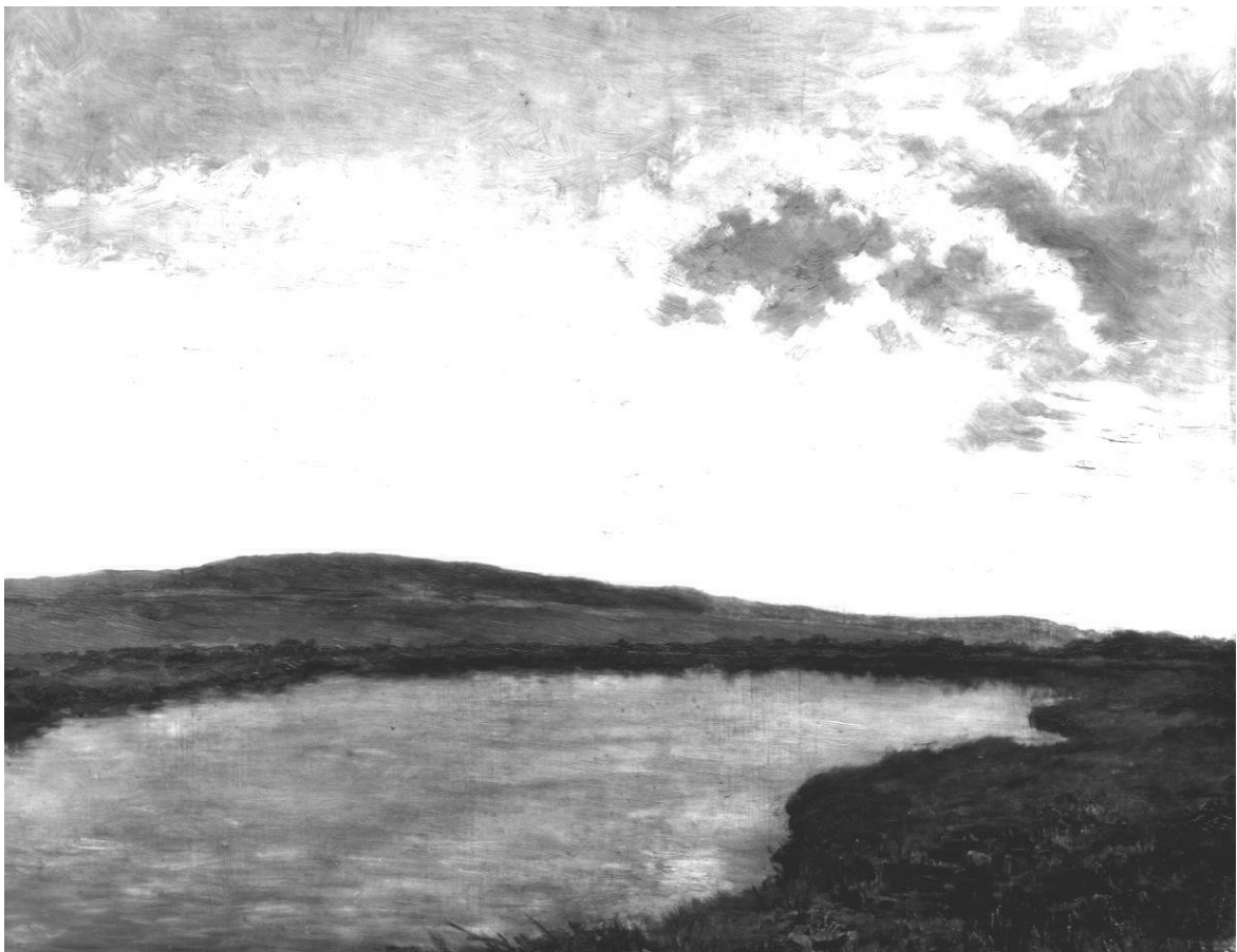
13. Otakar Lebeda: Rybník Tisy u Třeboně, (1897), olej, karton na překližce, 50 x 66 cm, Národní galerie v Praze