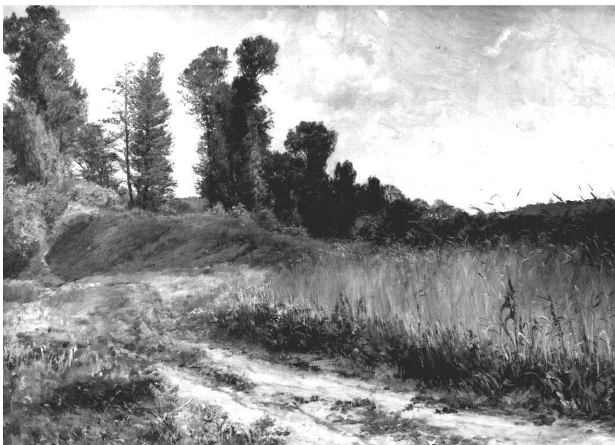
5. Otakar Lebeda: Krajina z Okoře, 1896, olej, plátno, 69,5 x 99 cm, Národní galerie v Praze