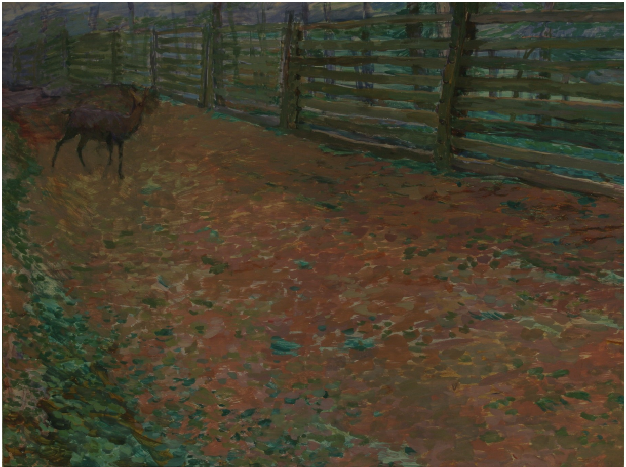
20. Otakar Lebeda: Bechyňská obora II. (Ohrada), (1899), syntonos, karton, 48,5 x 63 cm, Oblastní galerie v Liberci