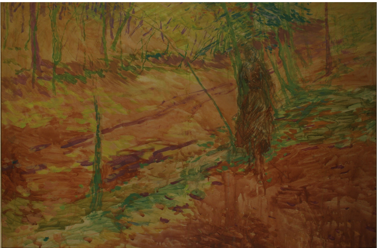
21. Otakar Lebeda: Studie podzimní krajiny, (1899), tempera, karton, 71,5 x 106 cm, Oblastní galerie v Liberci