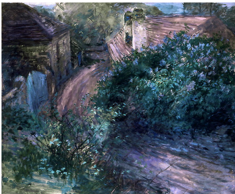
17. Otakar Lebeda: Šeřík (Rozkvetlý keř, Cesta vesnicí), (1899), syntonos, karton, 65,5 x 78,5 cm, Národní galerie v Praze