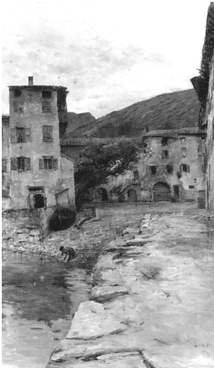
9. Otakar Lebeda: Torbole, 1896, olej, plátno, 80 x 48 cm, Národní galerie v Praze