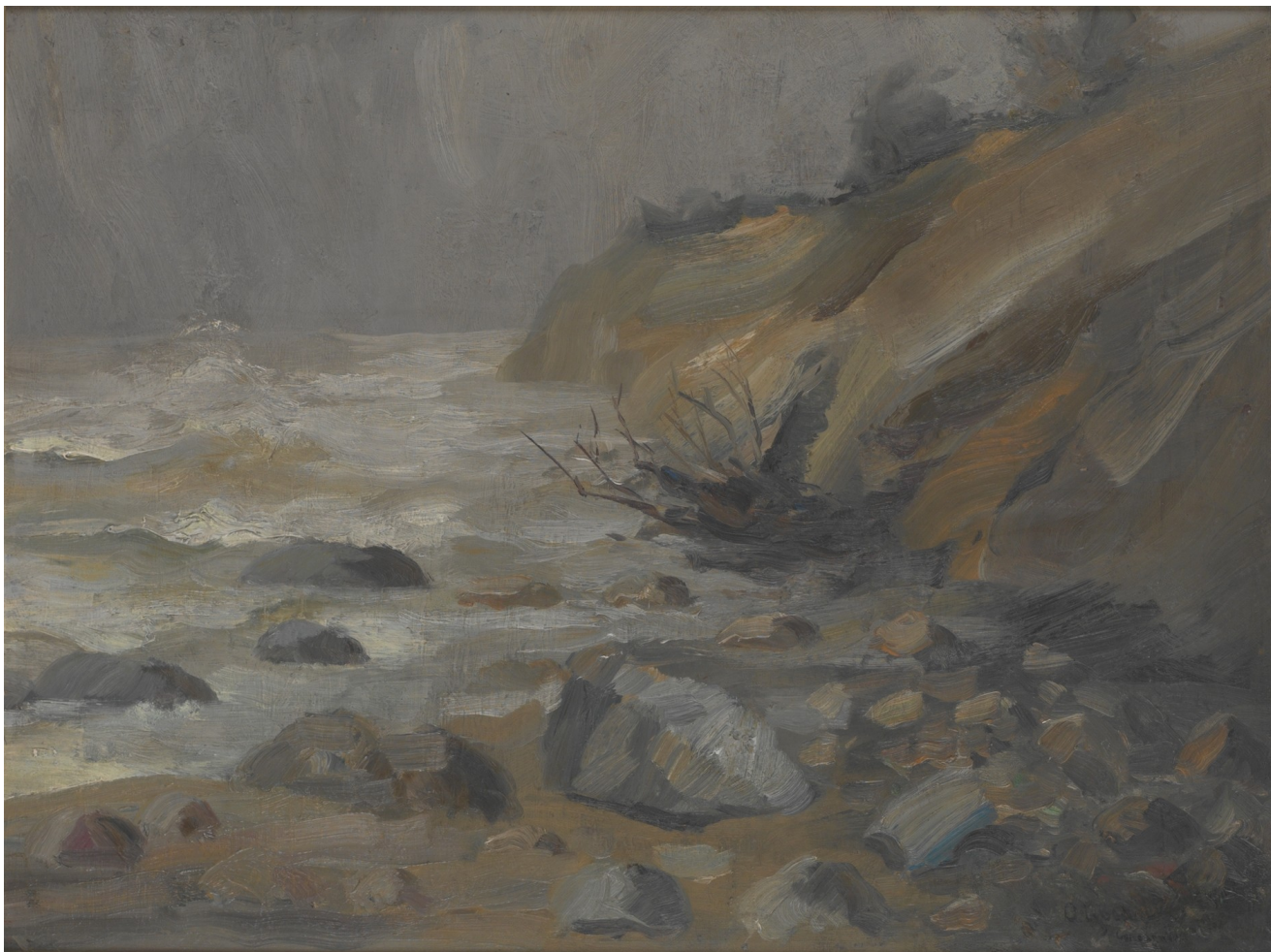
16. Otakar Lebeda: Marina z Concarneau, (1898), olej, lepenka, 48 x 64 cm, Národní galerie v Praze