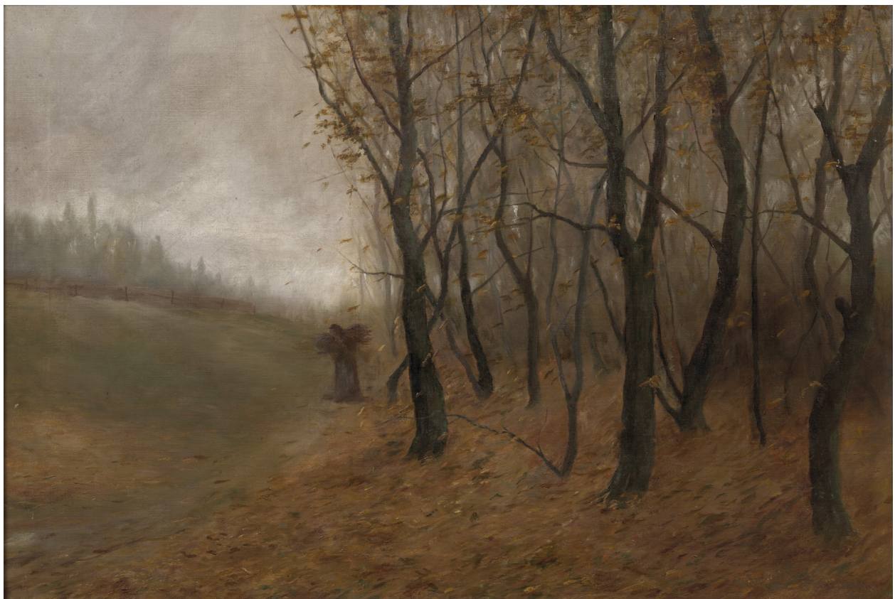
11. Otakar Lebeda: Les, (1896-1897), olej, plátno, 50 x 73 cm, České muzeum výtvarných umění