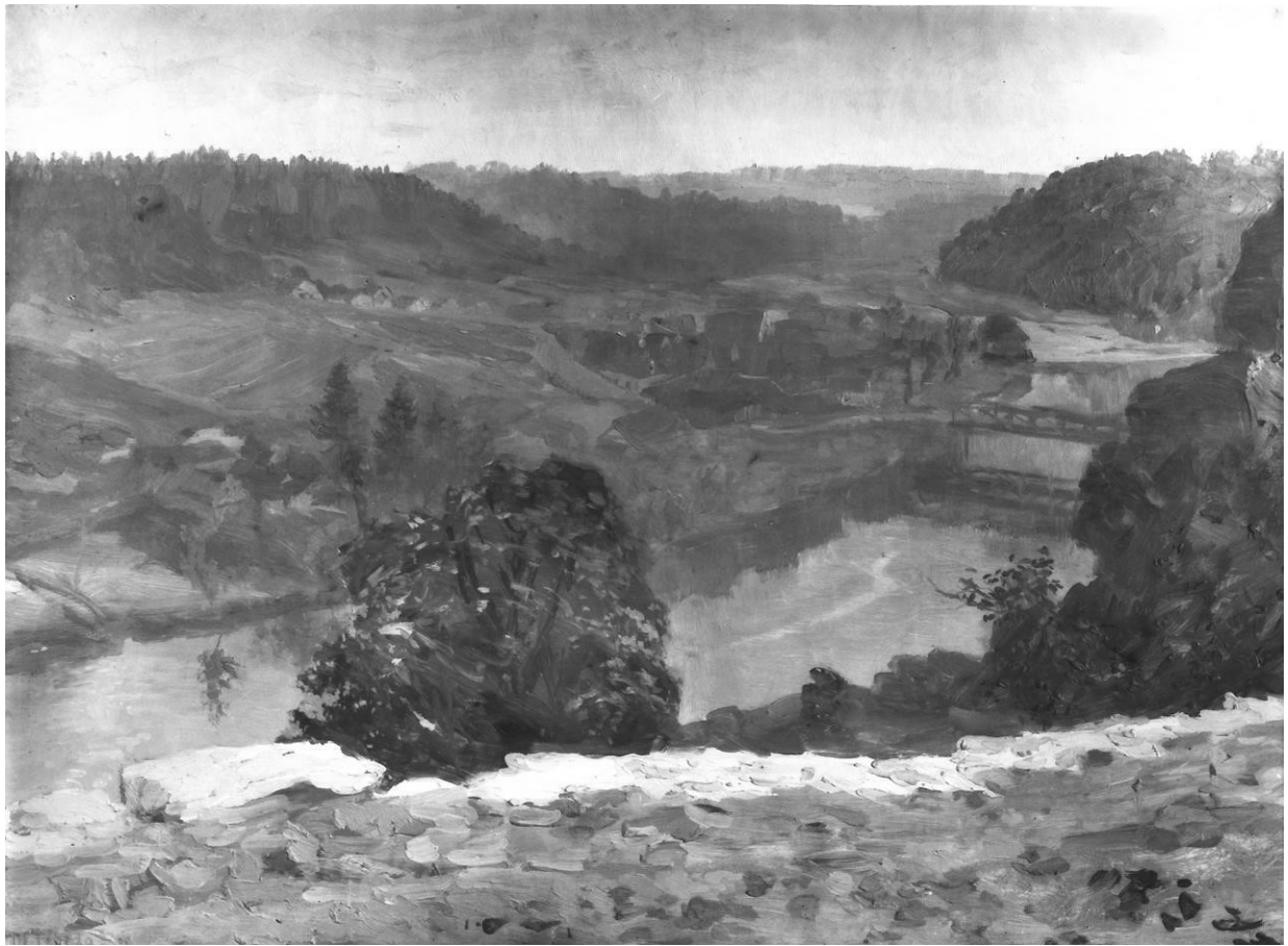
22. Otakar Lebeda: Nad Lužnicí (Z Bechyně), 1899, olej, karton, 50,3 x 66 cm, Národní galerie v Praze