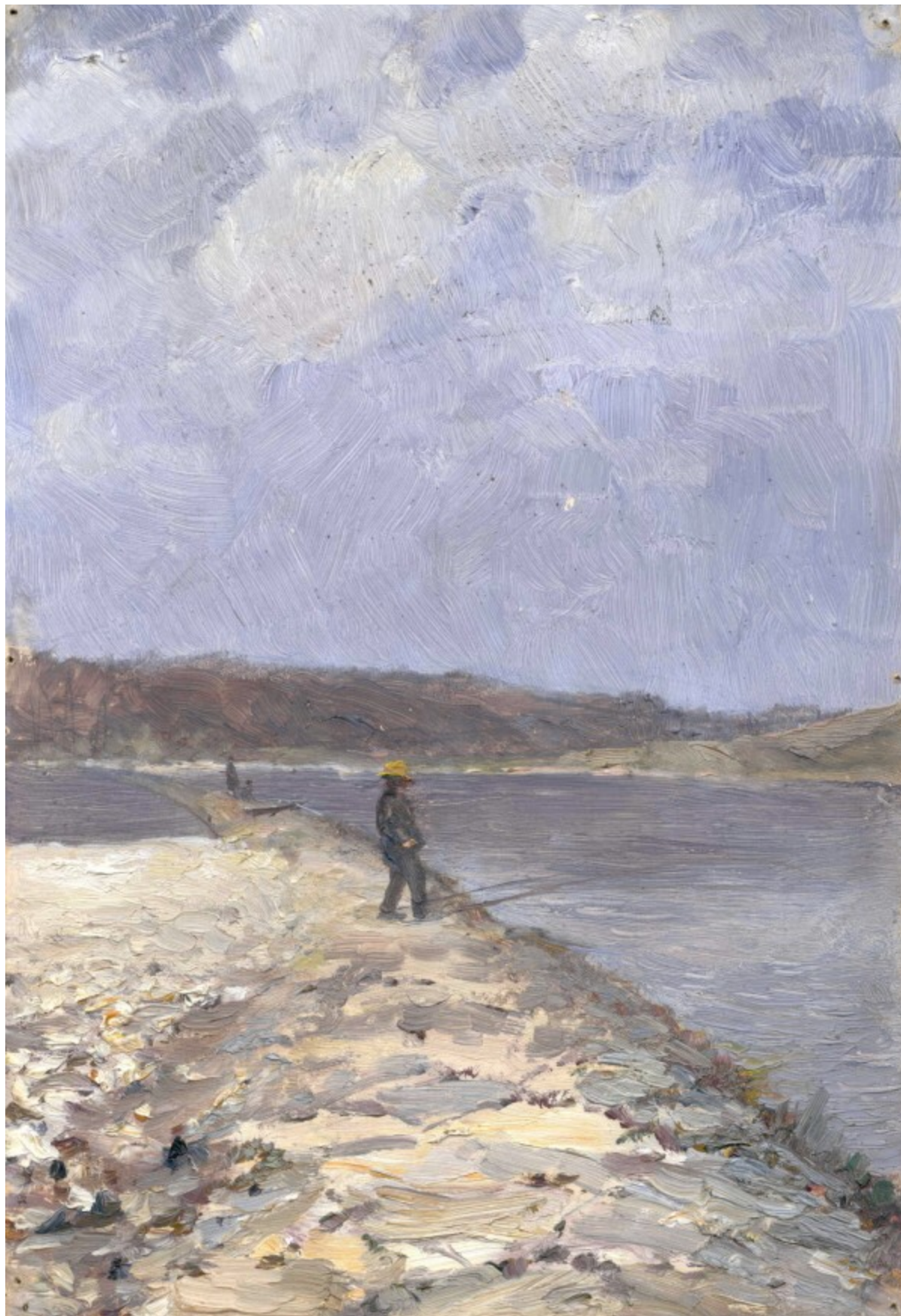
25. Otakar Lebeda: Břeh v Chuchli (Zimní nálada), (1901), olej, lepenka, 29,7 x 20,5 cm, Památník národního písemnictví