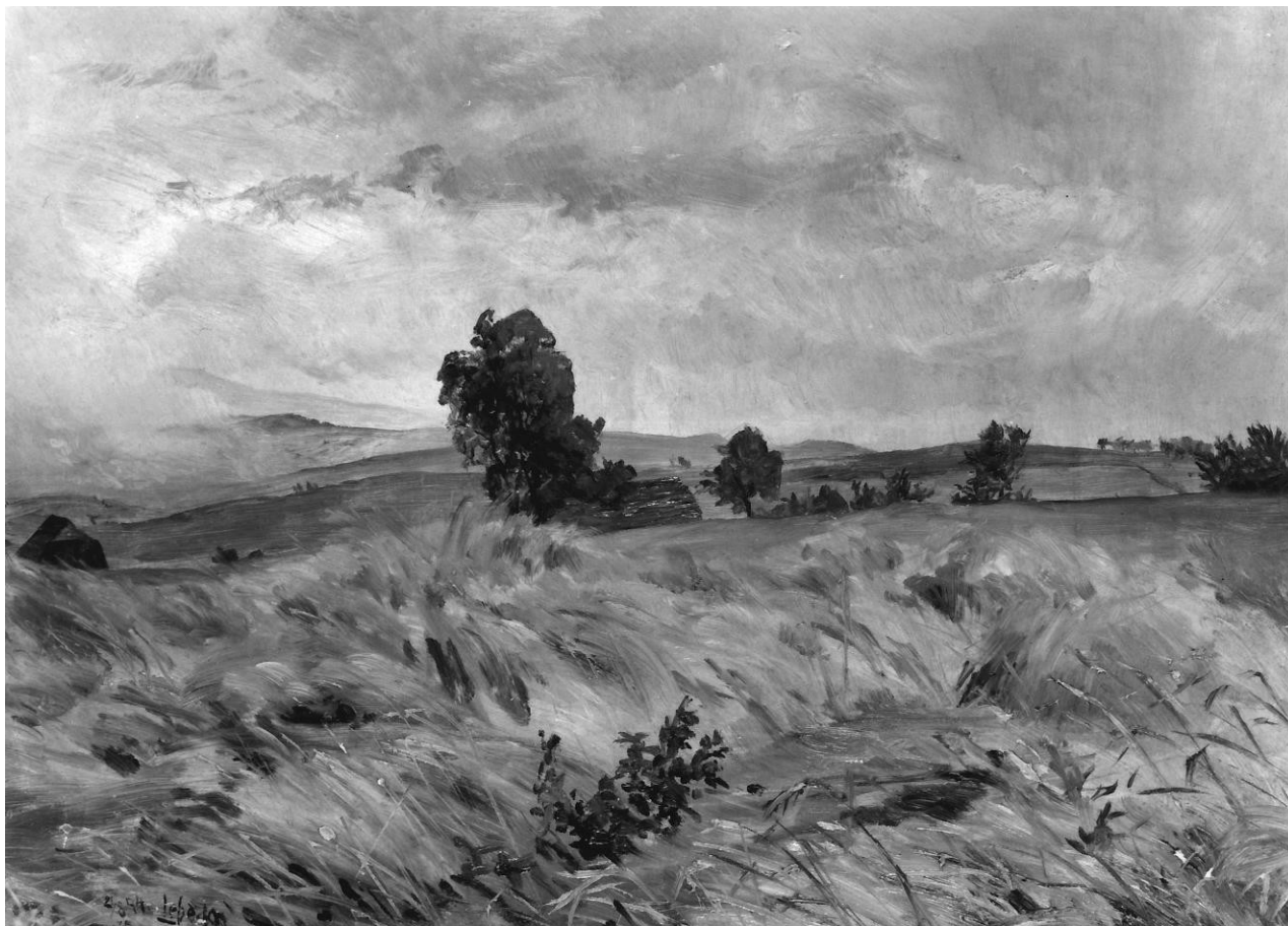
1. Otakar Lebeda: Po bouři, 1894, olej, lepenka, 33 x 45 cm, Národní galerie v Praze