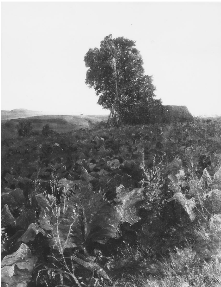
3. Otakar Lebeda: Zelí (Nigrýnova lípa u Vysokého nad Jizerou), (1894), olej, plátno, 53 x 40 cm, Národní galerie v Praze