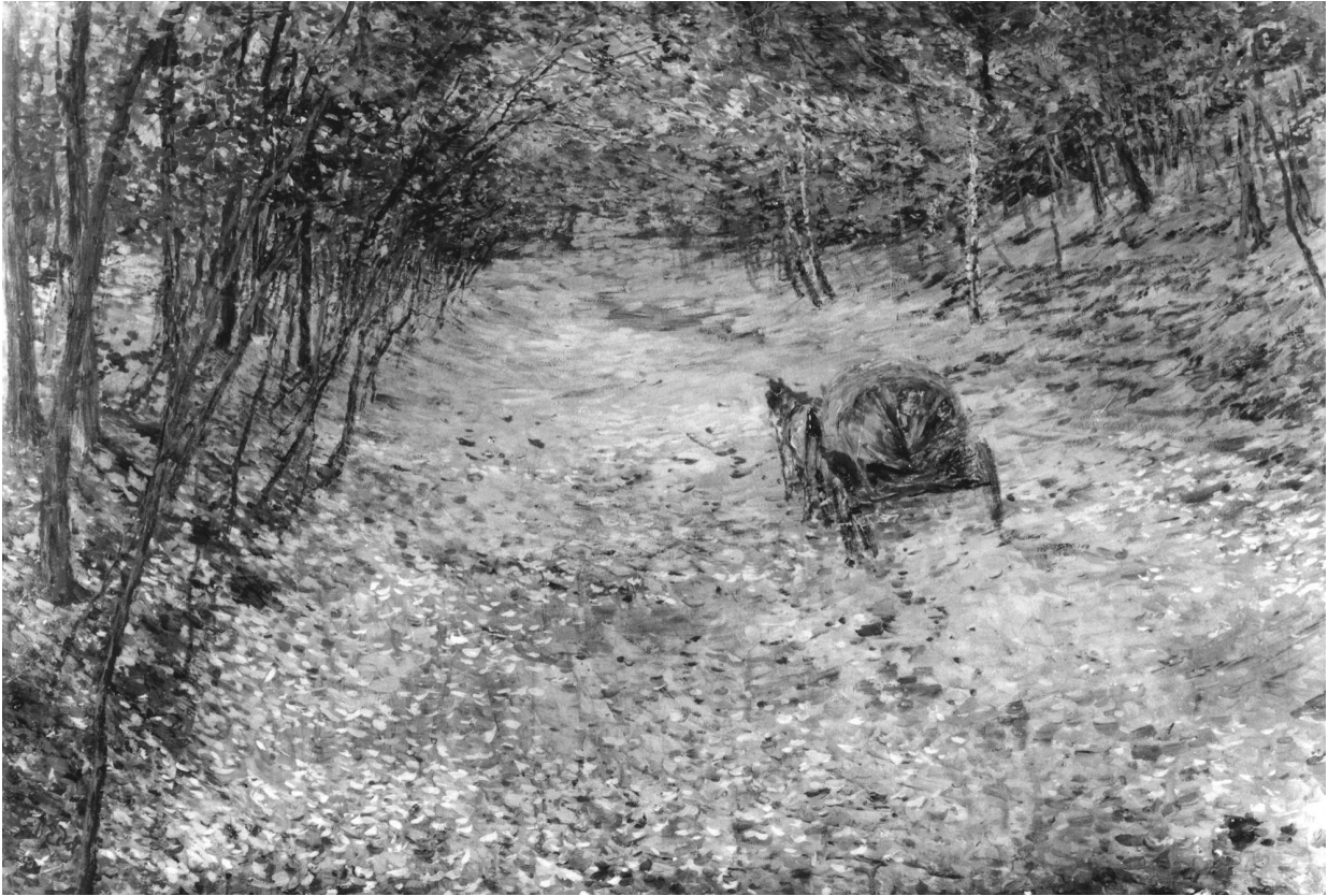
12. Otakar Lebeda: Podzim (Na podzim v mlze), (1897), olej, plátno, 73 x 106 cm, Národní galerie v Praze