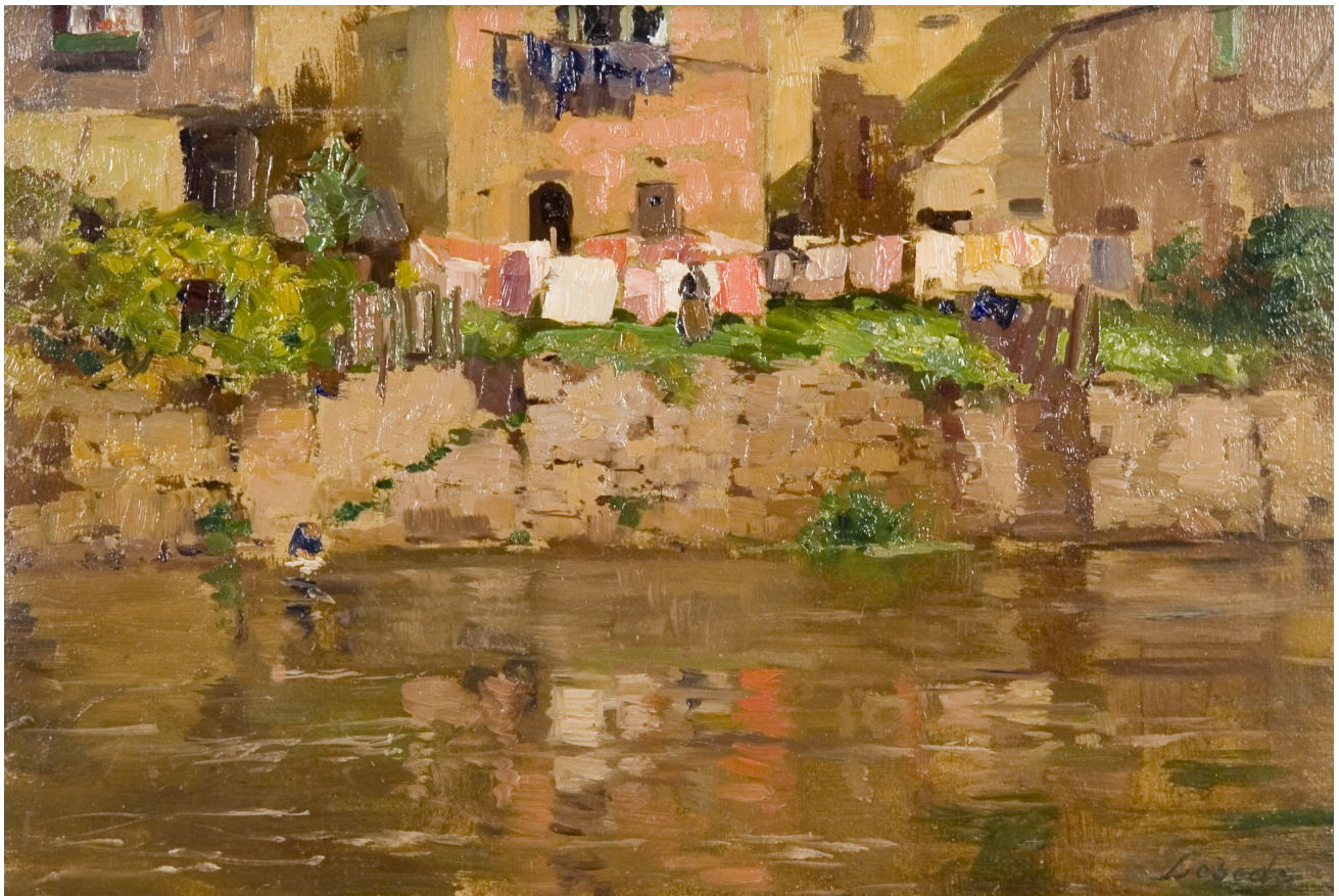
23. Otakar Lebeda: Z Jindřichova Hradce, (1900), olej, lepenka, 24 x 34 cm, soukromá sbírka