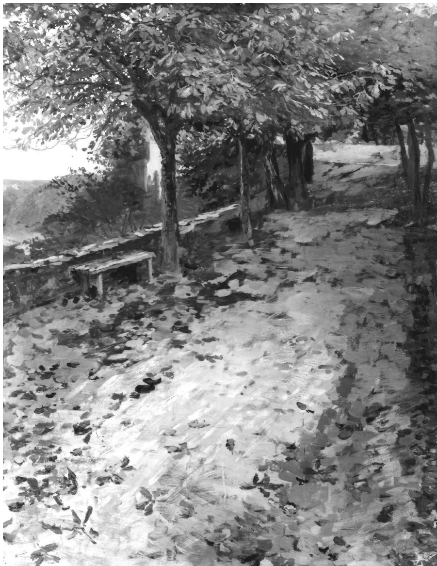
19. Otakar Lebeda: Cesta k bechyňskému zámku, 1899, tempera, karton, 66 x 50 cm, Národní galerie v Praze