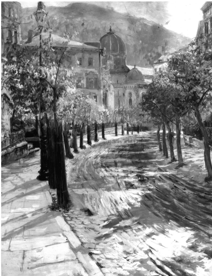
15. Otakar Lebeda: Karlovy Vary (Horní Sadová třída v Karlových Varech), 1898, tempera, karton, 67 x 50 cm, Národní galerie v Praze