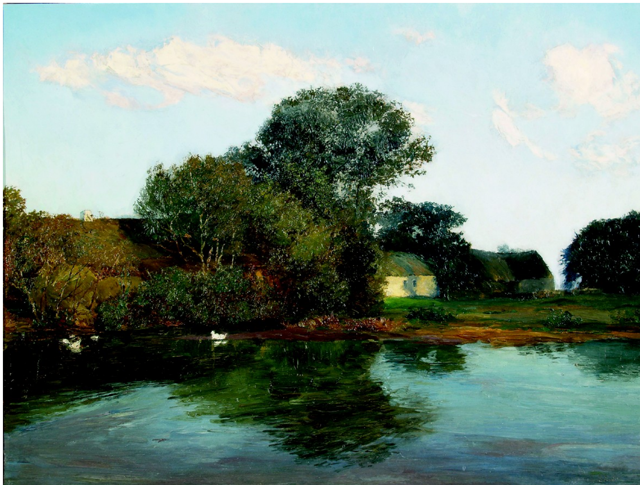
6. Otakar Lebeda: Vesnice s rybníkem, 1896, olej, lepenka, 42 x 54 cm, soukromá sbírka