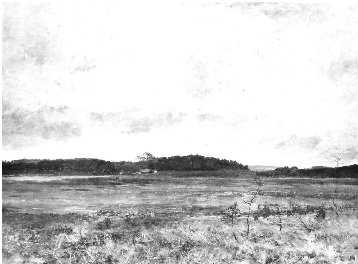
4. Otakar Lebeda: Na vypuštěném Flughause, 1895, olej, plátno, 90 x 119 cm, Národní galerie v Praze