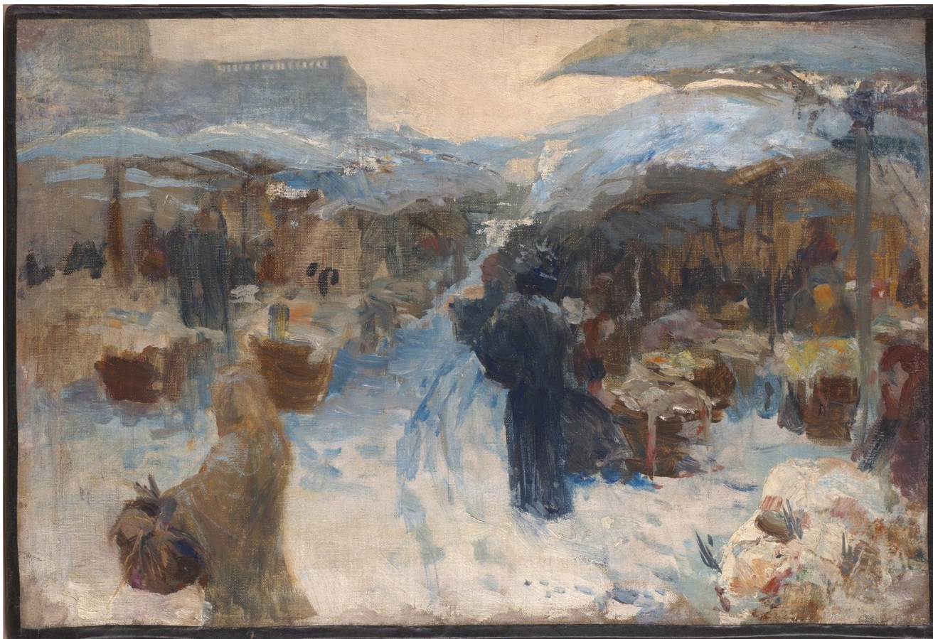
14. Otakar Lebeda: Trh v Paříži, (1897), olej, plátno, 30 x 44,5 cm, Národní galerie v Praze