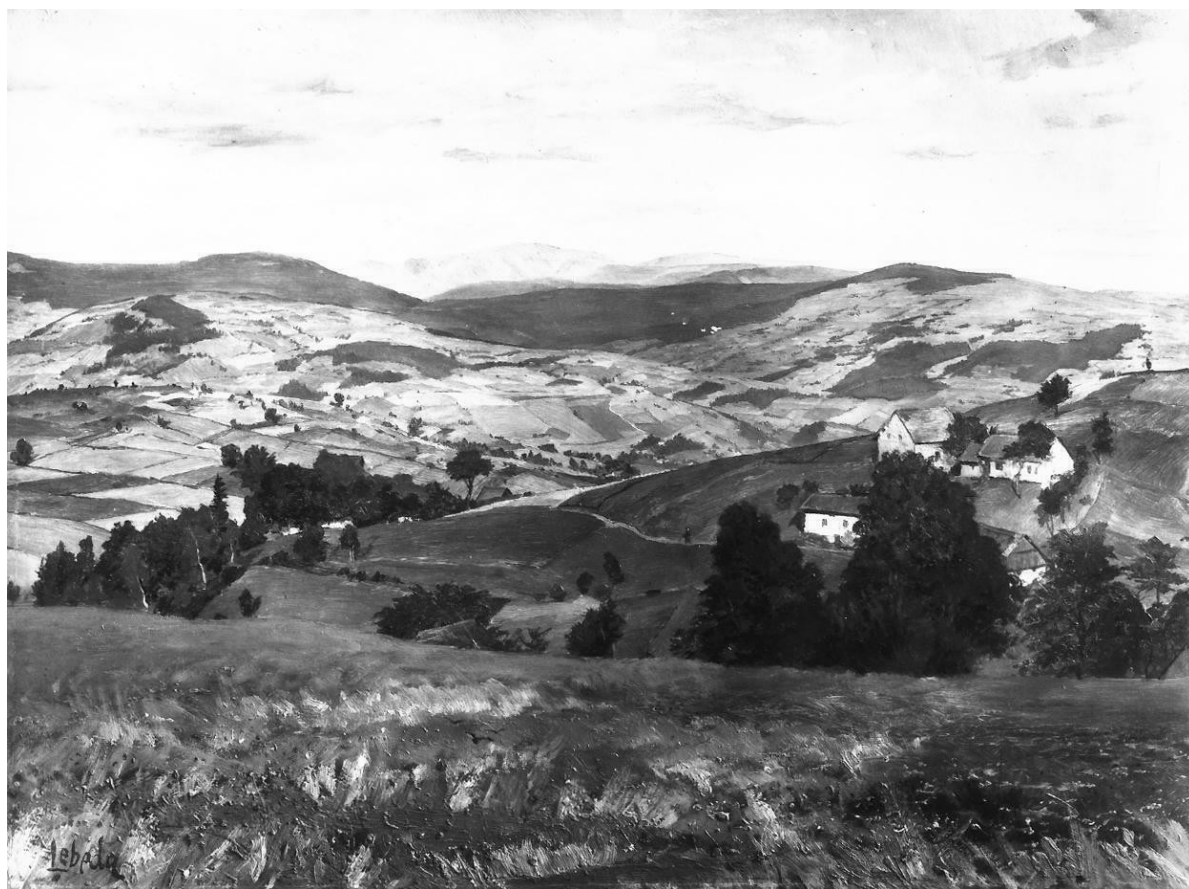
2. Otakar Lebeda: Krkonose od Nigrýnovy lípy, (1894), olej, plátno, 39,2 x 52,5 cm, Národní galerie v Praze