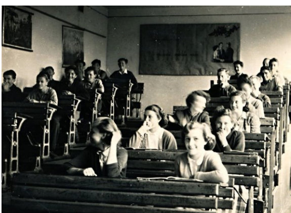
Obrázek č. 6 – Odborná učebna chemie 50. léta

o změně působnosti v oboru škol zemědělských, škol lesnických a vysokých škol zemědělských. Vrchní správa výběrových zemědělských škol včetně příslušných internátů, školních statků a školních budov a dozor nadále spadá pod ministerstvo zemědělství. Obecně vzdělávací předměty vykonává ministerstvo zemědělství v úzké spolupráci s ministerstvem školství, věd a umění. Tělesná výchova pak v úzké spolupráci se Státním výborem pro tělesnou výchovu. (Vládní nařízení o změně působnosti v oboru škol zemědělských, škol lesnických a vysokých škol zemědělských, 1952)