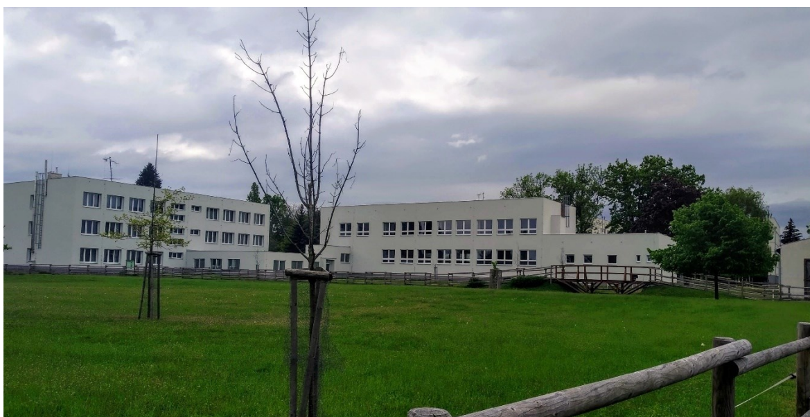
Obrázek č. 9 – Pohled z ekologické zahrady, vlevo domov mládeže vpravo nová přístavba realizovaná v 90. letech

Škola se neustále snaží získávat finanční prostředky pro modernizaci výuky a zvyšování konkurenceschopnosti absolventů na trhu práce. Právě v tomto období získala schválení žádosti na významném projektu, který se nazývá „Školní ekologická zahrada-živá laboratoř“. Probíhá výběrové řízení a v březnu 2014 je zahájena výstavba. (Výroční zpráva 2013/2014, s. 79) Ekologická zahrada by měla sloužit pro výuku principů ekologického zemědělství. Po malé stavební pauze vzniká za školou vkusně upravený pozemek s jezírkiem, voliéry, výběhy pro zvířata, naučná ekologická stezka, dílna se šatnou a sociálním zařízením.