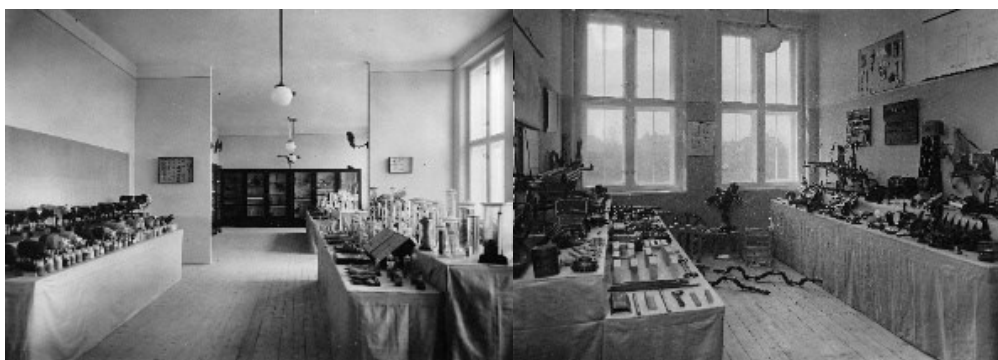
Obrázek č. 4 – Kabinety školních pomůcek v období 30. let