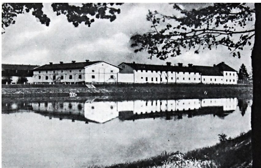
Obrázek č. 3 – Školní statek z 30. let, pohled od řeky Labe

Velké Zboží je část města Poděbrad a školní statek se nachází necelé 2 km od budovy školy. Díky svému velice výhodnému umístění slouží pro školní účely dodnes.