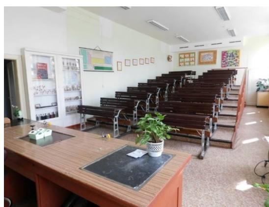
Obrázek č. 7 – Učebna chemie dnes