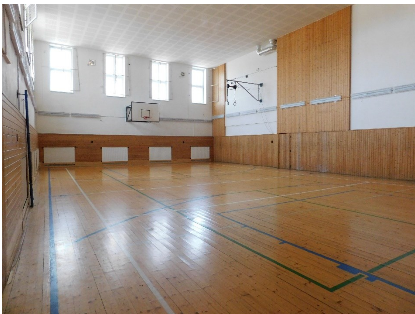
Obrázek č. 8 – Tělocvična, která vznikla přestavbou v r. 1997

garáží a starého drobnochovu. V nové části budovy vzniká už zmíněná jídelna s kuchyní a knihovna. Staré šatny se přesouvají na místo původní jídelny. V neposlední řadě se pamatovalo i na novou aulu a školní bufet. Nově postavená aula má mnohostranné využití. Slouží jako konferenční sál s kapacitou pro 140 posluchačů. Na jaře roku 1997 je aula plně k dispozici a je zde poprvé slavnostně předáváno maturitní vysvědčení.