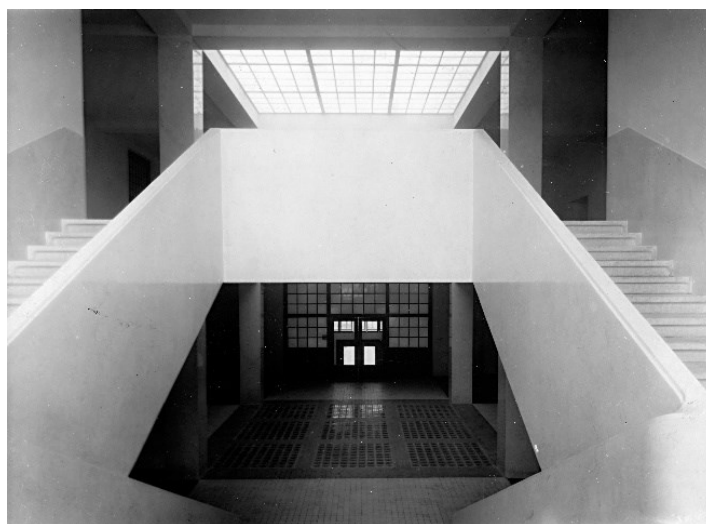
Obrázek č. 2 – Schodiště s luxferovou podlahou a světlíkem

Škola patří mezi významné budovy a je ozdobou města Poděbrady.