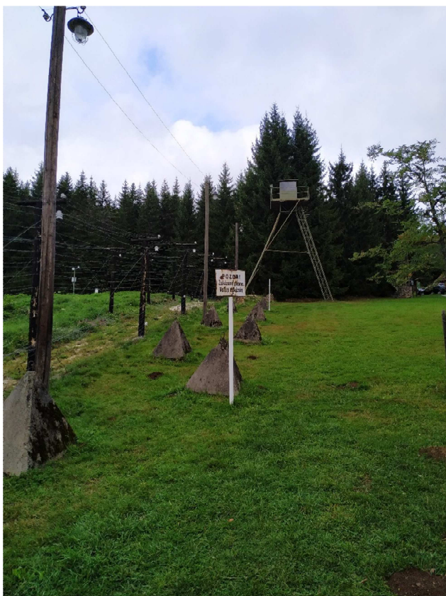
Obrázek 4: Elektronické zabezpečení ochrany hranic (EZOH), betonové protitankové jechlany, v pozadí pozorovatelna („špačkárna“). Replika železné opony na území zaniklé obce Bučina.