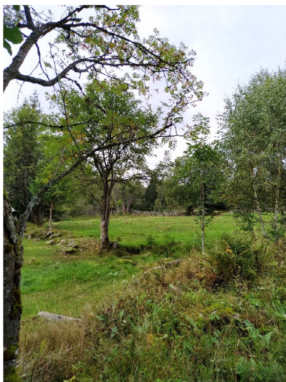
Obrázek 8: Pozůstatky obydlí na území zaniklé obce Bučina.