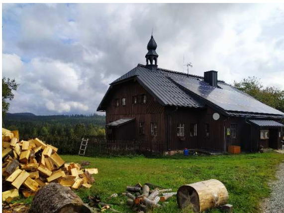
Obrázek 14: Aktuální podoba jediné dochované budovy na území zaniklé obce Knížecí Pláně, bývalá hájovna, aktuálně restaurace. Archiv autorky, 2019.