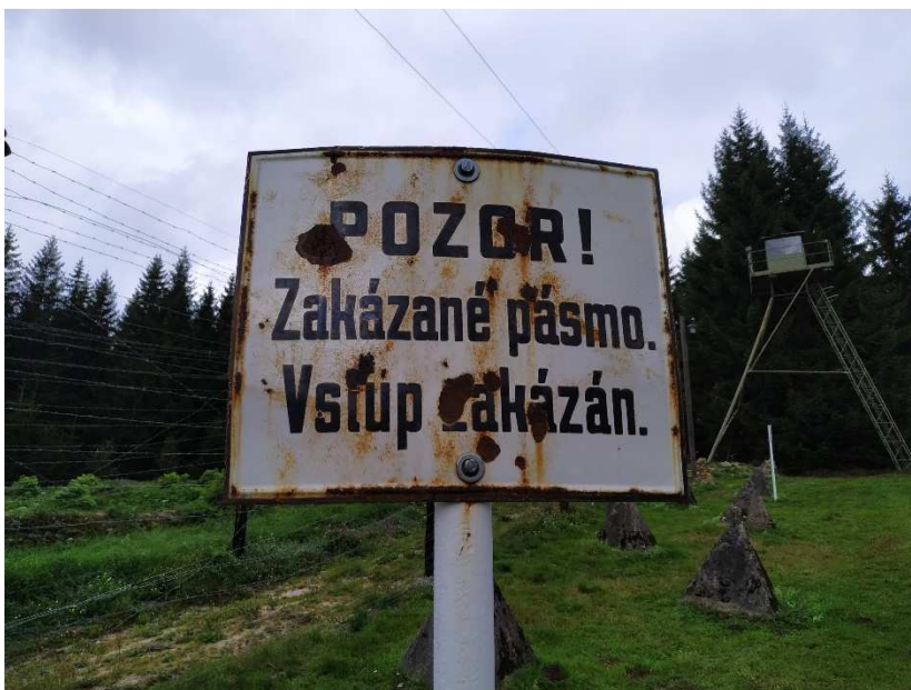
Obrázek 3: Tabulka označující zakázané pásmo. Replika železné opony v zaniklé obci Bučina.