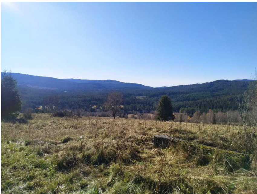
Obrázek 5: Současná podoba zaniklé obce Stodůlky.