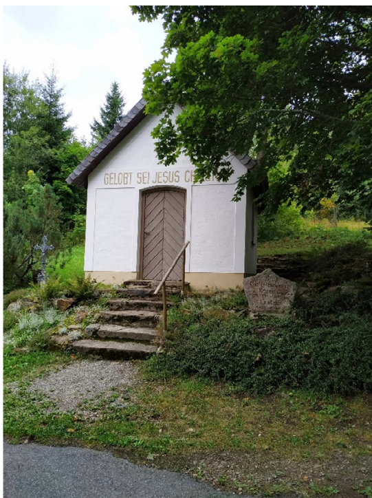
Obrázek 9: Obnovená kaple svatého Michala (1992) na území zaniklé obce Bučina.