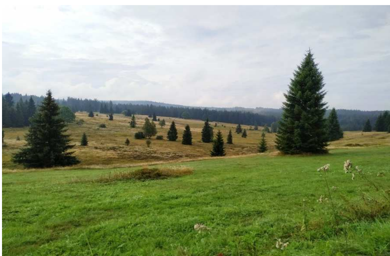
Obrázek 12, 13: Současná podoba zaniklé obce Knížecí Pláně.