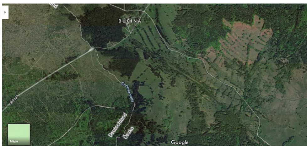
Obrázek 10: Letecká mapa zaniklé obce Bučina, na které jsou dobře vidět krajinné pozůstatky osídlení. Je zde vidět i potok Čertova voda, který tvoří přirozenou státní hranici České republiky s Bavorskem.