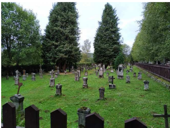
Obrázek 15: Aktuální podoba obnoveného hřbitova v zaniklé obci Knížecí Pláně.