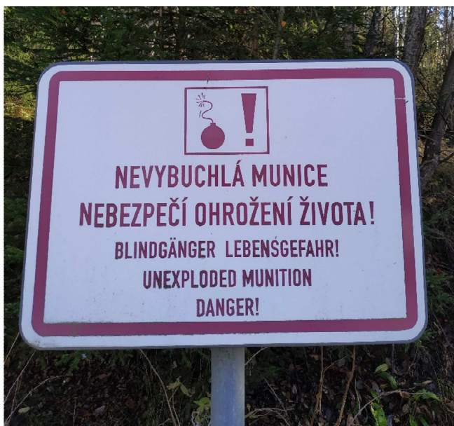
Obrázek 6: Tabule upozorňující na nevybuchlou munici v okolí zaniklé obce Stodůlky. Archiv autorky, 2020.