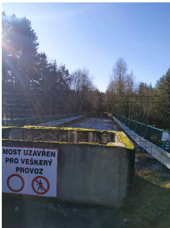
Obrázek 7: Současný stav mostu přes řeku Křemelnou, území zaniklé obce Stodůlky. Archiv autorky, 2020.