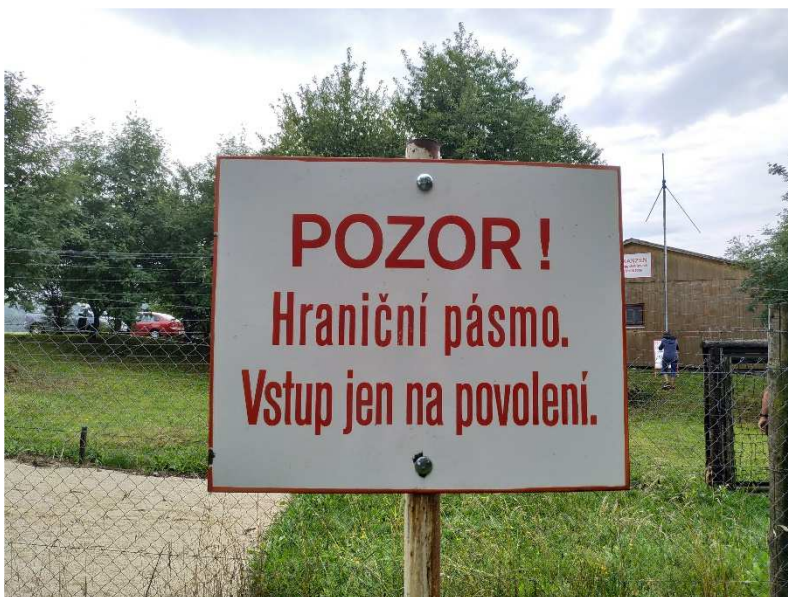
Obrázek 2: Tabulka označující hraniční pásmo. Skanzen ochrany státní hranice a železné opony v Nových Hradech.