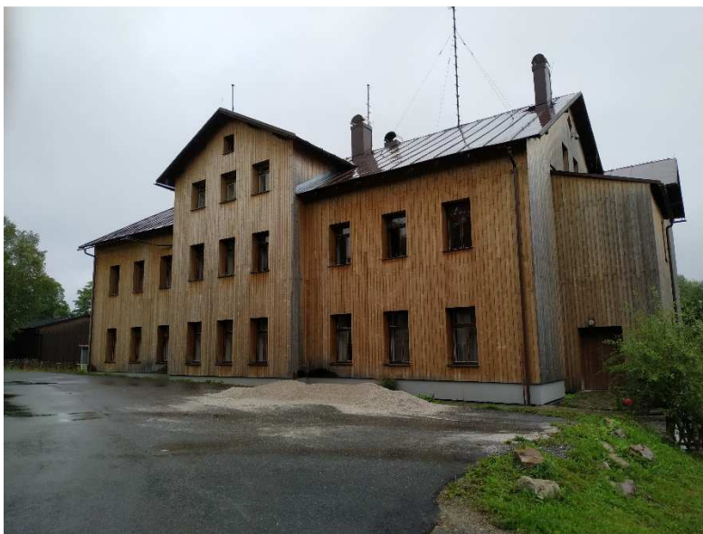
Obrázek 1: Rota pohraniční stráže v Prášílech, aktuální podoba.