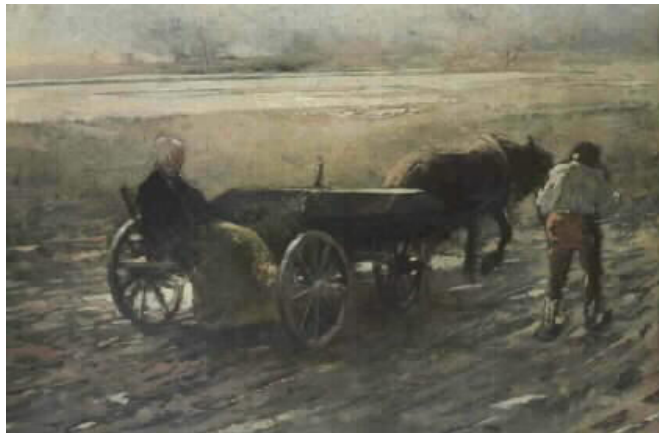
Jakub Schikaneder: Smutná cesta (Truchlivý návrat), 1886

„Zvoní hrana. Na marách tělo vynášejí: bílá družička, planoucí svíce; pláč, bédování, trouby hlaholíce z hlubokosti znějí: Miserere mei!