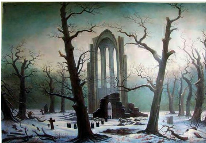
Caspar David Friedrich: Zasněžený hřbitov Cloister, 1817-19

Pochovejte mne v podzelený les tam na mém hrobě kvěsti bude vřes; ptáčkové mi tam budou zpívati: srdéčko moje bude plesati.“