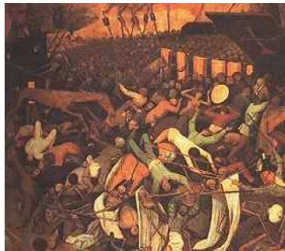
Pieter Bruegel: Triumf smrti, okolo 1562 (detail)

Skrze univerzálnost smrti byl v baroku nazírán sám život jako marnost a bezcennost, člověk byl jen dýmem a lidské tělo budoucím pokrmem pro červy (Navrátilová, s. 169), proto „hříchem by bylo krmiti pochoutkami tu blátivou schránku duše a budoucí pytel červů“ (Čech, Nový epochální výlet... , s. 256). Obdobně na konci 19. století „umělec uváděl neustále smrt do souvislosti s životem, aby tak proměnil časnost ve věčnost a dal smysl lidskému přebývání ve světě; konfrontace se smrtí se stala základním předpokladem pro naplněný život. Jinak si nelze vysvětlit onu adoraci smrti, 20 která je tak příznačná např. pro symbolistně dekadentní poezii“. (Med, in Fenomén smrti..., s. 284) Literatura konce 19. století se přitom zaměřovala spíše na agónii umírání než na smrt samu. Velice barvitý popis dlouhotrvajícího umírání nacházíme např. u Holečka: „Z komory