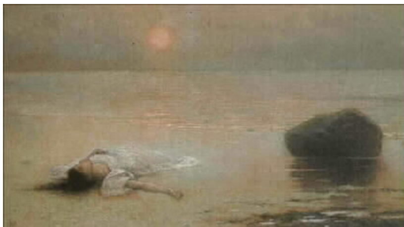
Jakub Schikaneder: Utonulá, 1893

Nížádného hrobu jí být nemělo jen kámen veliký tlačí její tělo.“ (s. 66)