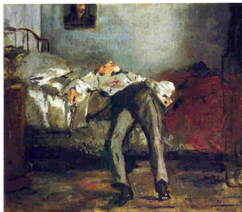
Edouard Manet: Sebevrah, 1870

Dokonáno je i na Manetově obraze. Vidíme na něm mladého muže s prostřelenou hrudí, zhrouceného na pelesti. V ruce ještě křečovitě svírá pistoli. Na zemi se tvoří tratoliště krve... Není divu, že Manet tímto dílem pobořil útlocitnou měšťáckou společnost.