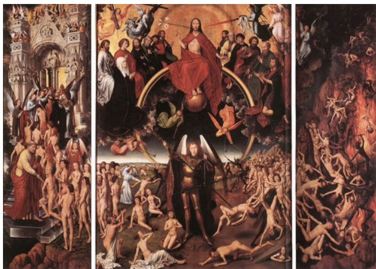
Hans Memling: Gdaňský triptych, 1466 – 1473