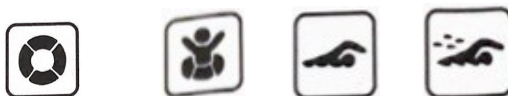
Obrázek 3: Ikony používané v učebnici Čekogo hjógen tokoton toréningu (2013).

S ikonami pracuje i Čekogo hjógen tokoton toréningu (2013), která používá ikonu plovacího kruhu k upozornění na přítomnost lingvodidaktického výkladu a tři ikony symbolizující plavce k rozlišení obtížnosti kontrolního cvičení. Nejlehčí úlohy jsou označeny ikonou plavce s plovacím kruhem, středně těžké ikonou plavce v moři a těžké úlohy pak ikonou plavce v moři, za nímž odšťikuje voda: