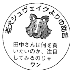
Obrázek 1: Rady starého psa Švejka.

využívá ikonu psa („rady starého psa Švejka“), učebnice Njú ekusupuresu čekogo (2019) pak ikonu vykřičníku („pozor“).